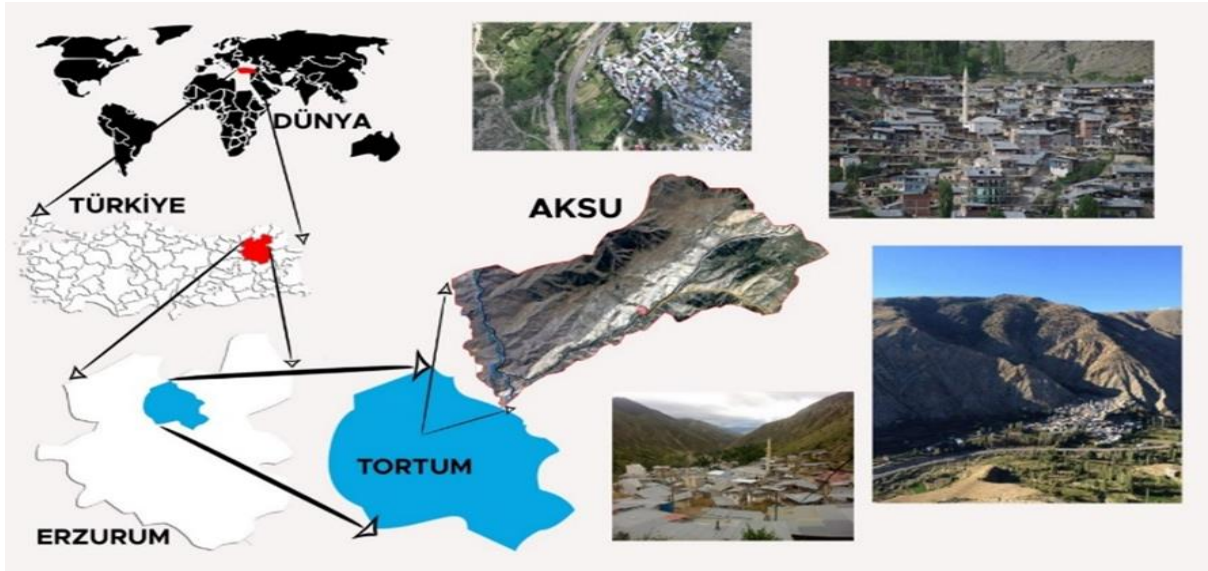
Şekil 2. Aksu Köyü Harita Konumu ve Resimleri

Hınıs, konum olarak Erzurum'un en soğuk bölgesinde bulunmasından dolayı kış ayları yılın yarısından fazlasında sürebilir. Yüz ölçümü 1367 km 2 olan ilçe karasal iklimin şiddetli yaşandığı bölgelerden birisidir. Araziler genel anlamda çıplak bir görüntüye sahiptir (Karaca ve ark., 2018). Dağlık ve engebeli arazi yapısına sahip olan Hınıs'ta, genel anlamda tarım, hayvancılıktan daha yaygındır (Çizelge 1). Hayvancılığın yaygın olması nedeniyle ilçenin büyük kısmı meralardan oluşmaktadır. En düşük rakımı 1550 m en yüksek rakımı ise 3070 m'dir. Geniş ova ve dağlık arazilere sahiptir. Bölgede az sayıda ağaç bulunmaktadır ve bu ağaçların çok azı meyve ağacıdır. Ovaçevirme köyü merkeze 11 km, göçün çoğunluğunun yaşandığı