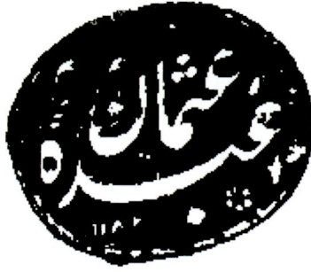
Resim 1 Osman Ağa'nın mührü