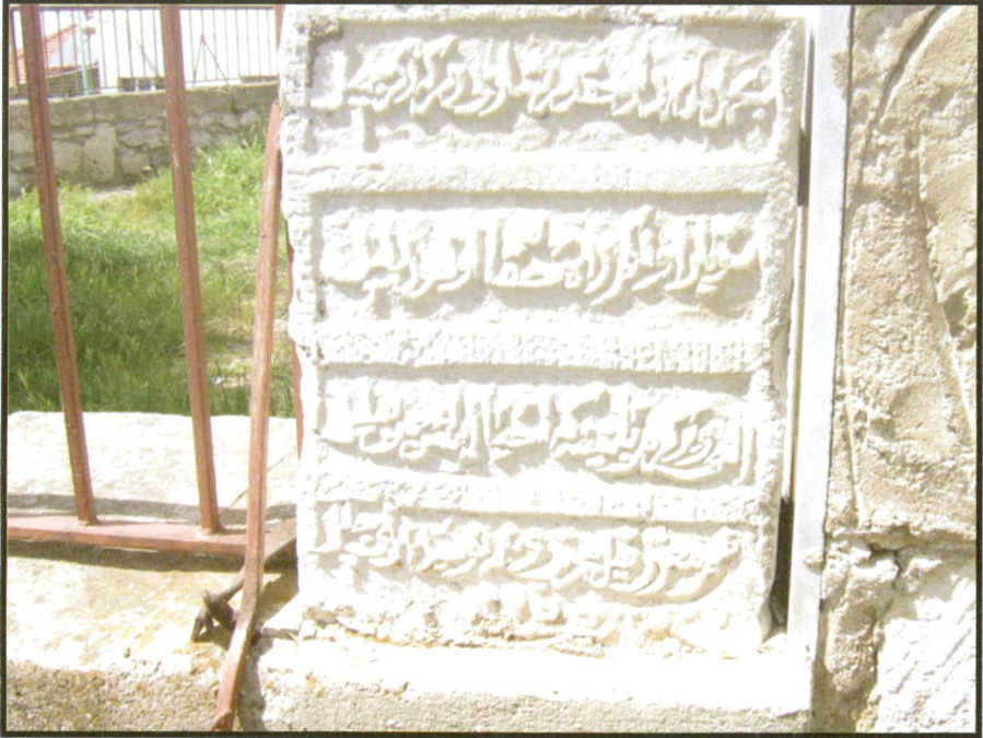
Resim 2 Hırka Camii Dış Kapı Kitabesi