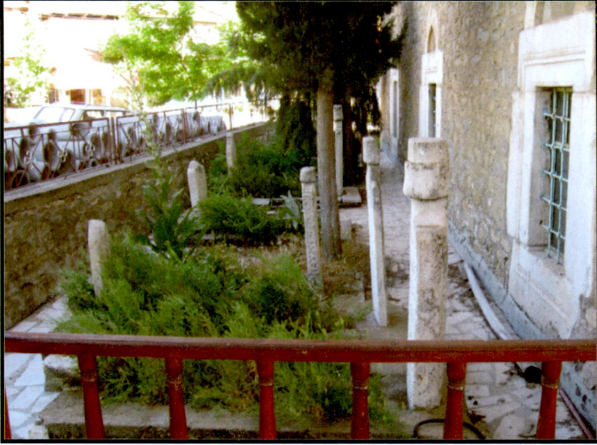
Resim 5 Hırka Camii Haziresinin Yandan Görünüşü