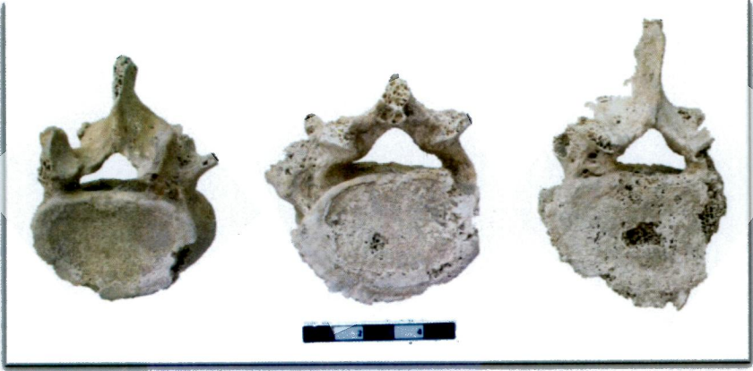
Resim 6: Kalecik bireylerinde osteofit ve schmorl nodülü.