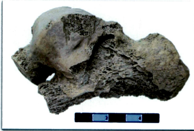
Resim 5: K10 mezarı 3 numaralı bireyde romatoid artrit.