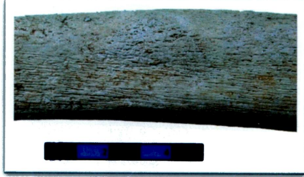
Resim 3: K11 mezarında 5 numaralı bireyde periostitis.