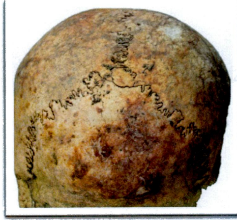
Resim 1: K10 mezarında 1 numaralı bireyde porotic hyperostosis