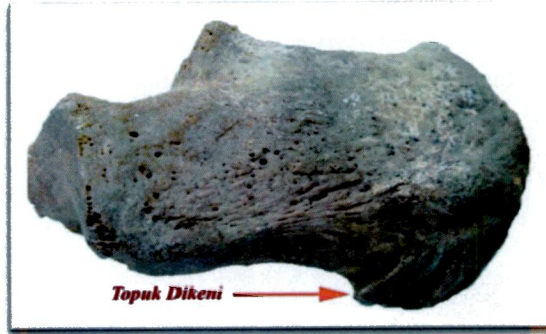
Resim 2: K10 mezarında 8 numaralı bireyde topuk dikeni oluşumu.