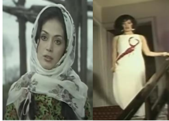
Görsel 1. Güllü'nün Değişimi

Güllü (1971) filmi, Pygmalion etkisi üzerinden kadın bedeninin dönüşümü bağlamında ele alındığında, neredeyse tüm melodramlarda karşılaşılan kadının sınıf atlaması ve modernleşmesi üzerinden ilerleyen olay örgüsü ile karşılaşılmaktadır. Pygmalion etkisi açısından değişim her zaman erkeğin isteği ve arzusu doğrultusunda gerçekleşmekte ve erkek değişen kadına âşık olmaktadır. Güllü karakterinin de değişime ikna edilmesinin yine aynı doğrultuda gerçekleştiği görülmektedir. İkiz kardeşi rolüne giren Fikret, Güllü'yü ölen kocasının kendisini değişmiş görmeyi arzu ettiğini söylemesi ile gerçekleşmiştir. Erkeğinin son arzusunu yerine getirmeyi kabul etmesiyle Güllü karakterinin değişimi başlamaktadır. Görsel 1'de Güllü'nün değişimi yer almaktadır.