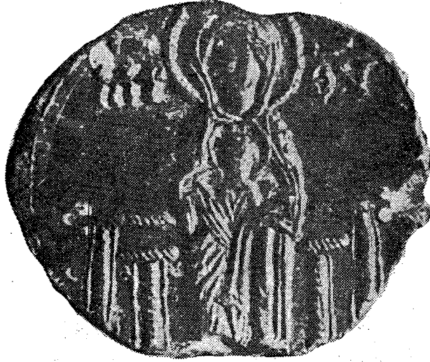
Res. 1. Kurşun mühürün ön yüzü