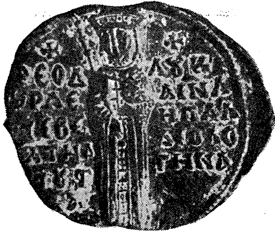
Res. 2. Kurşun mühürün arka yüzü