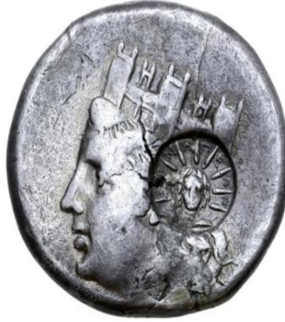
Resim 3 SNG XI No. 787 (William Stancomb Collection)