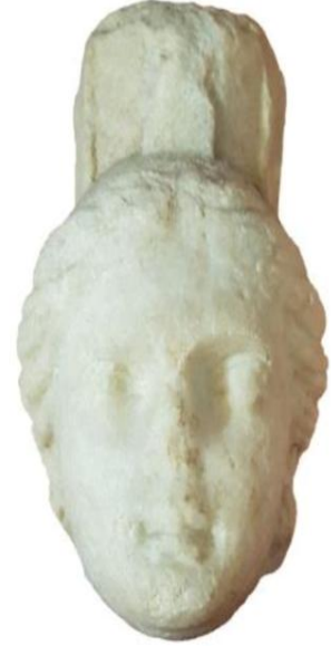
Resim 4 Dereli, 2010, s. 50 (Sinop Arkeoloji Müzesi)