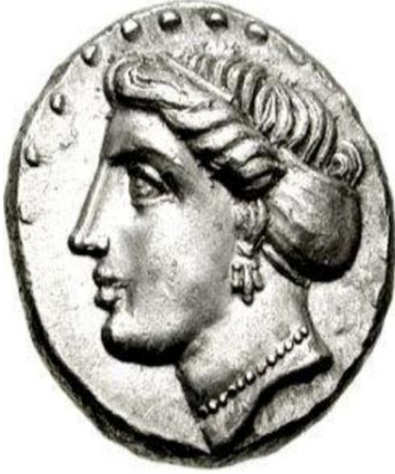
Resim 2 SNG IX No. 1481 (British Museum)