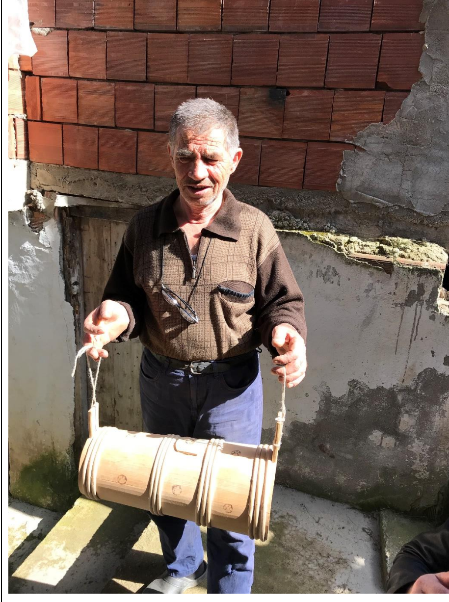
Foto 1. Kürtün yöresinde üretilen ahşap el sanatı ürünlerinden yayık.

doğal ahşap mutfak araçları el yapımı olarak imal edilmektedir (Foto 1). Yukarı Uluköy Mahallesi'nde geçmişte 10 usta tarafından üretilen söz konusu ürünlerin üretimi günümüzde sadece iki usta tarafından sürdürülmektedir.