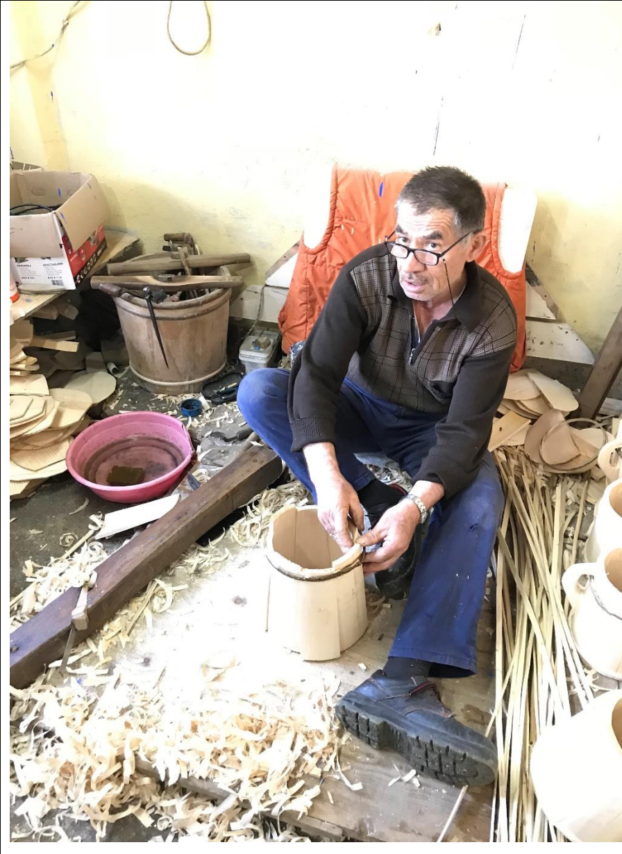
Foto 3. Kuşak bağlama işleminde fındık dalı, kap ölçüsünde ayarlayarak çivisiz olarak tahtaların birbirine bağlanması için kullanılır.