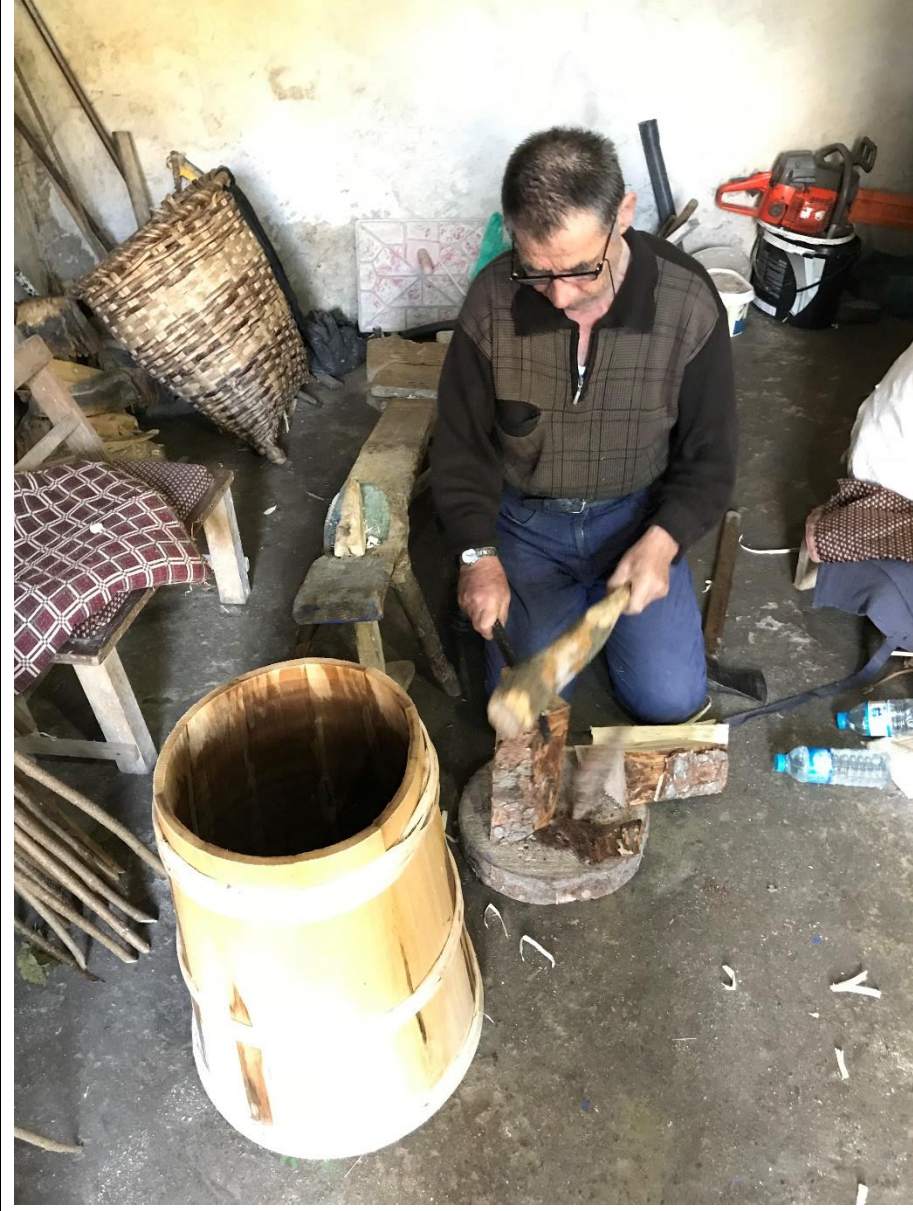
Foto 2. Ahşap ürünlerin üretiminde ilk safhayı kurumuş ladinden elde edilen hammaddenin ince ince yarılmaları ve tahta haline getirilmesi oluşturmaktadır.

9. Havya denen aletle kabın üzerine motif çizilerek işlem tamamlanmaktadır (Foto 5).