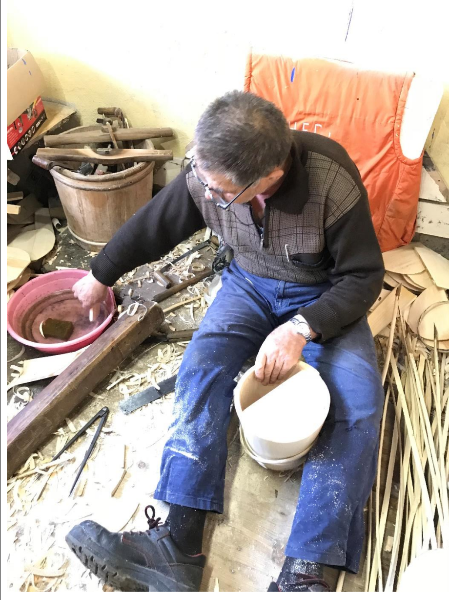
Foto 4. Tabanlık kısmının hazırlanması işlemi, altı pergel çapında olacak şekilde ölçülüp ayarlanarak, ölçüye göre kabın tabanına yerleştirilecek gerçekleştirilmektedir.