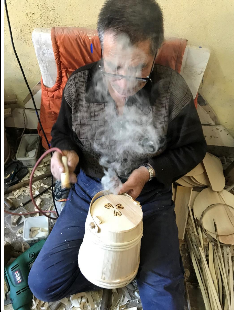
Foto 5. Ahşap ürünlerin üretiminde hava denen aletle kabın üzerine motif çizilerek işlem tamamlanmaktadır.