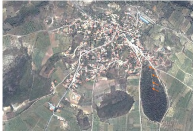
Görsel 1: Umurbey Köyü mezarlığı (Yavuz, 2013: 366)

Sakarya ve çevresi, eski çağlardan bugüne dek İstanbul gibi büyük şehirlerin hinterlandında önemli bir bölgeyi oluşturmuştur. Bu bakımdan gerek jeopolitik gerekse jeostratejik olarak tarih boyunca ideal bir yerleşim alanı olarak kabul görmüştür. Geyve ise Başbakanlık Devlet Arşivleri ve Vilayet Salnamelerine göre 1530'lardan 1953'e kadar Kocaeli'ne bağlı bir kaza iken 1954 yılında Sakarya'ya bağlanmıştır (Sezen, 2017: 289). Geyve ilçesi, verimli topraklara sahip oluşu ve geçiş yolları üzerinde bulunması nedeniyle önemli bir ilçedir (Işık, 2005: 49-55). Sakarya ilinin Geyve ilçesine bağlı bir köy olan Umur Beyi, il merkezine 40 km, Geyve ilçesine 5 km uzaklıktadır.