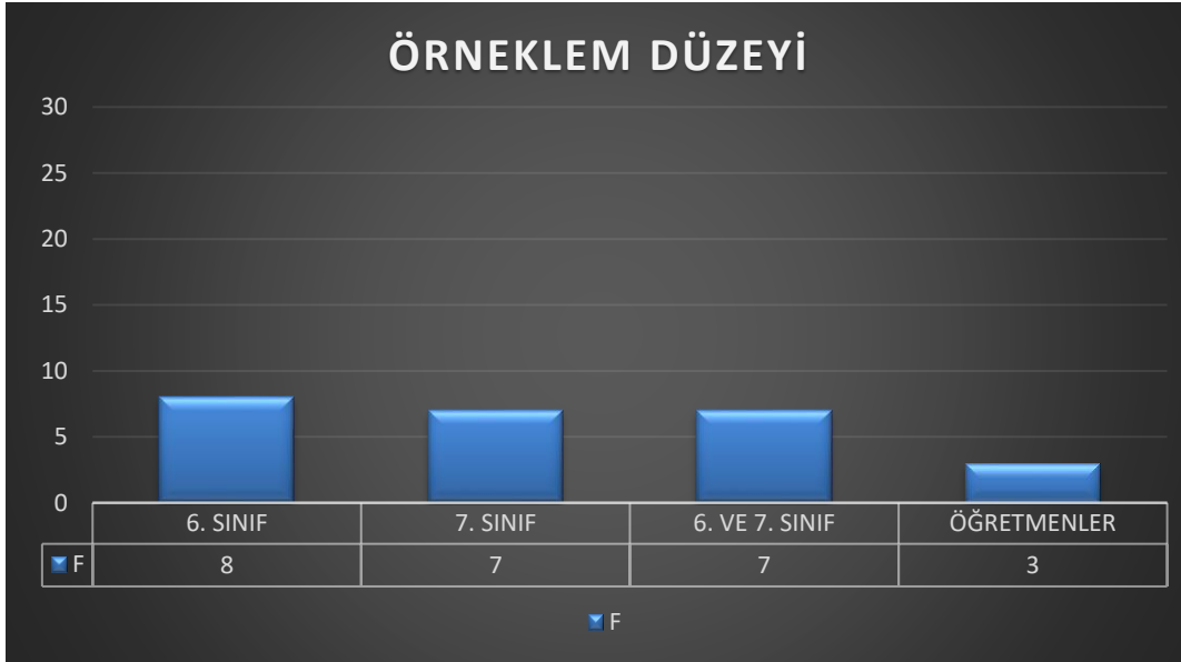
Şekil 1: Sosyal Bilgiler Eğitimindeki Araştırmalarda Kullanılan Örnekleme İlişkin Bulgular

Tablo 2’den de anlaşılacağı üzere araştırmacılar, Sosyal Bilgiler eğitimi üzerine yaptıkları araştırmalarda, nitel yöntemler içerisinde en çok “ doküman analizi ” yöntemini tercih ettikleri tespit edilmiştir. Bunu “ olgubilim yöntemi ” ve “ eylem araştırması ” yöntemi izlemektedir. Sosyal Bilgiler eğitimi ile alakalı olarak en az kullanılan araştırma yöntemlerinin ise “ durum çalışması ” ve “ kuram oluşturma ” yöntemleri olduğu saptanmıştır. Sosyal Bilgiler eğitimi çalışmalarında kullanılan örneklemeyle yönelik bulgular Şekil-1’de sunulmuştur.