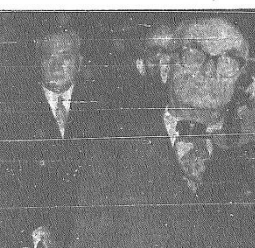
Nihat bilânço: 464 mahkûmiyet 128 beraet