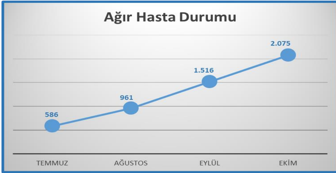
Grafik 3: Türkiye’de COVID-19 Ağır Hasta Durumu

Türkiye’de salgınla ilişkili vakalar 11 Mart 2020 itibarıyla görülmeye başlanmıştır. Açıklanan veriler arasında ağır hasta durumu belirtilmiyordu. Temmuz ayı itibarıyla bu veriler güncel olarak yayınlanmaya başladı. Grafikte görüleceği üzere resmi verilere göre temmuz ayı sonu itibarıyla ağır hasta 586, ağustos ayı sonu itibarıyla 961, eylül ayı sonu itibarıyla 1.516 ve ekim ayı sonu itibarıyla 2.075 olmuştur.