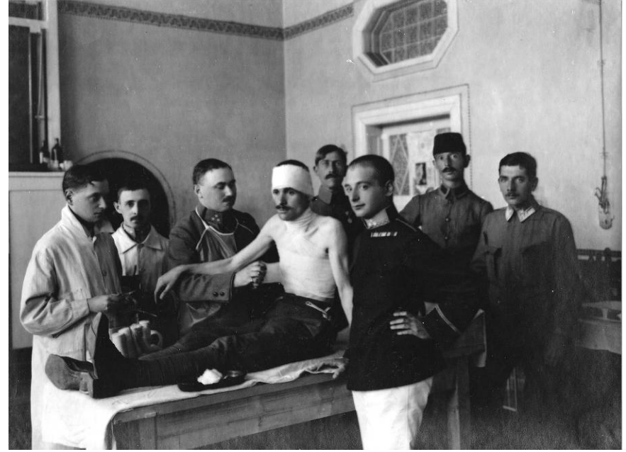
Resim 2. Avusturya-Macaristan hastanelerinden birinde sargı eğitimi verilen Osmanlı askerleri. (İ.Ü. İstanbul Tıp Fakültesi, Deontoloji ve Tıp Tarihi Anabilim Dalı Arşivi, Hulusi Fuad Tugay Dosyası).

Göding kasabesindeki karargâhta da sadece yaralı ve hasta Osmanlı askerlerinin bakımına tahsis edilmiş iki hastane bulunuyordu. Bunlar 800 yatak kapasiteli Krallık ve İmparatorluk İhtiyat Hastanesi ile 1800 kapasiteli Harp Hastanesi idi. Defalarca yapılmış olan denetimlerde bu iki hastanenin her bakımdan çok iyi durumda olduğu, doktorların ve sağlık personelinin özverili çalışmalarında bulunduğu tespit edilmiştir. 23