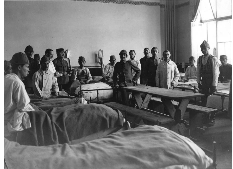
Resim 1. Bir Avusturya-Macaristan hastanesi koğuşunda Osmanlı askerleri.

15. Kolordu'ya mensup askerlerin ayrıca Neuhaus/Tauber'deki Subay Rehabilitasyon Merkezi, Trençin Krankenhaus, Einstein Nekahathanesi, Krallık ve İmparatorluk Birinci Piyade Tugayı Yaralılar Dinlenme Bölümü, Maria Valeria Barakalar Hastanesi, Augusta Barakalar Hastanesi, Szent Laszlö Hastaneleri, Vihnos Crasarut Nekahathanesi, Nyitra Hastanesi, Pongrasut (Pongráz utca) Hastanesi, Varöskereszt, Labadoza, Pilmos, Craszar, Theresienstadt Yaralılar Yurdu ve Bakımevi'nde tedavi gördükleri tespit edilmişti. Bununla birlikte Wiesbaden'deki Spiegel Oteli ve Badenheim kaplıcaları yeniden düzenlenerek nekahathaneye dönüştürülmüş ve askerlerin istirahatleri ve son tedavileri burada yapılmıştır. Öte yandan Liebestabs kaplıcalarındaki sağlık tesisleri göz hastalıklarına tahsis edilmiş, Avusturya Kızılhaç'ının önerisi üzerine Adriyatik Savaş İstasyonu'ndaki bakım evi, Osmanlı hasta ve yaralıların hizmetine verilmiştir. 18