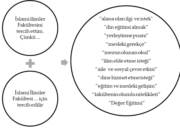
Şekil 2. Fakülte Tercih Süreci Ortak Olgular

Tablo 2 ve Tablo 3'teki veriler birlikte değerlendirildiğinde Şekil 2'de de görüldüğü üzere “alana olan ilgi ve istek”, “din eğitimi almak”, “yerleştirme puanı”, “mesleki gerekçe”, “mezun olunan okul”, “ilim elde etme isteği”, “aile ve sosyal çevre etkisi”, “dine hizmet etme isteği”, “eğitim ve mesleki gelişim”, “fakültenin olumlu nitelikleri” ve “Değer Eğitimi” ön plana çıkmaktadır.