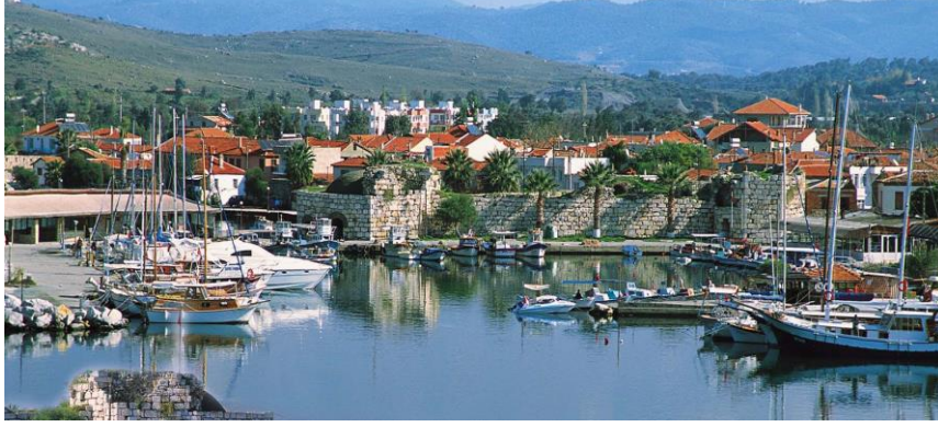
Şekil 1. Cittaslow- Sakin Şehir İzmir Seferihisar.