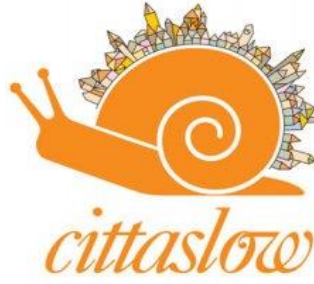
Şekil 2: Sakin Şehir Logosu (Cittaslow, 2019).