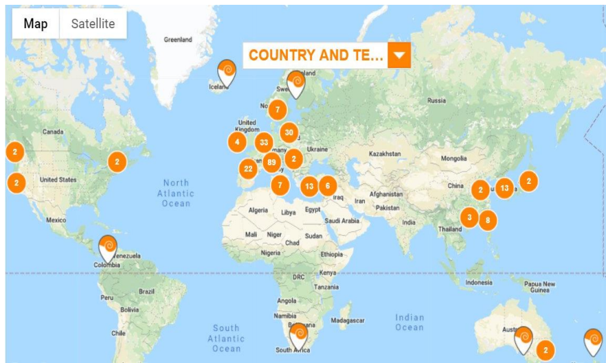
Şekil 1: Dünya Geneline Sakin Şehir Dağılımı (Cittaslow, 2019).

2009 yılında Türkiye’de ilk olarak sakin şehirler ağına katılan Seferihisar Belediyesi; Uluslararası Cittaslow Birliği’nin Türkiye Koordinatörü durumundadır ve Türkiye’den başvuruları değerlendirmekle yükümlüdür. (Cittaslow Türkiye, 2019).