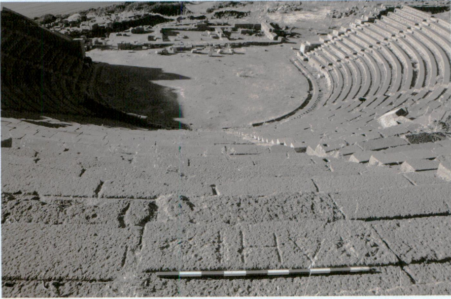
Resim 5 - Demirciler için rezerve edilmiş oturma sırası