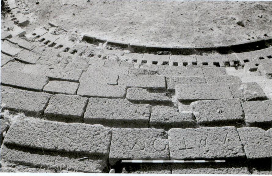
Resim 2 - Taş ocağı işçilerine için rezerve edilmiş oturma sırası