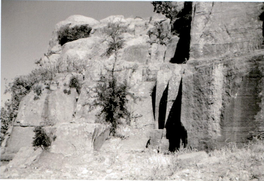
Resim 3 - Akropolisin eteğinde bir taş ocağı