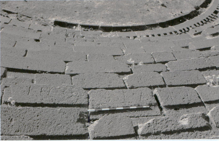
Resim 4 - Dericiler için rezerve edilmiş oturma sırası