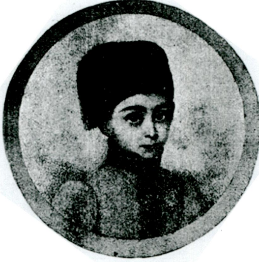
Resim 1 - Atiye Sultan'ın erkek kıyafetiyle çocukluğu (Halúk Y. Şehsuvarođlu, "Atiye Sultan", Resimli Tarih Mecmuası , c. 3/sy. 25 (Ocak 1952, s. 1200))