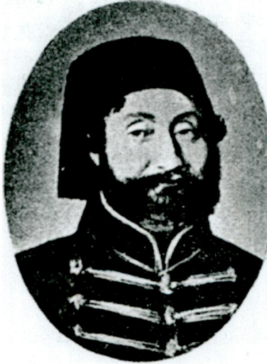
Resim 2 - Damat Ahmed Fethi Paşa (Halúk Y. Şehsuvarođlu, "Atiye Sultan", Resimli Tarih Mecmuası , c. 3/sy. 25 (Ocak 1952, s. 1201))