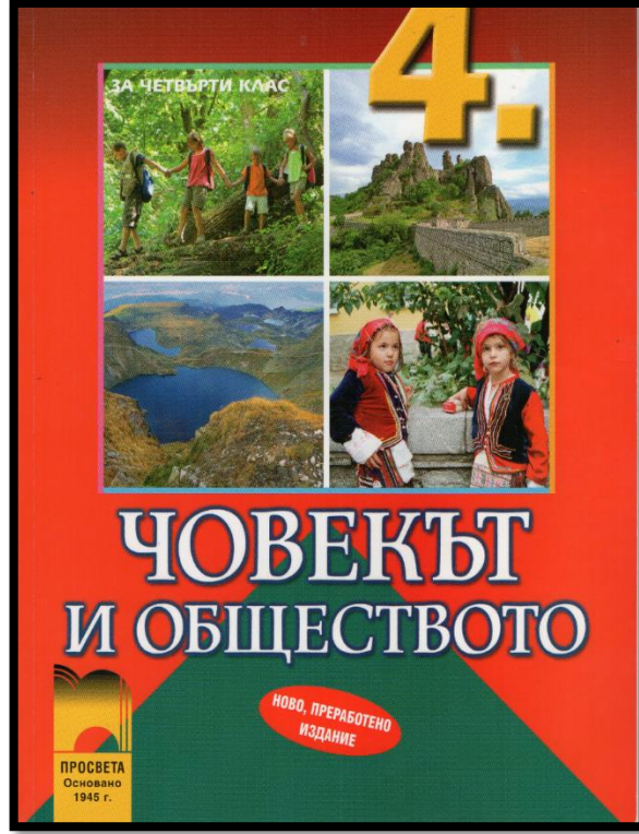
Görsel 2. 4. Sınıf Bulgar Ders Kitabının Kapak Sayfası