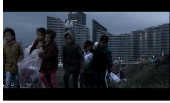
Şekil 4. Kent ve Suriyeli Çocuklar