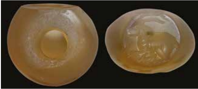
Fotoğraf 2 - Mühür; Profil ve Görünüş / Seal; Profile and Appearance