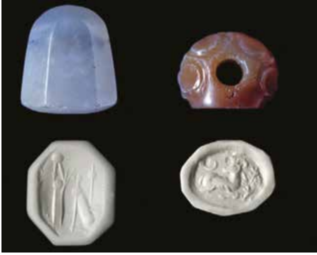
Fotoğraf 5 - Babil ve Sasani Mühürleri (Ritter 2017: 277-292, Fig. 8) / Babylonian and Sassanid Seals

ileri sürmektedir (Ritter 2012: 100). Mühürler çok yaygın olarak kullanıldığından mühürler arasında, stil ve tasarım kalitesi bağlamında farklılıklar görülmektedir. Farklılıklar özellikle detay ve işçilik kalitesinde karşımıza çıkar ve bu farklılıklar araştırmacılar tarafından, alıcıların ekonomik gücü ile ilişkilendirilmiştir (Gyselen 1993: 60).