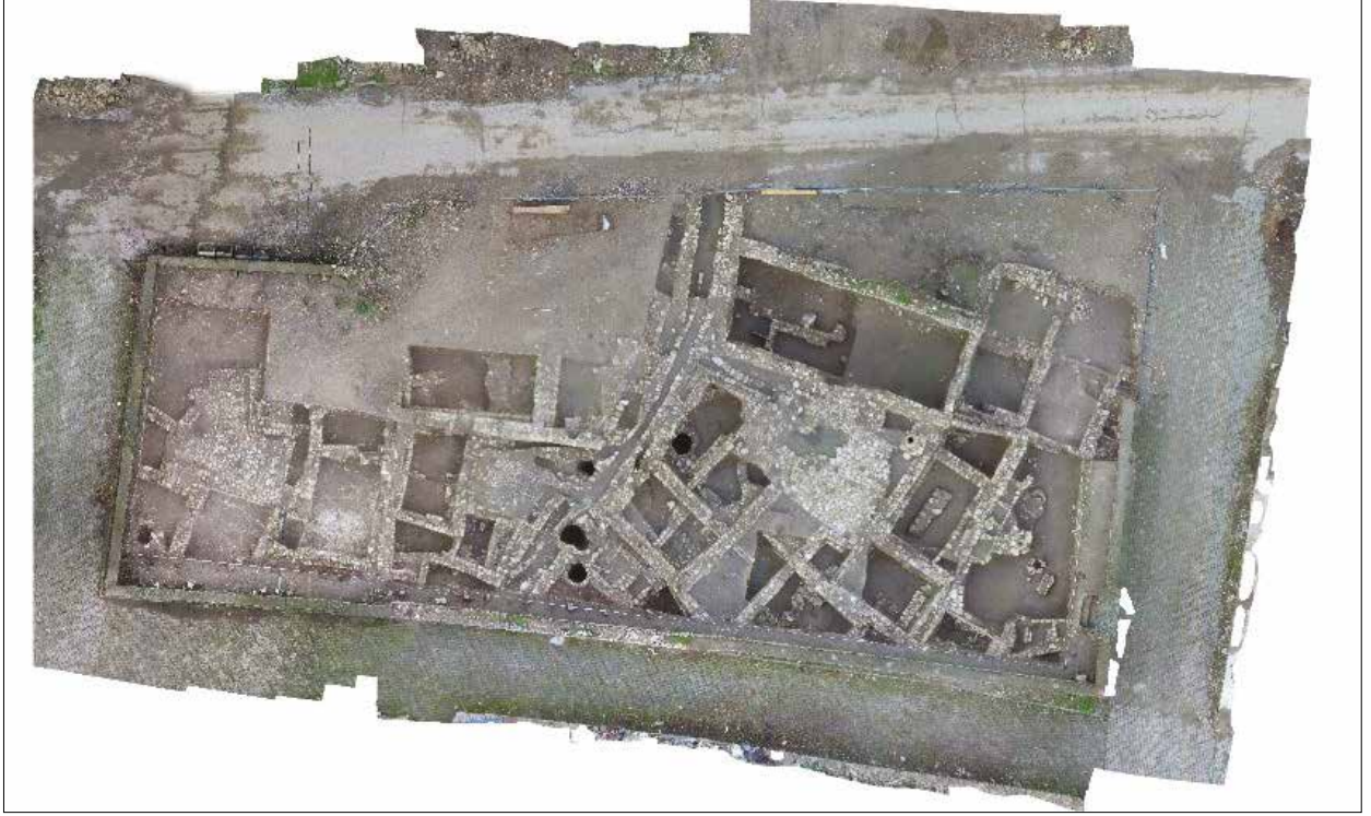
Fotoğraf 1 - İmam Abdullah Camii Kazı Alanı / Imam Abdullah Mosque Excavation Area