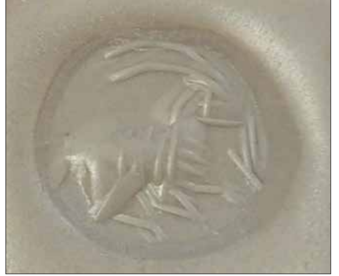
Fotoğraf 3 - Mühür Üzerindeki Dağ Keçisi Figürü / Mountain Goat Figure on Seal

Bu bağlamda eserimizin bir Sasani mührü olduğunu net bir şekilde söylemek mümkündür. Bu nedenle öncelikle Sasani kültüründe mühür ve tasvirleri irdelenerek, eserin ikonografisini belirlemek mümkün olacaktır.