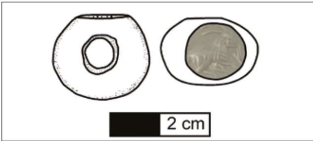
Şekil 1 - Mühür; Profil ve Görünüş Çizimi / Seal; Profile and Appearance Drawing

Bu bağlamda eserimizin bir Sasani mührü olduğunu net bir şekilde söylemek mümkündür. Bu nedenle öncelikle Sasani kültüründe mühür ve tasvirleri irdelenerek, eserin ikonografisini belirlemek mümkün olacaktır.