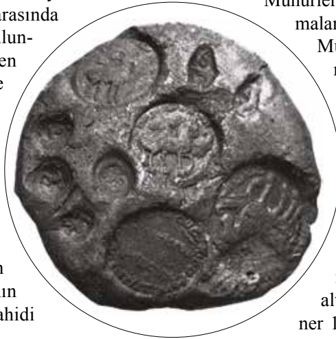
Fotoğraf 6 - Mühürlenmiş Bir Kil Örneği (Ritter 2012: 99-114, Fig. 3) / A Sealed Clay Sample

Sasani kültüründe mühürleme işlemi, genellikle küçük yuvarlak formlu bir kilin üzerine yapılırdı. Mühürlenmiş kil örnekleri İran'daki Ak-Depe kazılarında çok sayıda ele geçmiştir 5 (Ritter 2012: Fig. 3) (Foto. 6). Küçük top şeklindeki killerin üzerinde bir veya iki mühür gösterimi olduğu gibi, 5 ila 20 arasında farklı mühür barındıran örneklerde bulunmaktadır. Bu çok sayıdaki mühürlere özellikle büyük olanların tam merkeze yapıldığı, küçük ölçüdeki mühürlere ise daha çok kenarlara yapıldığı görülmektedir. R. Frye merkezdeki büyük figürün daha çok devlet memuru gibi kişilere ait olduğunu, küçük mühür görünümlerinin ise çok fazla çeşitlilik gösterdiğini belirterek bu çeşitliliği yani farklı mühürlere sayısının çokluğunu, mevcut anlaşmanın veya sözleşmenin garantörü ya da şahidi olan kişiler tarafından mühürlenmiş olabilecekleri şeklinde açıklar (Frye 1968: 118).