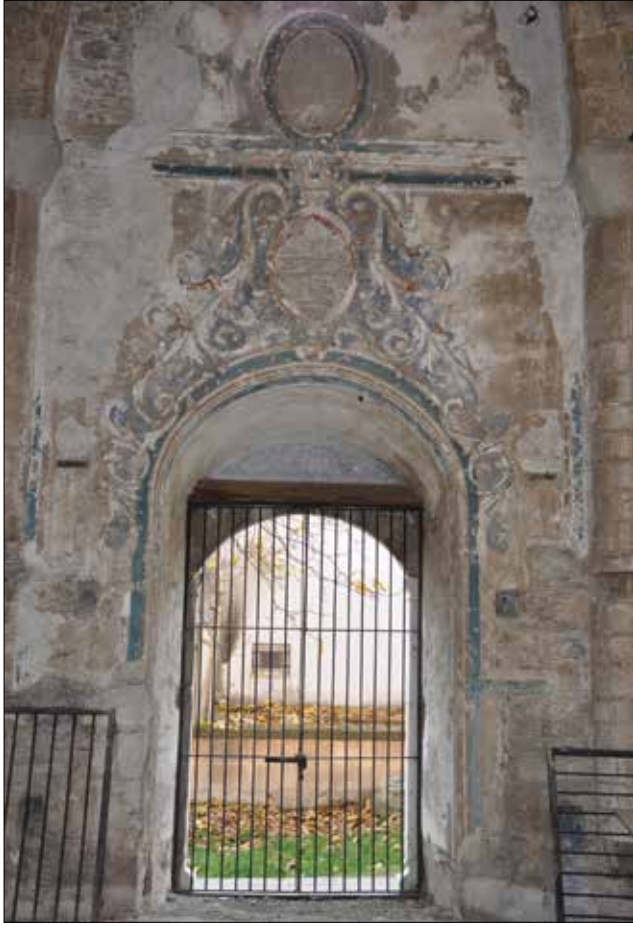
Fotoğraf 8: Isparta, Aya İshotya (Yorgi) Kilisesi, naos güney duvarı kapı açıklığı. / Isparta, Aya İshotya (Yorgi) Church, the door opens of southern wall of naos.

Efendi tarafından Bulgaristan'ın Kızanlık yöresinden getirilip bugünkü Gülcü mahallesine dikilmiştir. Isparta'da yağ gülü üretimi 1888-1889 yıllarında başlamış, ilk gül yağı imalatı da 1892 yılında yine Müftüzade İsmail Efendi tarafından yapılmıştır. Böylece Isparta bir gül şehri olmuştur 9 .