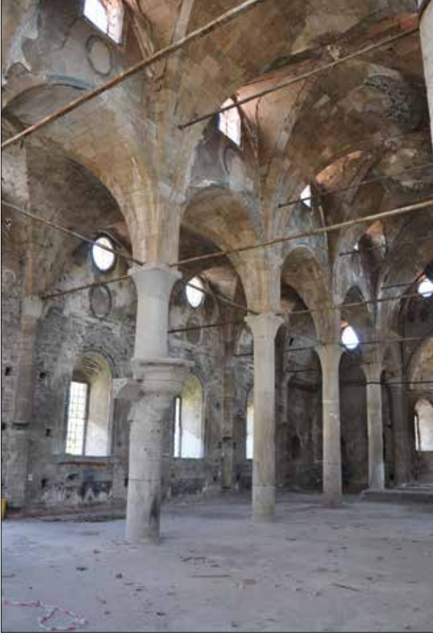
Fotoğraf 6: Isparta, Aya İshotya (Yorgi) Kilisesi, naos kuzey duvarı. / Isparta, Aya İshotya (Yorgi) Church, the north wall of naos.