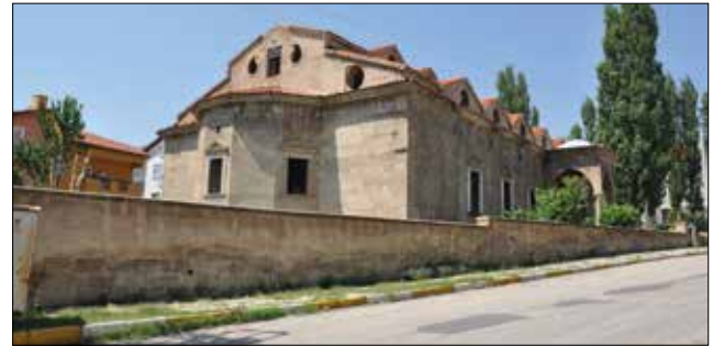
Fotoğraf 1: Isparta, Aya İshotya (Yorgi) Kilisesi genel görünümü, doğu. / Isparta, Aya İshotya (Yorgi) Church general view, east.

Bu gelişmeler sonrasında 1922-1923 yıllarında Isparta, Burdur ve Eğirdir'den Rumlar ayrılmış, gittikleri Atina yakınında Yeni İyonya adını koydukları bir yerleşim oluşturarak Küçük Asya Ispartalılar Birliği'ni kurmuşlardır (Toklutepe 1998: 218). Ancak Rumlar düzenli olarak Isparta, Burdur ve Eğirdir'i ziyaret etmeye devam etmişlerdir.