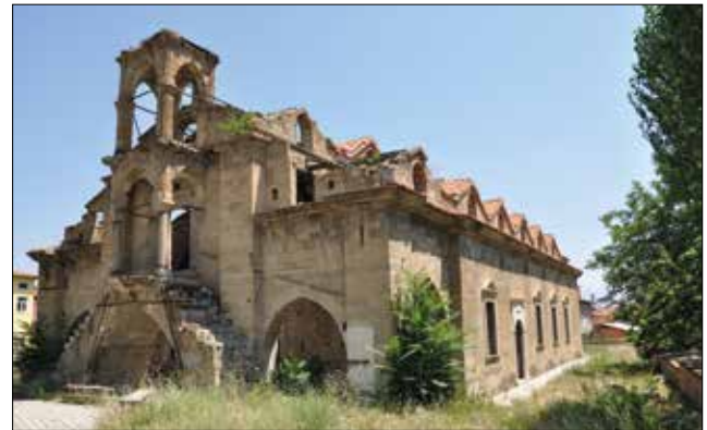
Fotoğraf 2: Isparta, Aya İshotya (Yorgi) Kilisesi genel görünümü, batı. / Isparta, Aya İshotya (Yorgi) Church general view, west.