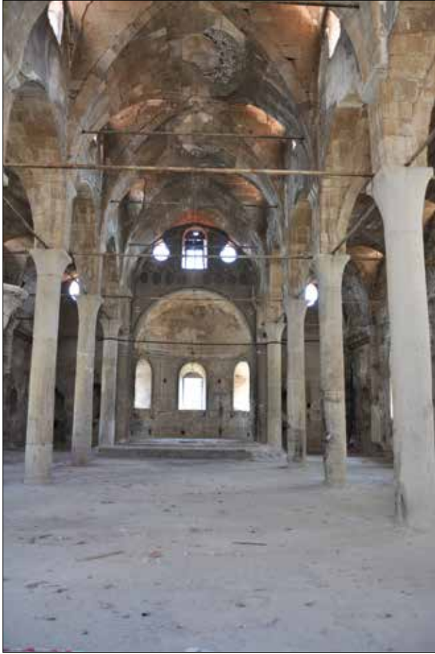
Fotoğraf 4: Isparta, Aya İshotya (Yorgi) Kilisesi, naos. / Isparta, Aya Ishotya (Yorgi) Church, naos.

cephesindeki kapı açıklıkları kurguları açısından Roma Dönemi zafer taklarına benzemektedirler.