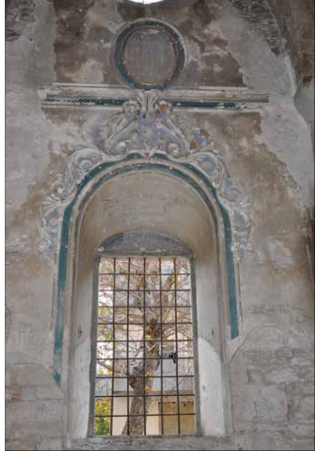
Fotoğraf 7: Isparta, Aya İshotya (Yorgi) Kilisesi, naos güney duvarı penceresi. / Isparta, Aya İshotya (Yorgi) Church, the window of southern wall of naos.

Orta nef tonozu ile nefleri ayıran sütunların kemerleri arasında yer alan üst sıra kemer alınlıklarında sivri yayvan kemerli pencerelerin hemen altında alçı profil ve şeritten yapılmış yuvarlak formda birer madalyon bulunmaktadır. Alçı kaplama orta nef tonozunun apsisin hemen önünde yer alan doğu yöndeki çapraz tonozunda bir bölümü günümüze ulaşmış iki madalyon vardır. Bunlar alçı profil ve şeritlerden yapılmış kıvrık dal ve yapraklarla çerçevelenmiş, ana ekseninde palmet ve iki yanında taç benzeri yapraklara yer verilmiştir.