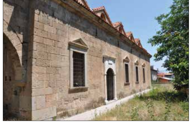
Fotoğraf 3: Isparta, Aya İshotya (Yorgi) Kilisesi, güney cephe. / Isparta, Aya Ishotya (Yorgi) Church, south facade.

Isparta, Doğanca mahallesindeki Aya İshotya (Yorgi) Kilisesi mübadele sonrası askeri depo olarak kullanılmış, daha sonra âtil hale gelmiştir. 1975 yılında tescil edilen kilise, bir çevre duvarı içinde yer alır (Kılıç 2009: 181; Foto. 1-2). Kilisenin 1857-1860 yılları arasında yapıldığını gösteren yazıtı bugün Isparta Müzesi'ndedir. Farklı iki boyut ve kalınlıkta kesme taşlarla yapılmış, duvarların kesiştiği köşeler ise büyük düzgün kesme taştandır. İç mekânda ve nartheks doğu duvarında ise farklı boyut ve kalınlıktaki taşların arasına kiremit kırıkları yerleştirilmiştir. Nartheks doğu duvarı sıvalıdır.