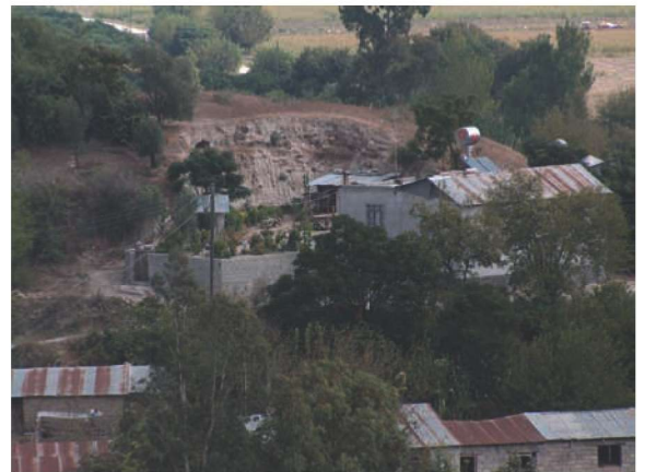
Res. 12. Alapınar Höyüğü (env. no: N35.A13.5) ve adını höyüğe veren köy.