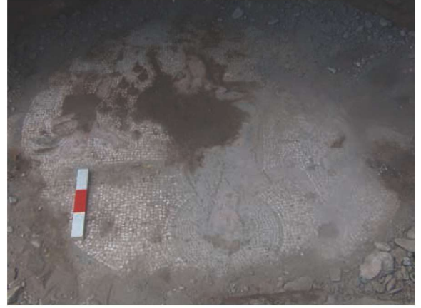
Res. 10. İdemköy yakınında, zemininde mozaik bulunan tuğla duvarlı Roma devri yapısına (env.no: N35.A13.2) ait kalıntılar.