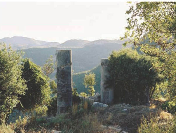
Res. 5. Uzunoğlan Tepesindeki tapınağın (env. no: M35.A13.2) ön cephesindeki sütunlar.