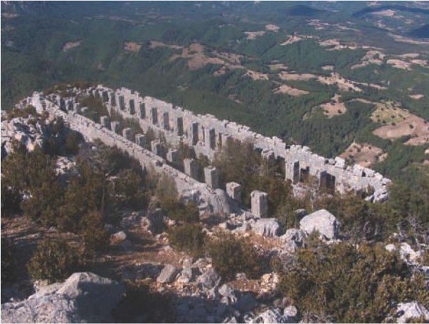
Res. 3. Karasis Kalesinin yukarı kale bölümündeki silo yapısı.