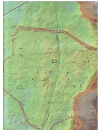
Res. 6. Anazarbos antik kenti aşağı şehrinde tespit edilebilen yapıların konumlarını gösteren plan.