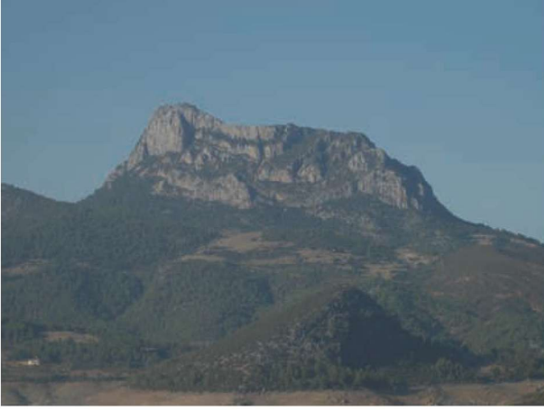
Res. 1. Karasis Dağı, güneyden.