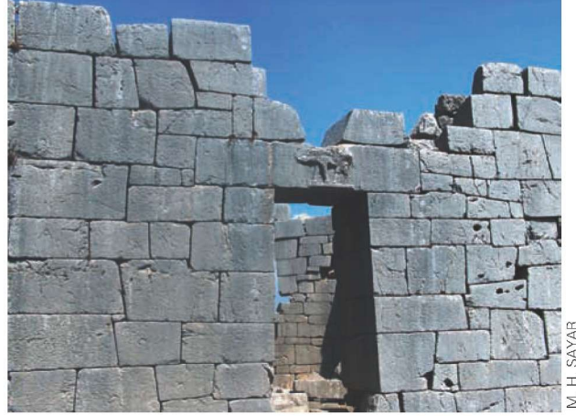
Res. 2. Karasis Kalesinin aşağı kale bölümündeki burçlarından birinin batı girişi ve üzerindeki fil kabartması.