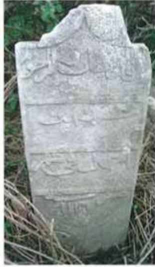
Res. 4. H 1116 tarihli Hüseyin ibni Ahmet'e ait mezar taşı.