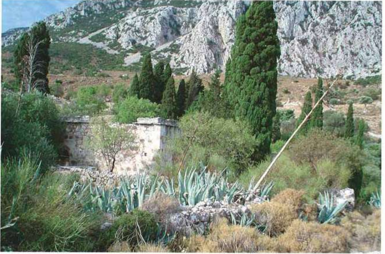
Res. 1. Çullu Camisi ve Doğu Mezarlığı, kuzeyden görünüş.