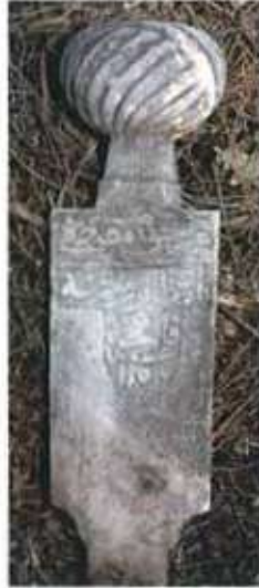
Res. 8. H 1153 tarihli Mustafa Paşa'ya ait mezar taşı.