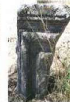
Res. 36-37. Doğu Mezarlığında bir mezarda baş ve ayak taşı olarak kullanılan devşirme yapı elemanları.