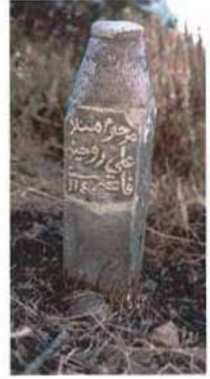
Res. 6. 1140 tarihli Molla Ali'ye ait mezar taşı.