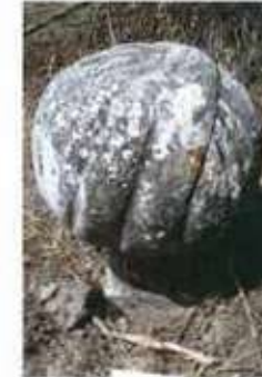
Res. 35. Doğu Mezarlığında bulunan sarklı mezar taşı.