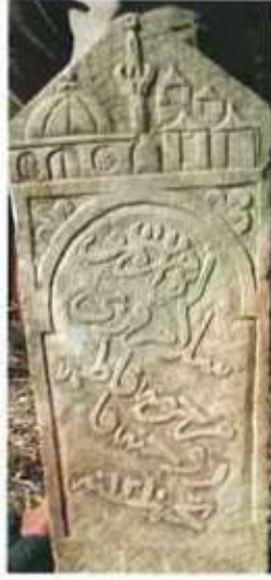
Res. 16. H 1210 tarihli Selâmi kızı Fatma'ya ait mezar taşı.