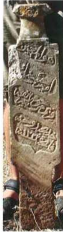
Res. 18. H 1222 tarihli Emîr Hüseyin'in kızı Şerîfe Hadîce'ye ait mezar taşı.