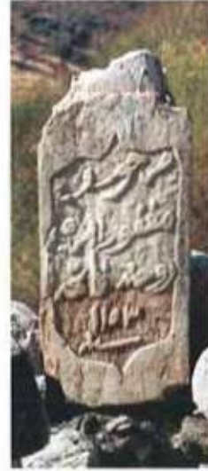
Res. 10. H 1153 tarihli İbrahim'e ait mezar taşı.