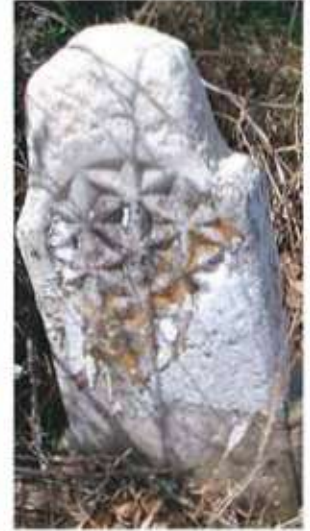
Res. 33. Hazirede yer alan rozetli mezar taşı.