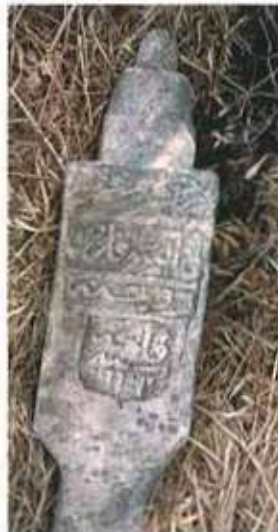
Res. 14. H 1188 tarihli Molla Halil oğlu Hacı Ahmed'e ait mezar taşı.