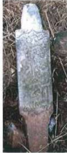
Res. 9. H 1153 tarihli Ulu (?) Ahmed'e ait mezar taşı.