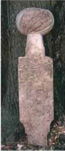
Res. 7. H 1153 tarihli Hüseyin Paşa'ya ait mezar taşı.