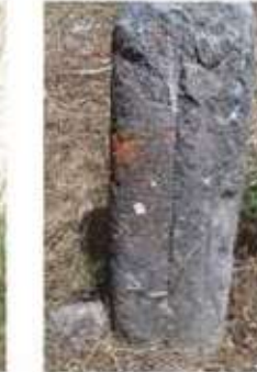
Res. 38. Batı Mezarlığında bulunan ağaç betimli ayak taşı.