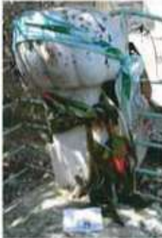
Res. 34. Hazirenin doğusunda bulunan yatıra ait mezar taşı.