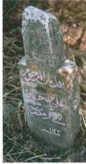
Res. 5. H 1123 tarihli Ali bin Hüseyin'e ait mezar taşı.