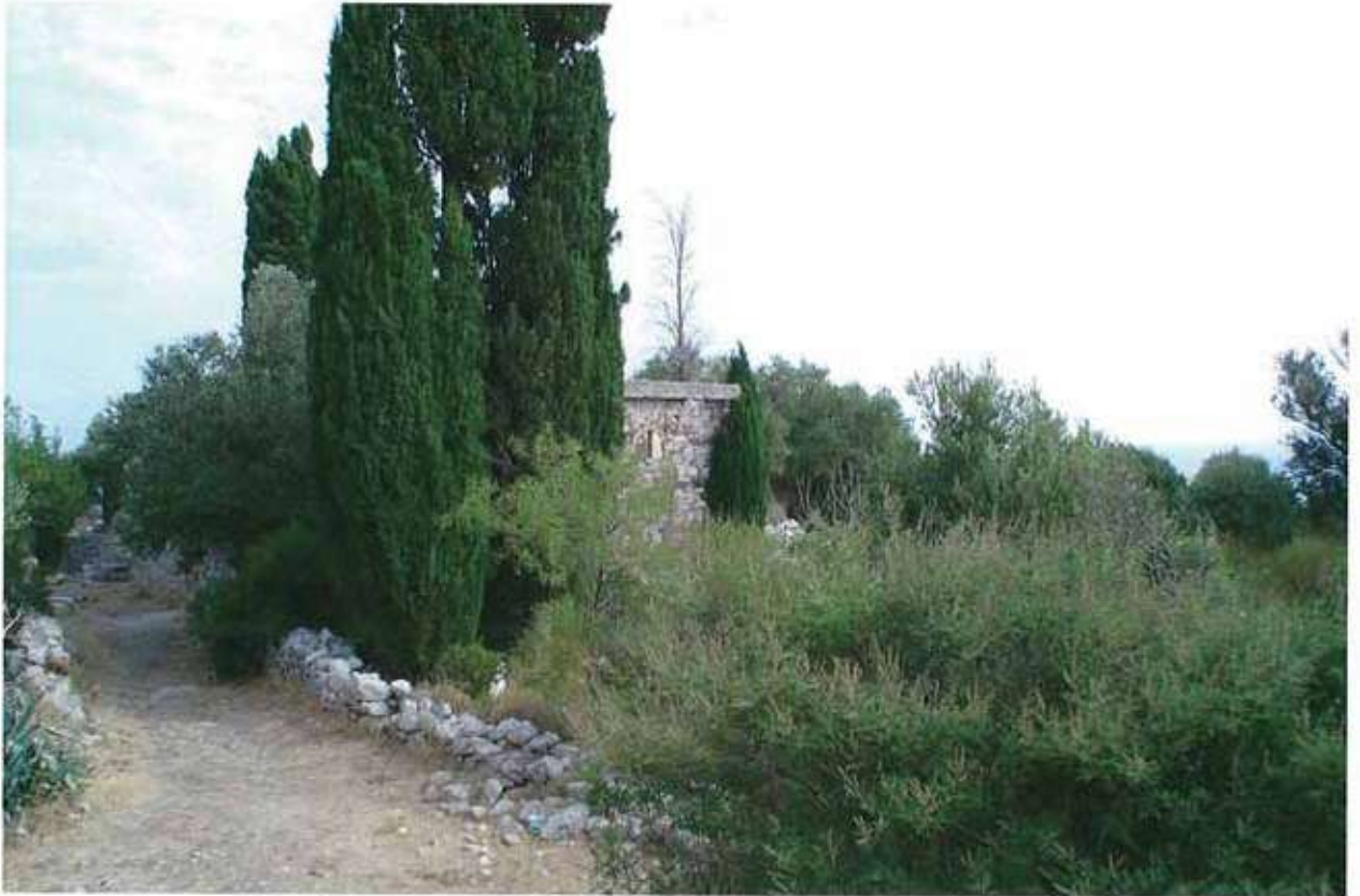
Res. 2. Çullu köyü cami yolu ve Doğu Mezarlığı.