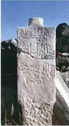
Res. 30. H 1313 tarihli Ağa mahdümü Ayvalı Mehmed'e ait mezar taşı.