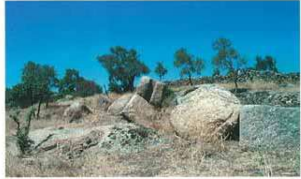
Res. 89. Çine, Bereket Mezarlık Düzü ören yeri ve nekropol alanının içinde yer alan bir yağ işliği (env. no: M20A03404).