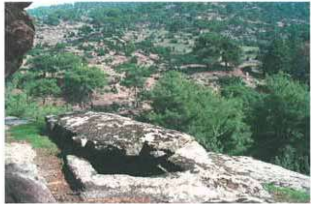
Res. 33. Çine, Tatarmemişler Okul Mahallesiindeki nekropolden (env. no: M20A016) bir görünüm.