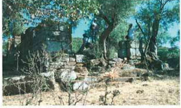
Res. 85. Çine, Dereli Demirsi'de küçük bir tapınak ya da heroon olabilecek yapı (env. no: M19A001).