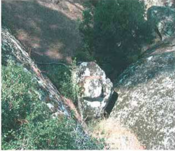
Res. 58. Çine, Hacıpaşalar Dinecik Nekropolünde Kaya tipi mezarlardan birinin (env. no: M20A03001) beşik çatı şeklindeki kapığı.