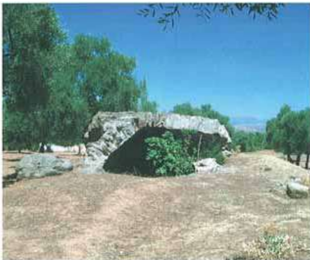
Res. 60. Çine, Alabanda ören yerindeki anıt mezar (env. no: M19A0100102).