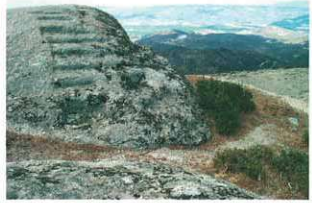
Res. 78. Çine, Soğukoluk Kocaasar kalesinde zirveye uzanan basamaklar (env. no: N19A00407).