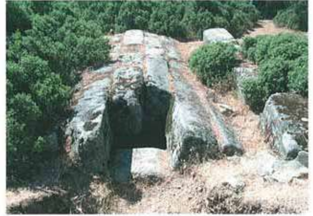
Res. 26. Çine, Madran'da tonozlu bir oda mezar (env. no: M20A0020102).