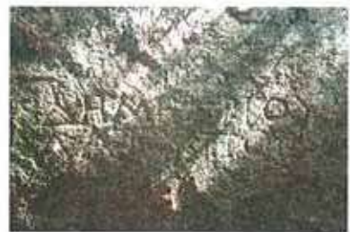
Res. 6. Çine, Seferler Havutlu Tepede, bir kayanın üzerinde bulunan yazıt (env. no: N19A00108).