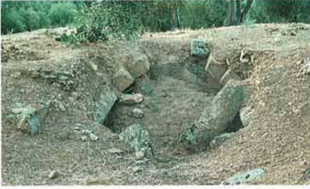
Res. 84. Çine, Hasanlar'da mezar ya da sarnıç olabilecek tanımlanamayan bir yapı (env. no: M19A004).