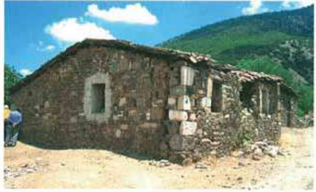
Res. 16. Nazilli, Böğrüdelik'te (env. no: M20A006), devşirme taşlarla inşa edilmiş, kullanılmayan bir cami.