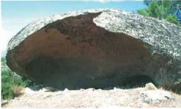
Res. 86. Çine, Hacipaşalar Dinecik'teki bir kaya kovuğunda, cephesi yok olmuş bir kaya kilisesi (env. no: M20A028).