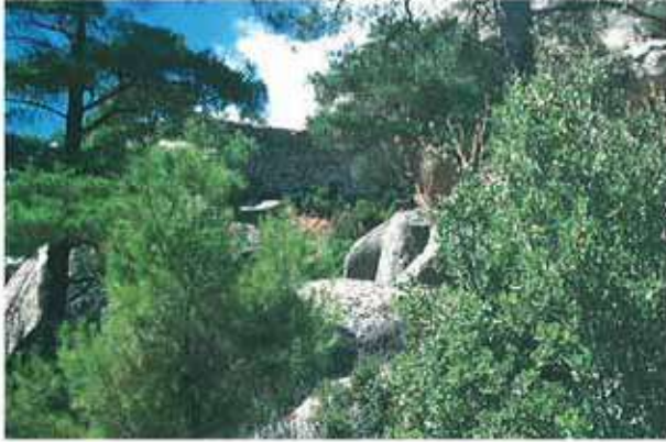
Res. 54. Çine, Sogukoluk Kocasar'daki kaleden (env. no: N19A004) bir görünüm.