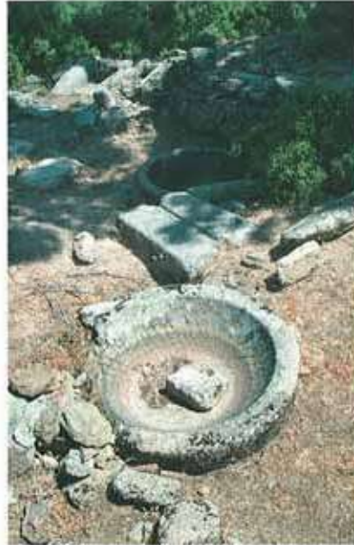
Res. 28. Çine, Madran ören yerinde bir ışık (env. no: M20A00203).