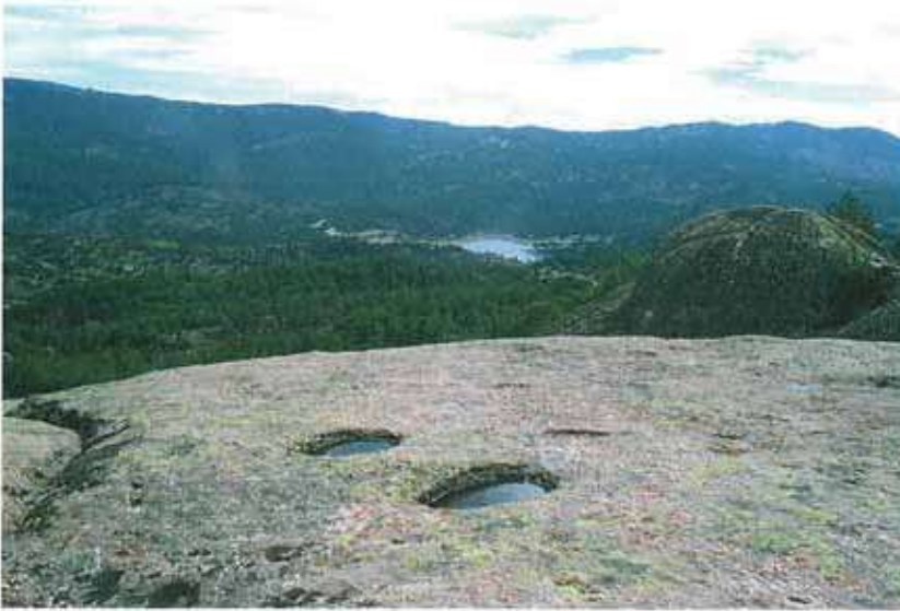
Res. 3. Çine, Seferler Havutlu Tepede (env. no: N19A001) kayaların üzerlerindeki yapıların izleri olduğu düşünülen yuvarlak oyuklar.