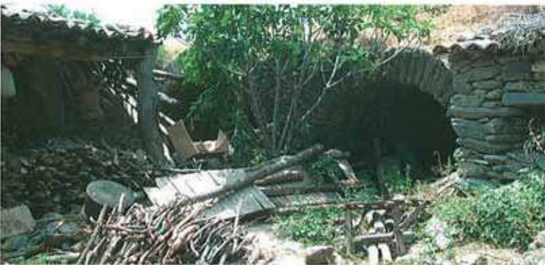
Res. 21. Nazilli, Böğrüdelik'te bulunan tonozlu bir yapı (env. no: M20A00604).