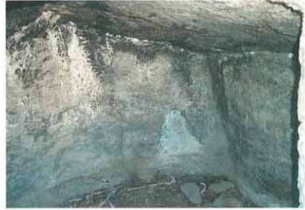
Res. 64.-65. Çine, Eski Çine Kale Tepe Höyükteki oda mezarın (env. no: M20A0370201) girişi ve içi.