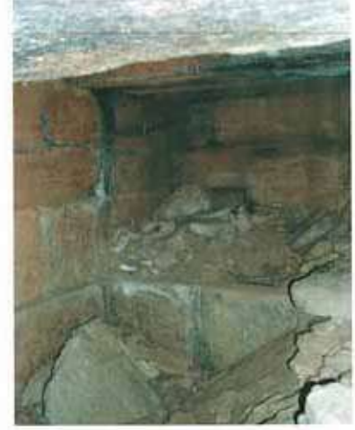
Res. 12. Çine, Murtat Tepedeki tümülüsün (env. no: M20A0040101) mezar odasından bir görünüş.