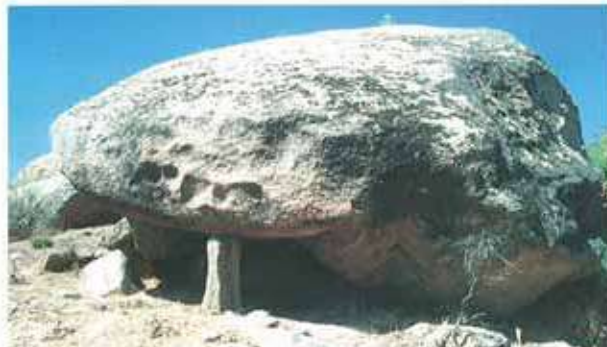
Res. 70. Çine, Hacipaşalar Asartepe'deki yerleşimde bir kaya sığınığı (env. no: N20A00201).