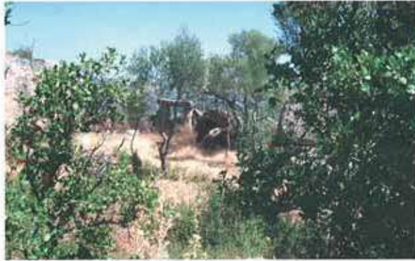
Res. 68. Çine, Hacipaşalar Asartepe savunma sistemine sahip bir kale yerleşimidir (env. no: N20A002).