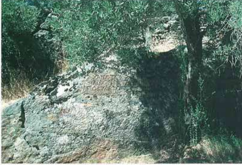
Res. 51. Çine, Sogukoluk Karıncalıkaya Mevkiinde yazıtlı, Karya tipi bir mezar (env. no: M19A006).