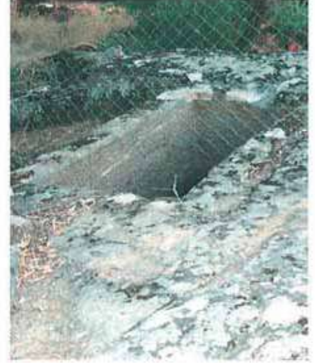
Res. 52. Çine, Sogukoluk Karıncalıkaya'daki Karya tipi mezarın (env. no: M19A006) günümüzdeki durumu.