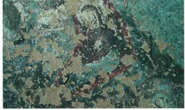
Res. 87. Dinecik'teki kaya kilisesinin (env. no: M20A028) tavan ve duvarlarında, Meryem Ana'nın hayatını anlatan freskler bulunuyor.