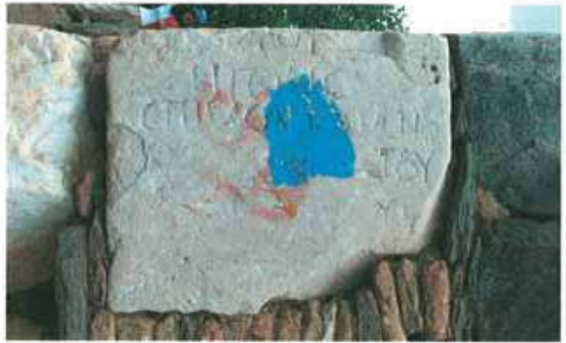
Res. 17-18. Nazilli, Böğrüdelik'te devşirme malzeme olarak kullanılmış yazıtlar (env. no: M20A00601, M20A00602).