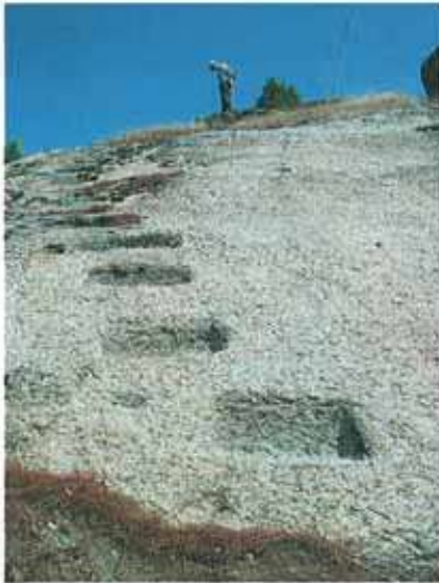
Res. 82. Çine, Hacıpaşalar Dinecik'te kaya zirvesine uzanan oyuklar (env. no: M20A02902).