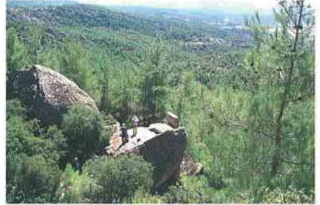
Res. 55. Çine, Sogukoluk Kocasar nekropolünde (env. no: N19A00406) Karya tipi bir mezarlar.