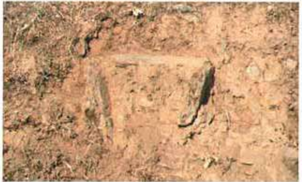
Res. 20. Nazilli, Çarıköy'de modern yolun kestiği nekropolde (env. no: M20A00701) bir sandık mezar.