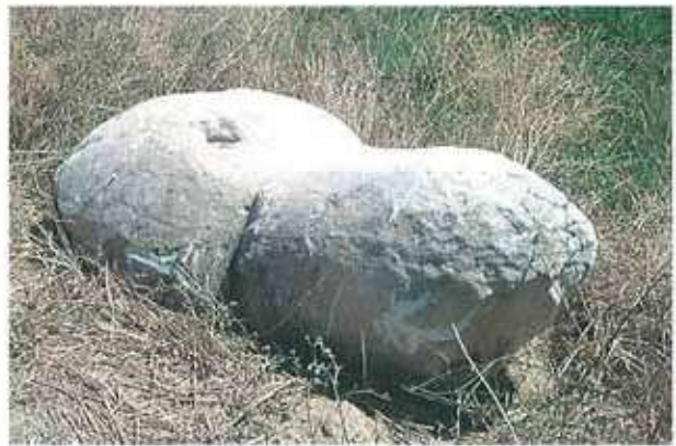
Res. 63. Tepecik Tümülüsünün (env. no: M20A001) girişi yakınında bulunan mermer bir phallos.