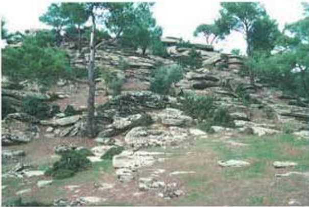
Res. 32. Çine, Tatarmemişler Okul Mahallesiindeki nekropol (env. no: M20A016).