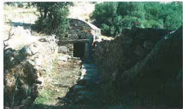
Res. 91. Çine, Alabayır'da günümüzde de kullanılan antik çeşme yapısı (env. no: M20A020).