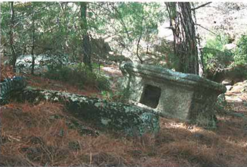
Res. 5. Çine, Seferler Havutlu Tepede bir sunak (env. no: N19A00109).