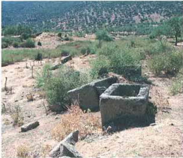
Res. 59. Çine, Alabanda ören yerindeki nekropolde bulunan lahit mezar (env. no: M19A0100101).