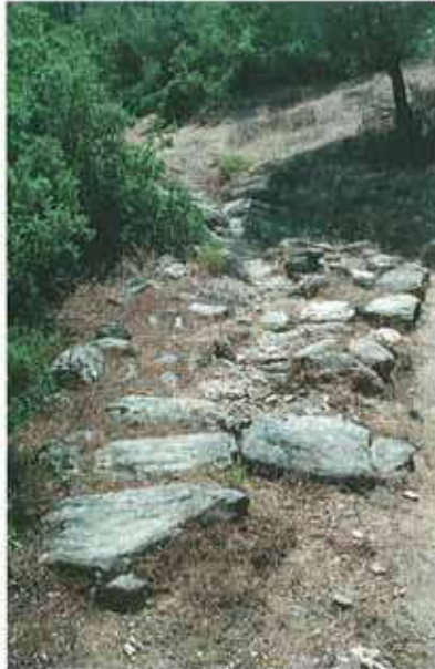
Res. 27. Çine, Madran ören yerinde taş döşemeli yol kalıntısı (env. no: M20A00202).