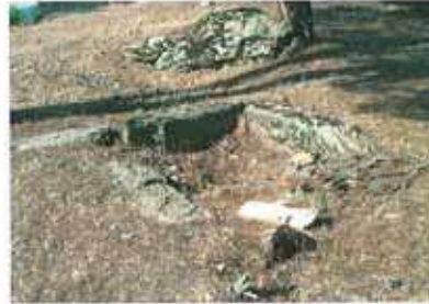
Res. 14. Çine, Murtat Tepede (env. no: M20A004) kapağı kaybolmuş bir sandık mezar.