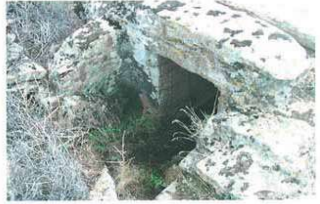
Res. 37-38. Çine, Belenköy Kabalar Gavurdamları Mevkiindeki nekropol alanında bulunan bir oda mezarın (env. no: N20A00103) içeriden ve dışından görünümü.