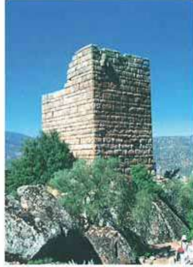
Res. 44. Çine, Yeşilköy Ahırköy'de kule mezar (?) env. no: M19A00701) ve Kaya tipi mezarların bulunduğu nekropol (env. no: M19A0007).