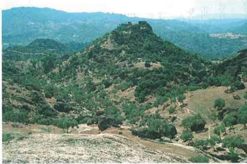
Res. 73. Kayalık bir tepe üzerinde yer alan Çine, Hacipaşalar Keçiasarı kalesinden (env. no: N20A003) bir görünüm.