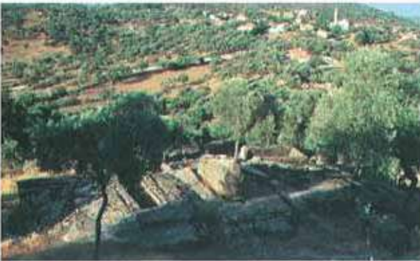
Res. 50. Çine, Sağlık Ancin'deki nekropol (env. no: M19A00201), alanında Kaya tipi mezarlar.