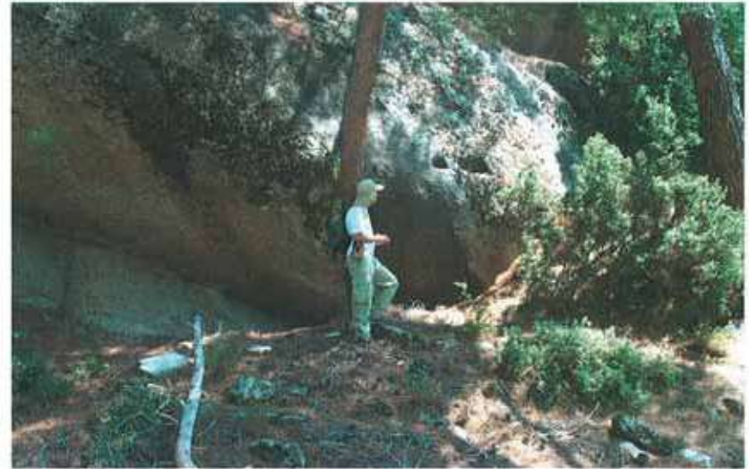
Res. 83. Çine, Hacıpaşalar Dinecik'te (env. no: M20A029) kayaya oyulmuş sekiler.