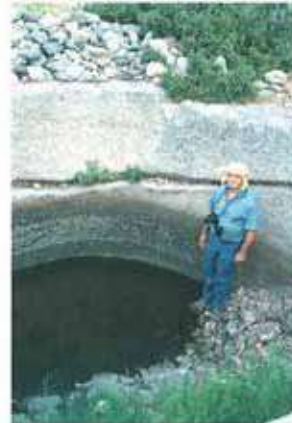
Res. 57. Çine, Sogukoluk Kocasar kale yerleşiminde, tepede kayalara oyulmuş sarnıç (env. no: N19A00404).