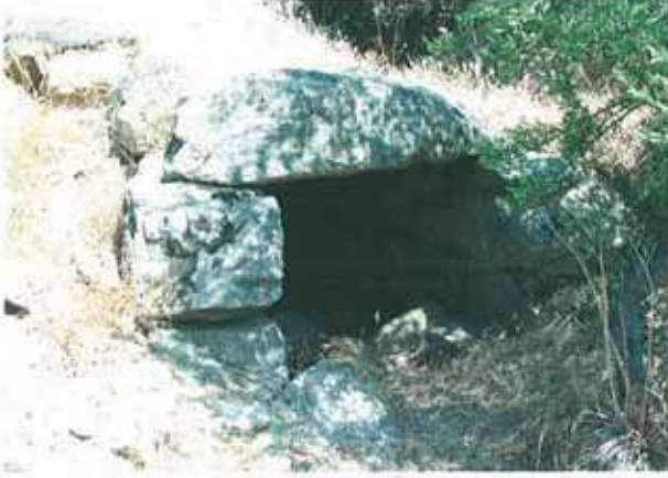
Res. 23. Nazilli, Demirciler nekropolünde tahrip edilmiş bir tümülüsün (env. no: M20A0080102) dromos'u.