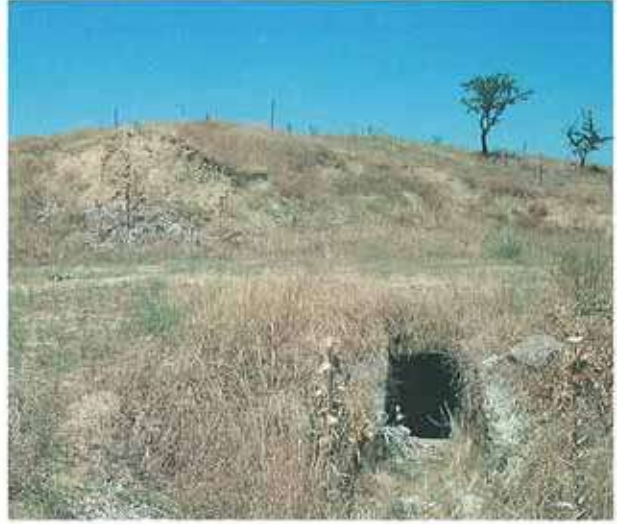
Res. 61. Çine, Alabanda ören yeri (env. no: M20A001) yakınında, Kabataş Mevkiinde bulunan Tepecik Tümülüsünün girişi (env. no: M20A001).