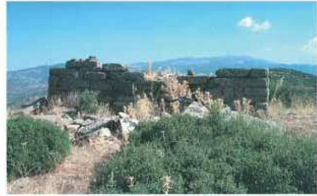
Res. 67. Çine, Ovacık Asarı'nda çevreye hâkim bu kule (env. no: M20A027) olasılıkla bir gözcü kulesidir.