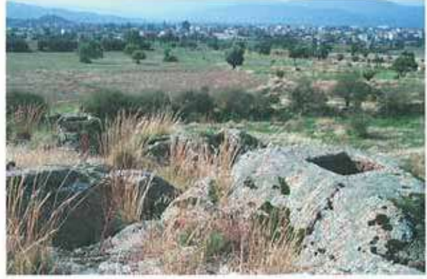
Res. 31. Çine, Asartepe'deki nekropolden (env. no: M20A01102) bir görünüm.