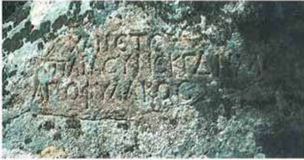
Res. 53. Çine, Sogukoluk Karıncalıkaya'daki Karya tipi mezarın üzerinde yer aldığı kaya yüzeyindeki eski Yunanca (Hellenic) yazıt.