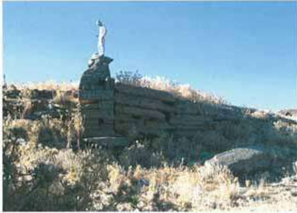
Res. 25. Çine, Eski Çine'de kalenin (env. no: M20A03701) duvarı.