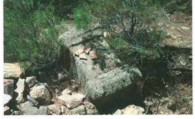
Res. 8. Çine, Kavşit Arılıtaş'ta (env. no: M20A003) bulunan bir postament.