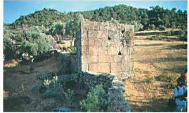
Res. 49. Çine, Sağlık Ancin'deki nekropol alanında bir kule (env. no: M19A0020101).