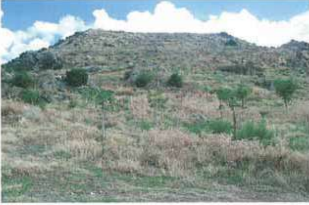
Res. 30. Çine, Asartepe'deki höyük (env. no: M20A011) ve kalenin (env. no: M20A01101) görünümü.