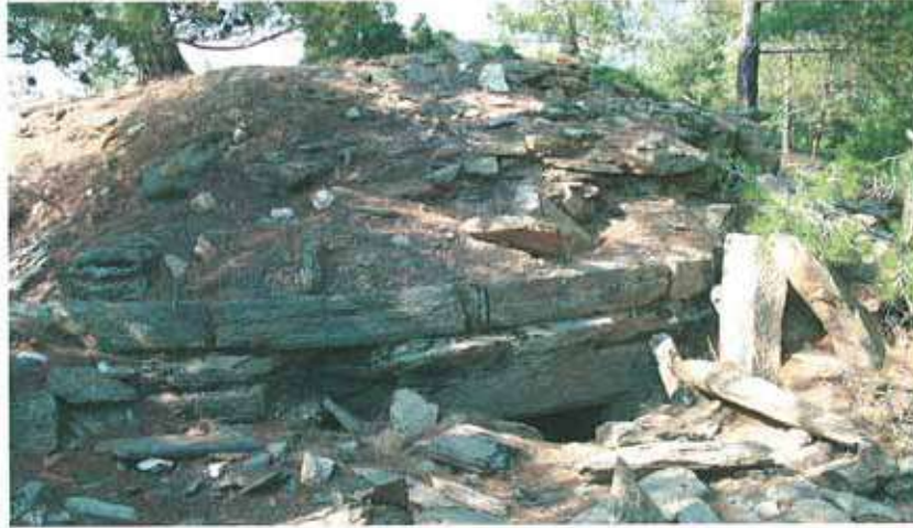
Res. 11. Çine, Murtat Tepede (env. no: M20A004) kaçak kazılarla kısmen tahrip edilmiş bir tümülüs.