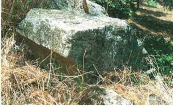
Res. 15. Nazilli, Böğrüdelik'te (env. no: M20A006), tiyatro ya da odeion'a ait bir oturma kademesi.