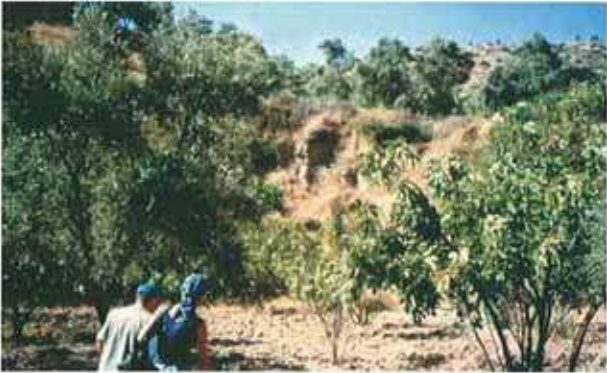
Res. 19. Nazilli'de yoğun bitki örtüsüyle kaplı Mastaura ören yeri (env. no: M20A018).