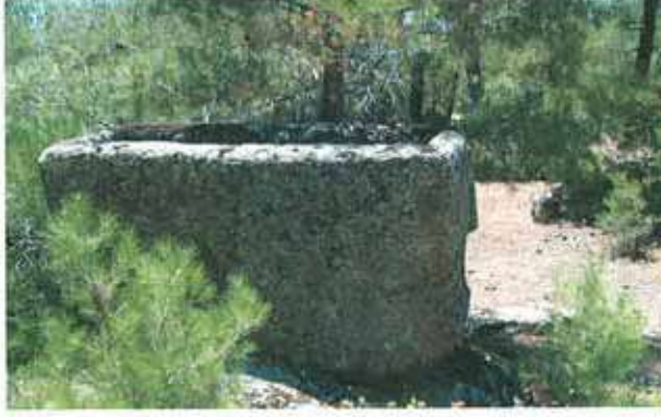
Res. 9. Çine, Kavşit Arılıtaş'ta (env. no: M20A003) konglomeradan yapılmış bir lahit.