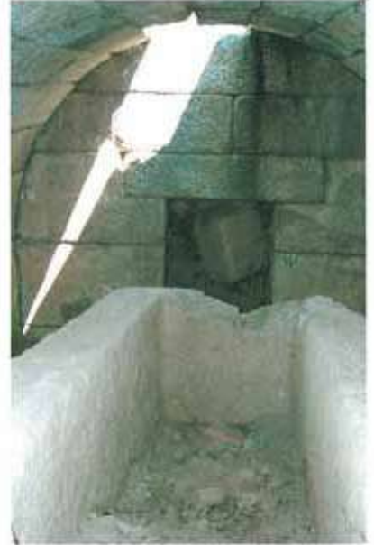
Res. 29. Çine, Madran'daki tonozlu oda mezarın (env. no: M20A0020102) içinden bir görünüm.