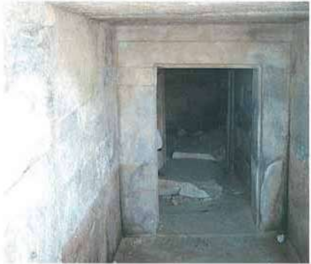
Res. 62. Tepecik Tümülüsünün (env. no: M20A001) dromos'undan mezar odasına bakış.