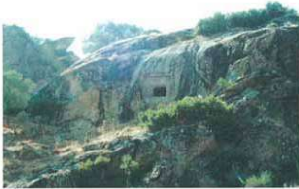
Res. 66. Çine, Kargı'da İncekemer Köprüsü yakınında, kayalara oyulmuş bir mezar (env. no: M19A012).