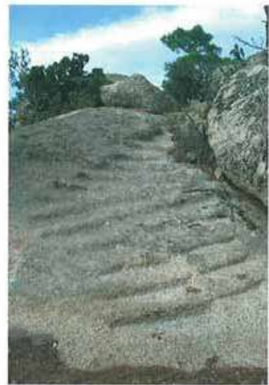
Res. 4. Çine, Seferler Havutlu Tepede yerleşiminin çeşitli semtlerini birleştiren merdivenler (env. no: N19A00107).