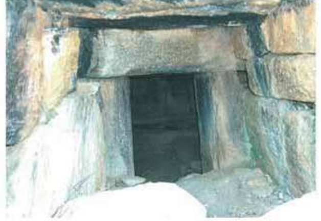
Res. 24. Demirciler nekropolündeki tahrip edilmiş tümülüsün (env. no: M20A0080102) mezar odası.