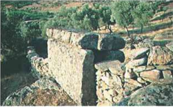
Res. 48. Çine, Sağlık Ancin'deki nekropol alanında bir lahit mezar (env. no: M19A0020102).