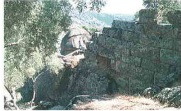
Res. 69. Çine, Hacipaşalar Asartepe (env. no: N20A002) yerleşimindeki sur duvarı.