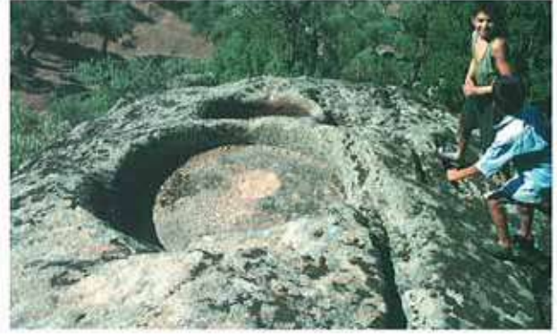
Res. 46-47. Çine, Yeşilköy Ahırköy'deki nekropolde rastlanan işliklerden örnekler (env. no: M19A00703, M19A00704).