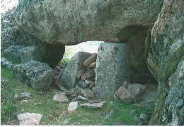
Res. 1. Çine, Seferler Havutlu Tepede bir kaya sığınığı (env. no: N19A00106).