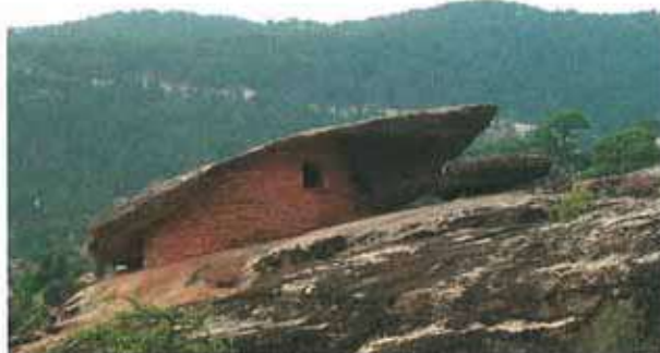
Res. 90. Çine, Topçam nekropolü (env. no: M20A032) yakınındaki ambar.