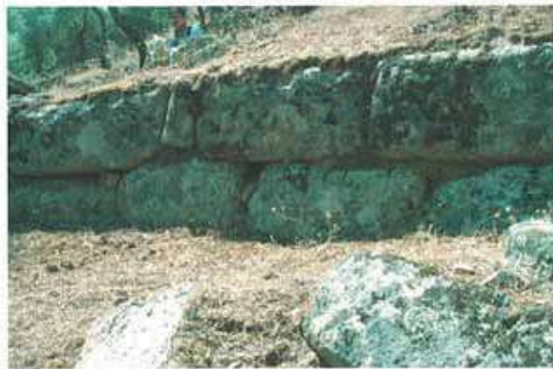
Res. 75. Çine, Hacipaşalar Keçiasarı'ndaki kalenin (env. no: N20A003) kesme taştan örülmüş, kademeli teras duvarlarına ait kalıntılar.