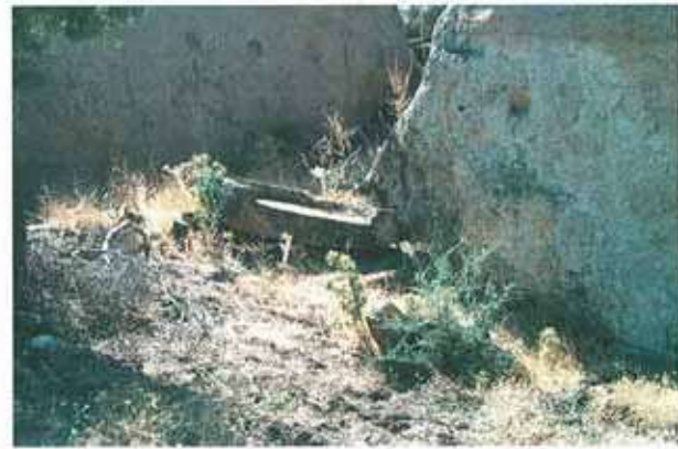
Res. 76. Çine, Hacipaşalar Keçiasarı'ndaki kalede bulunan, iki katlı büyük bir yağ işliği (env. no: N20A00301).