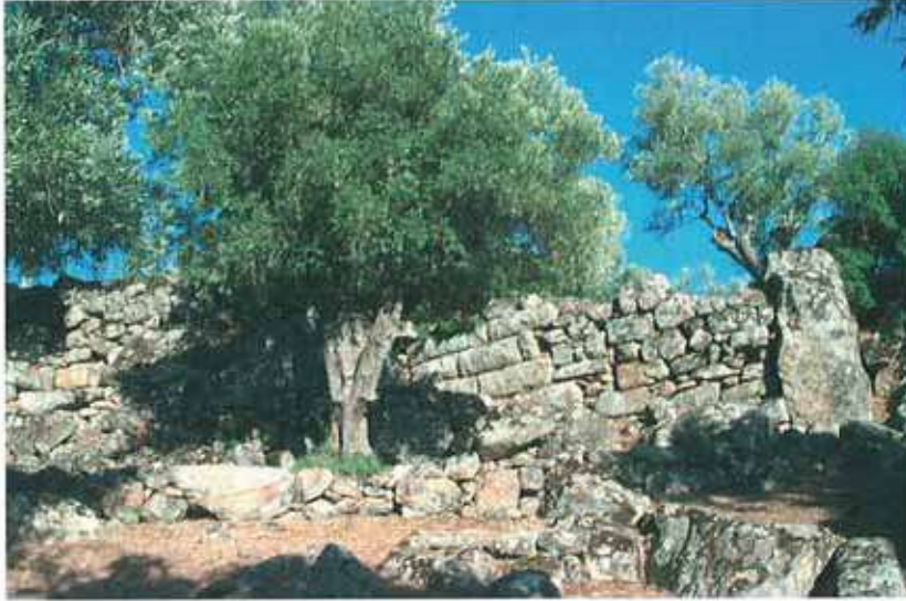
Res. 71. Çine, Deveci Asarı kalesinin (env. no: M19A005) onarım görmüş duvarı.