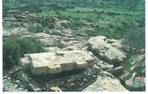
Res. 35-36. Çine, Belenköy Kabalar Gavurdamları Mevkiinde çok sayıda Karya tipi mezarın bulunduğu nekropol alanı (env. no: N20A001).