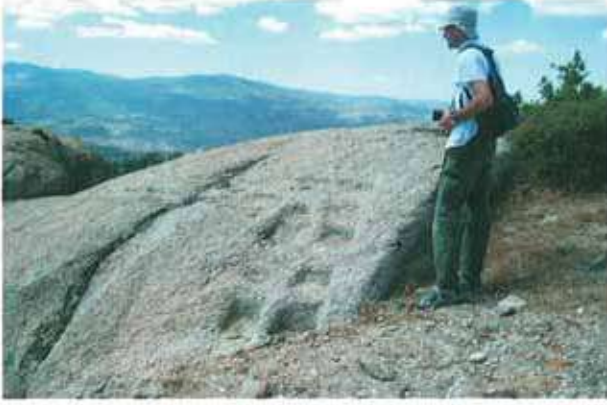
Res. 77. Çine, Soğukoluk Kocaasar kalesinde (env. no: N19A004), kayalar üzerinde, olasılıkla ahşap yapıların temellerine ait izler.