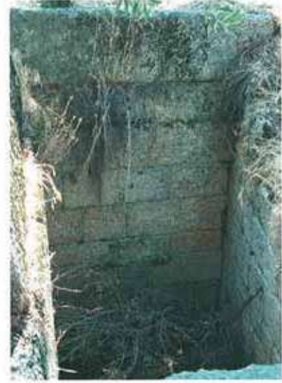
Res. 74. Çine, Hacipaşalar Keçiasarı kalesindeki iki büyük sarnıçtan biri (env. no: N20A00302).