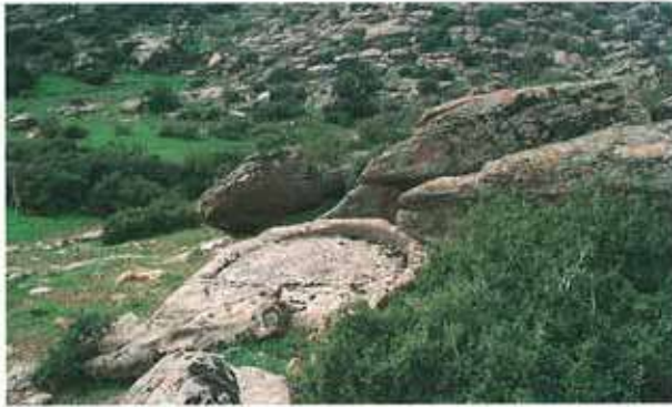
Res. 88. Çine, Belenköy Kabalar'daki nekropolde bulunan bir işlik (env. no: N20A00105).