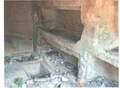
Res. 41-43. Çine, Topçam Karapınar'da kaçak kazı ile açılmış küçük bir tümülüs mezar (env. no: M20A03201).