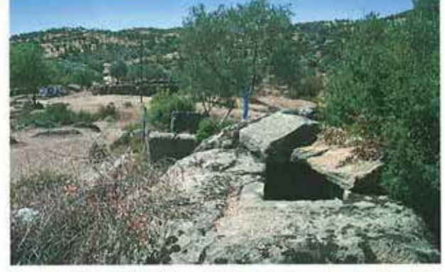
Res. 10. Çine, Bereket Mezarlık Düzünde Karya tipi mezarlarla lahit mezarların birlikte kullanıldığı bir nekropol (env. no: M20A03401).