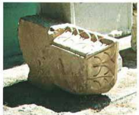
Res. 22. Nazilli, Böğrüdelik'te bulunmuş bir paye başlığı (env. no: M20A00603).