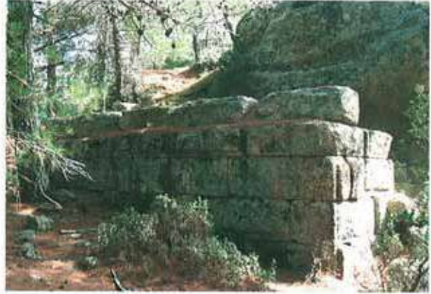
Res. 2. Çine, Seferler Havutlu Tepede, heroon olması muhtemel bir yapı (env. no: N19A00104).