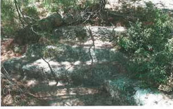
Res. 7. Çine, Kavşit Arılıtaş'ta (env. no: M20A003), merdivenli bir yol kalıntısı.