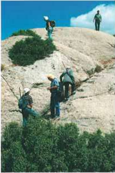
Res. 79-80. Çine, Soğukoluk Kocaasar kalesindeki basamaklar (env. no: N19A00407).