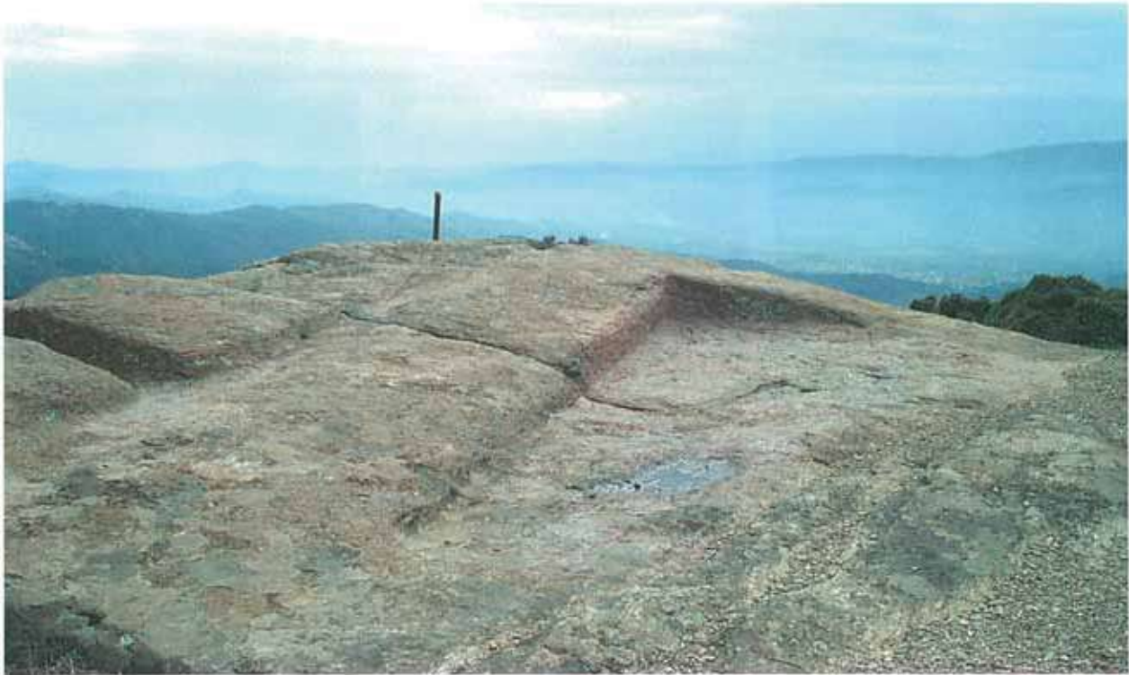
Res. 34. Çine, Tatarmemişler Okul Mahallesiindeki nekropolde yapımı tamamlanmamış Karya tipi bir mezar (env. no: M20A01601).