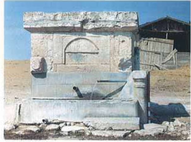
Res. 12. Merkez ilçe, Söğütçük köyü. Köy içindeki bir başka çeşmede bir Bizans Devri yapısından devşirilmiş mermerden mimari elemanlar.