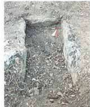
Res. 19. Alpu ilçesi, Özdenk köyü, Yumrudömen Mevkiindeki nekropolde (env. no: I26A013.001) kaçak kazılarla tahrip edilmiş taş sandık mezar.