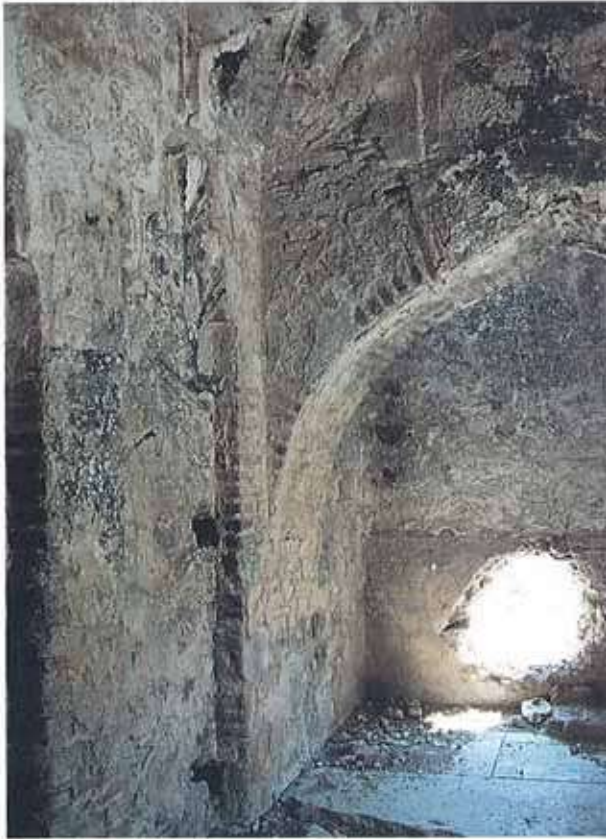
Res. 16. Aslanbeyli köyündeki hamamın iç mekânından bir ayrıntı.