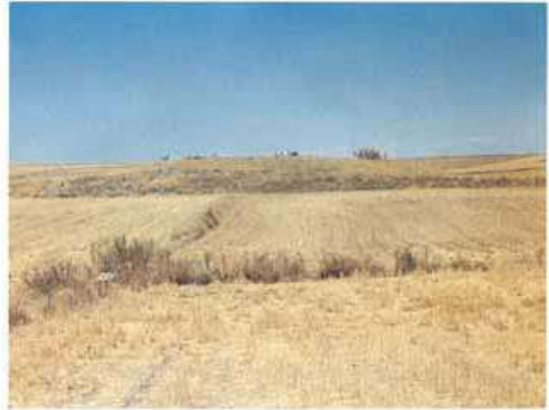
Res. 14. Seyitgazi ilçesi, Ayvalı köyü. Üzerinde ve çevresindeki tarlalarda tarih öncesi çağlara ait çanak çömlek parçaları bulunan Ayvalı Höyük (env. no: İ24A012.001).