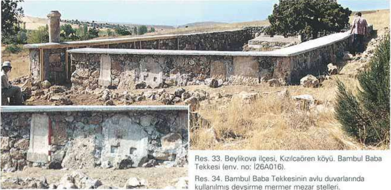
Res. 33. Beylikova ilçesi, Kızılcaören köyü. Bambul Baba Tekkesi (env. no: I26A016).