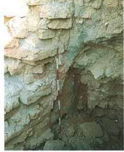
Res. 3. Kerpiç duvar, Merkez ilçe, Akören Höyüğü/ Ayran Höyüğü (env. no: İ25A003.002).