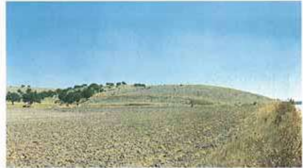
Res. 7. Merkez ilçe, Akçakaya köyü. Akçakaya Höyüğü (env. no: İ24A009.002).