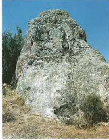
Res. 2. Merkez ilçe, Hasırcı Çiftliği. Frig kaya altarı (env. no: İ24A006.006).