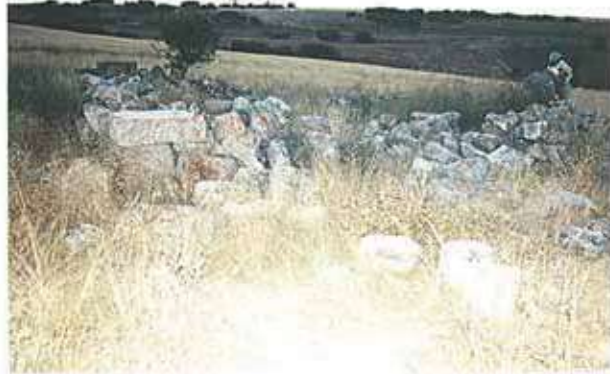
Res. 41. Sivrihisar ilçesi, Memik köyü, Aslandoğmuş Mevkiinde "Aslandoğmuş Tekkesi" olarak adlandırılan eski bir tekke kalıntısı (env. no: I27A005).