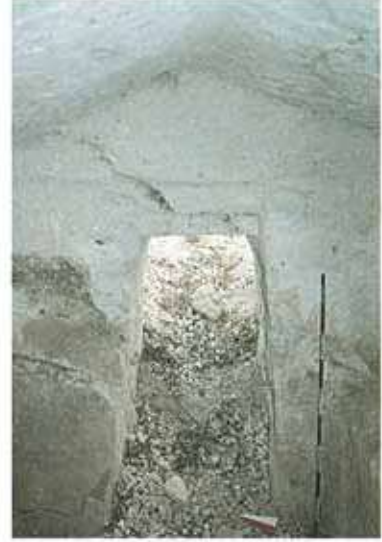
Res. 21. Kokarkuyu Mevkiinde bulunan Frig kaya mezarı (env. no: I24A011.001).