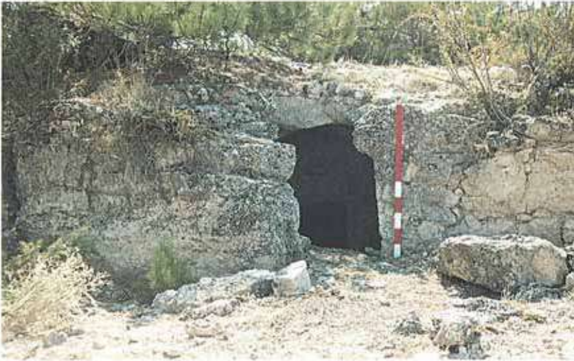
Res. 35. Beylikova ilçesinin Doğanoğlu köyü, Aşağı Doğanoğlu Mahallesinde bulunan Frig kaya mezarının (env. no: I26A011.002) girişi.