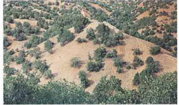
Res. 17. Alpu ilçesi, Özdenk köyü, Asarındere Mevkiinde, vadi içindeki doğal bir tepe üzerinde bulunan Asarındere Höyüğü (env. no: I26A013.002).