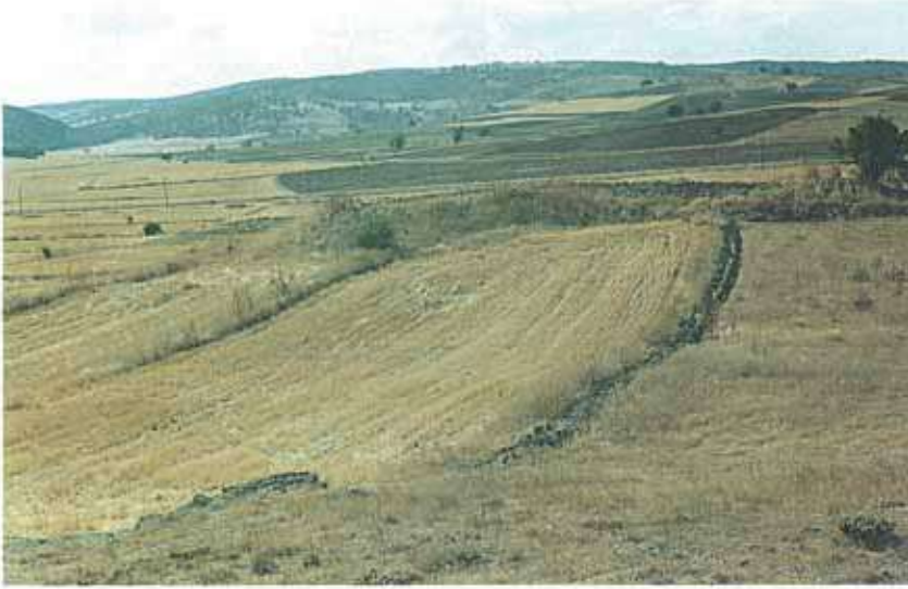
Res. 20. Seyitgazi ilçesi, Yukarısöğüt köyü. Üzeri ve etekleri tarım faaliyeti nedeniyle tahrip olmuş Kokarkuyu Höyüğü (env. no: I24A011.0002).