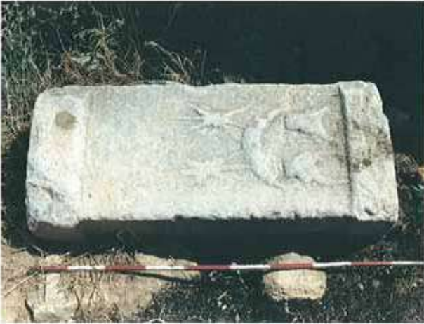
Res. 13. Seyitgazi ilçesi, Ayvalı köyü. Üzerinde kabartma boğa başı, hilal ve çifte balta motifleri bulunan mermer altar/ sunak.