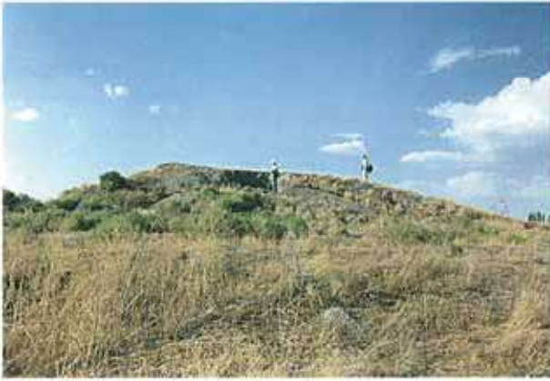
Res. 22. Alpu ilçesi, Uzunburun köyü yakınında bulunan Magila Tepesi Höyüğü (env. no: I26A010.003) kaçak kazılar ve köy yolu yapımı yüzünden tahrip olmuş.