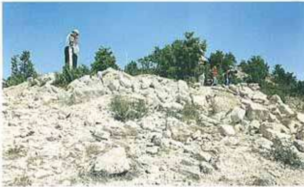
Res. 30. Eskişehir, Beylikova ilçesinde, Doğanoğlu köyünün Aşağı Doğanoğlu Mahallesiinde bulunan tümülüs (env. no: I26A011.001).