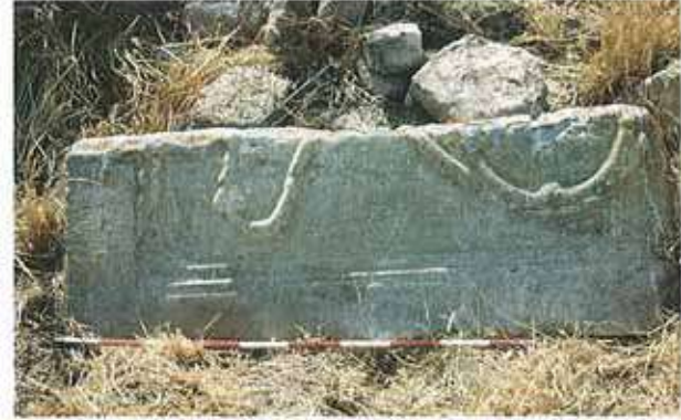
Res. 5. Yeniincesu'da Bizans Devrine ait mermer korkuluk levhası.