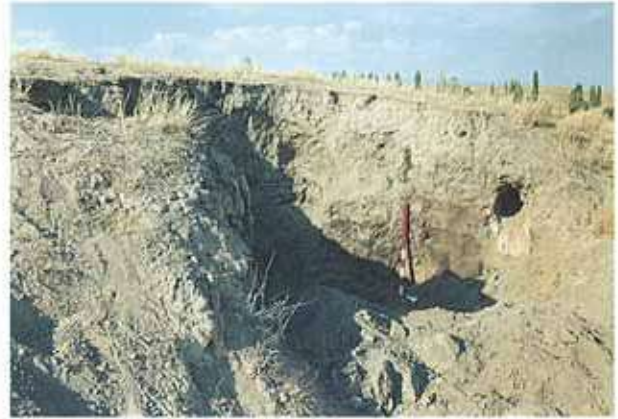
Res. 23. Alpu ilçesi, Uzunburun köyü, Magila Tepesi Höyüğünde kaçak kazı nda yanmış kerpiç duvar kalıntıları.