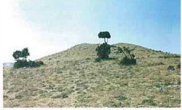
Res. 27. Alpu ilçesi, Bügdüz köyünün 3 kilometre kuzeydoğusundaki Gücükkol Höyüğü (env. no: I26A014.002).