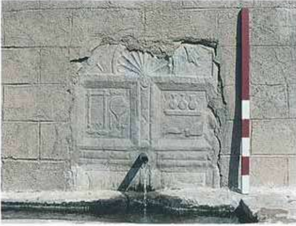
Res. 11. Merkez ilçe, Söğütçük köyü. Köy içindeki çeşmelerden birinde kullanılmış Roma Devrine ait, mermerden Frig kapı tipi mezar steli.