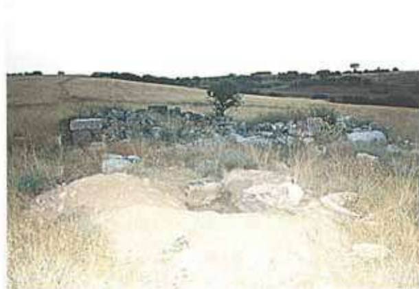
Res. 43 - 44. Sivrihisar ilçesi, Memik köyü, Aslandoğmuş Tekkesi önünde yeni açılmış kaçak kazı çukuru ve çukur içinde kesme taştan büyük bloklar.