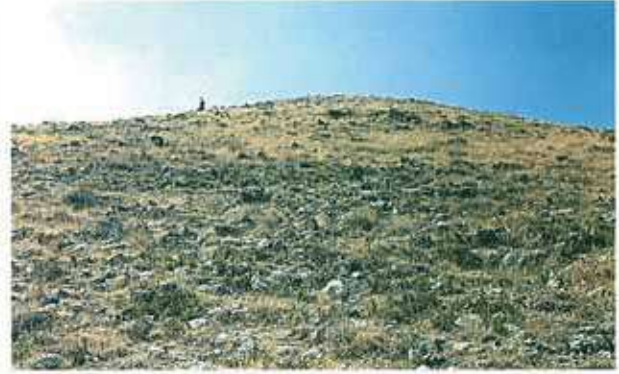
Res. 29. Bügdüz köyü sınırları içindeki bir başka höyük, Göbü Mevkii Şekerlice Deresi yakınındaki bir tepe üzerindeki Şekerlice Höyük (env. no: I26A014.003).