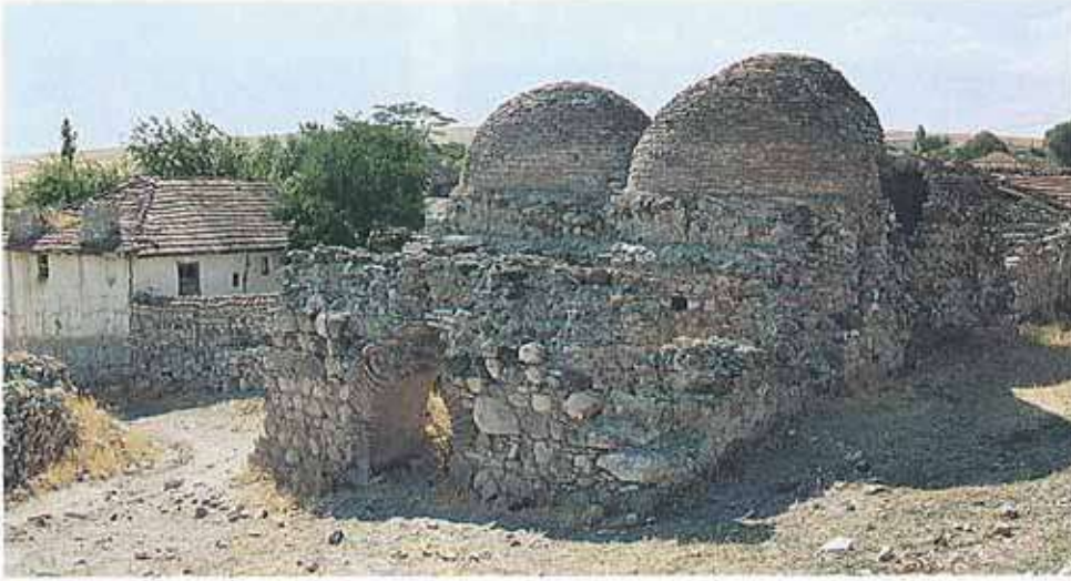
Res. 15. Seyitgazi ilçesi, Aslanbeyli köyü. Harap durumdaki Osmanlı Devri hamamı (env. no: I24A013).