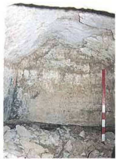
Res. 36. Aşağı Doğanoğlu Mahallesindeki, Frig kaya mezarının üçgen alınlıklı, beşik çatılı mezar odasından ayrıntı.