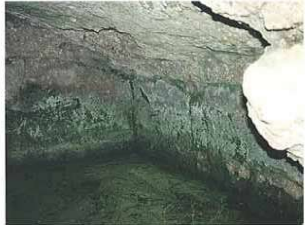
Res. 25. Alpu ilçesi, Uzunburun köyü yakınındaki Frig mezarının (env. no: I26A010.001) içinden ayrıntı.