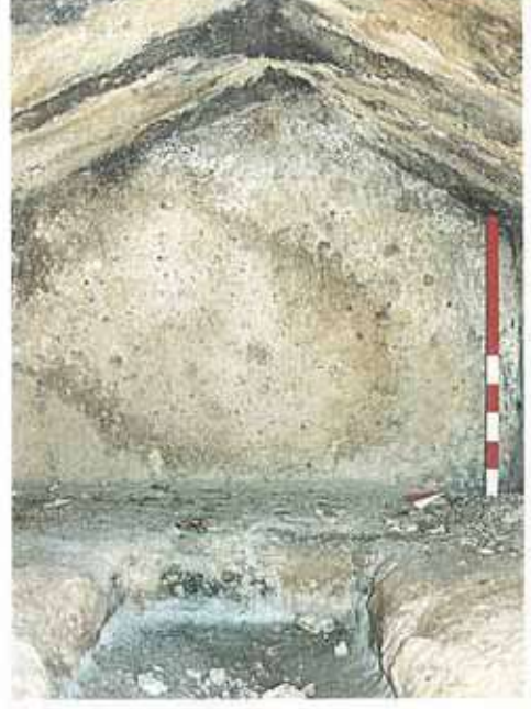
Res. 40. Aynı mezarın kayadan yontulmuş üç sekinin yer aldığı mezar odası.