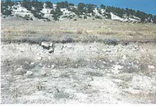
Res. 9. Merkez ilçe, Sarısuğur köyü. Kümes yapmak için kazılan alanda ortaya çıkan taş duvar kalıntısı.