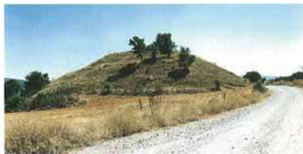
Res. 8. Merkez ilçe, Avdan köyü yakınındaki Kurupınar Höyüğü (env. no: İ24A010.001).