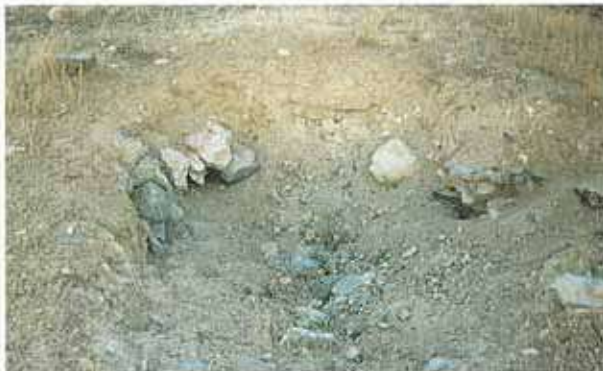
Res. 32. Bügdüz köyünün 5 km. güneydoğusundaki Bügdüz Höyüğünde kaçak kazı çukuru.