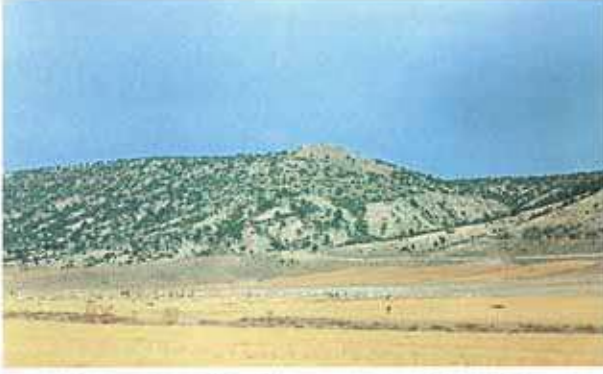
Res. 26. Gücükkol Höyüğü ova seviyesinden 128 metre yüksekteki doğal ve ağaçlık bir tepenin burun kısmında yer alıyor.