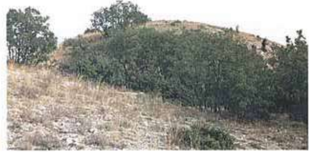
Res. 18. Alpu ilçesi, Bügdüz köyü, Ziyaret Mevkiinde bulunan Çıplak Höyük (env. no: I26A014.005).