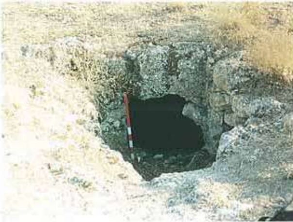
Res. 24. Alpu ilçesi, Uzunburun köyü yakınında yumuşak volkanik tuf içine oyulmuş, dromoslu, dikdörtgen odalı ve beşik çatılı bir Frig mezarı (env. no: I26A010.001).