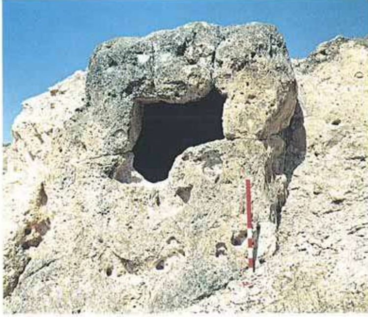
Res. 39. Sivrihisar ilçesi, Kargın köyü, Gerdekkaya Mevkii. Volkanik tüffere oyulmuş Frig oda mezarı (env. no: I26A006).