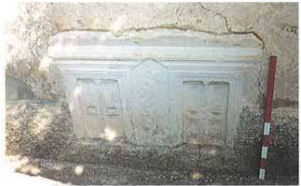
Res. 38. Sivrihisar ilçesi, Sarıkavak köyünde, mermerden, Frig kapı tipli mezar steli.