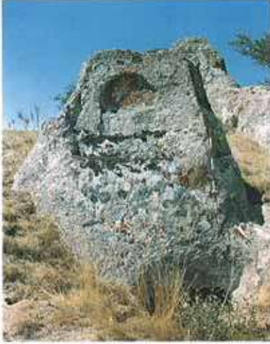
Res. 1. Merkez ilçe, Hasırcı Çiftliği. kaya mezarı (env. no: İ24A006.001) ve altar (env. no: İ24A006.005).