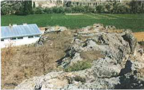
Res. 4. Merkez ilçe, Yeniincesu Mahallesi. Kaya mezarları (env. no: İ24A008.001 - İ24A008.007) ve karşısında Kilise Mevkii.