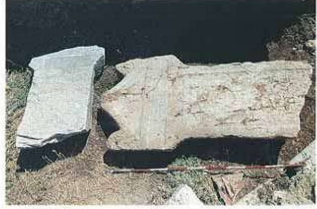
Res. 10. Merkez ilçe, Sarısuğur köyü. Muhtarın bahçesindeki yazıtlı mermer mezar stelleri.