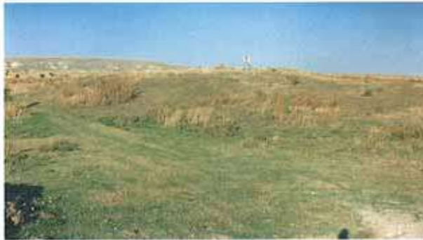
Res. 6. Merkez ilçedeki, Akören/ Ayran Höyüğü'nün genel görünümü.