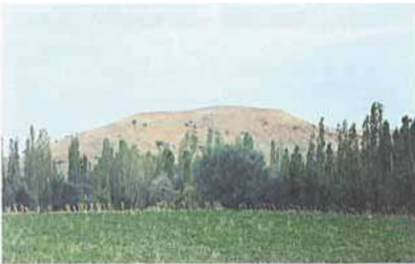
Res. 37. Mihaliççik ilçesinin Güce köyü. Köyün yaklaşık 2 kilometre güneyinde Yüğtepesi Mevkiinde bulunan Yüğtepesi Höyüğü (env. no: I26A017).