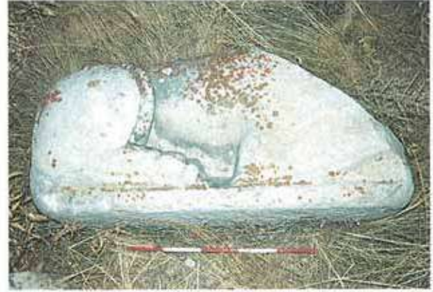
Res. 42. Aslandoğmuş Tekkesi'nde çevreye dağılmış, mermerden yapılmış, başları kırık 3 adet aslan heykelinden biri.