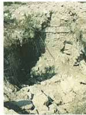
Res. 31. Tümülüsün kaçak kazılarla tahrip edilmiş mezar odası.