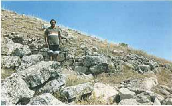
Res. 28. Alpu ilçesinde, Bügdüz köyü yakınındaki Gücükkol Höyüğünde yerleşmeyi çevreleyen sur bedeni, kaçak kazılar sonucu ortaya çıkmış.