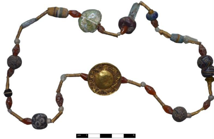
Kat. No. 4, Resim 4