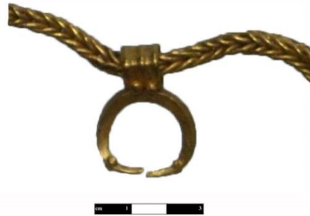
Kat. No. 3, Resim 3