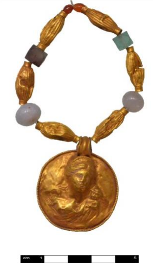
Kat. No. 1, Resim 1