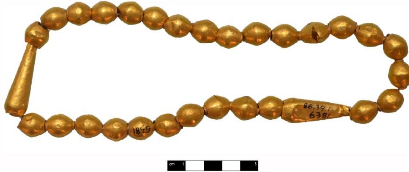
Kat. No. 2, Resim 2