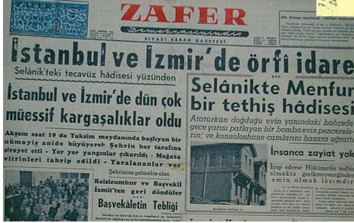
Resim 8. 8 Eylül 1955, Zafer Gazetesi

Olaylar neticesinde Rumlara ait 2200, Ermenilere ait 900, Musevilere ait 400 ve Türk vatandaşlarına ait 400 civarında ev hasar görmüş; zarar görenlere 1957 yılı sonuna kadar 6 buçuk milyon TL tutarında tazminat ödenmiştir. Olaylarda hükümete göre 11 vatandaş hayatını kaybetmiş; 300 ila 600 kadar kişi yaralanmıştır (Aldan, 2012: 73-74).