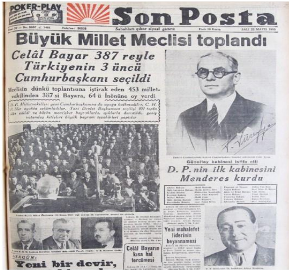
Resim 4. 23 Mayıs 1950, Son Posta Gazetesi

22 Mayıs 1950 tarihinde toplanan mecliste yapılan oylamalarda Celal Bayar Cumhurbaşkanı olarak seçilirken Refik Koraltan ise meclis başkanlığına seçilmiştir. 12 İktidar partisi olan DP'nin genel başkanlığına Adnan Menderes getirilmiş; tabii olarak hükûmeti kurma görevi de Menderes'e verilmiştir (Aslan, 2014: 40). 13