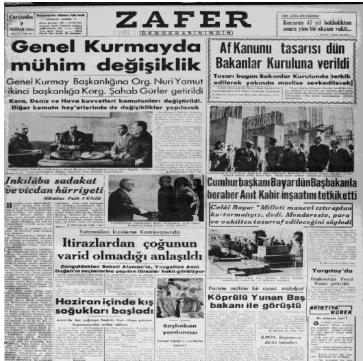
Resim 5. 7 Haziran 1950, Zafer Gazetesi

Demokrat Parti'nin iktidara geldiği 1950 yılı ile bir sonraki genel seçimlerin yapıldığı 1954 yılı arasındaki dönem, Menderes'in ve Menderes Hükûmeti'nin Türk siyasetindeki birinci dönemidir. Bu dönemde bayındırlıktan belediyeciliğe, ekonomiden tarıma, eğitimden sağlığa ve hukuktan diplomasiye kadar birçok alanda köklü değişimler yaşanmıştır. Ancak bu gelişme ve değişimlerin en dikkat çekici olanları, üst düzey askeri erkânın tasfiyesi, Arapça ezan yasağının kaldırılması, ağustos ayında yapılan yerel seçimler, Kore'ye asker gönderilmesi, Halkevlerinin kapatılması ve Anıtkabir'in inşasına başlanması hadiseleridir.