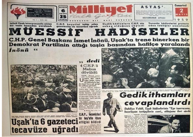
Resim 12. 2 Mayıs 1959, Milliyet Gazetesi

ve muhalefetin keskin çizgilerle birbirinden ayrışarak kanlı hale gelmesine ve hatta vatandaşların da bu kutuplaşmaya dâhil olmasına yol açmıştır.