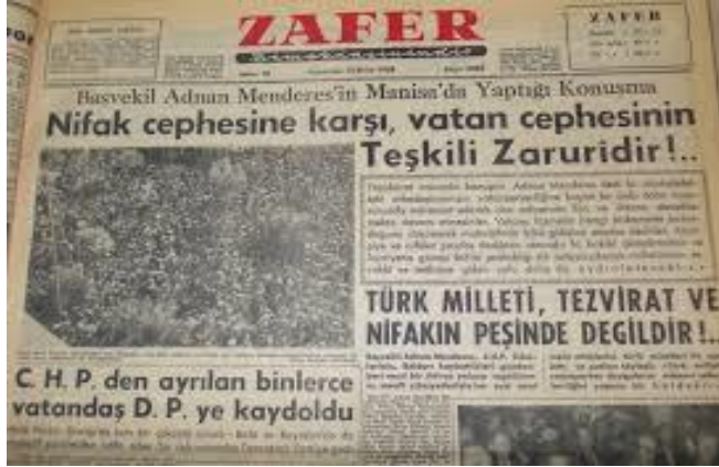
Resim 23. Zafer Gazetesi, 13 Ekim 1958.

Zafer Gazetesi, Vatan Cephesi'nin kuruluşunda ve yayılmasında yayınları ile önemli bir misyon üstlenmiştir. Gazete, kuruluşundan itibaren sürekli olarak Vatan Cephesi'ne katılımları haberleştirmiş ve V.C.'ye katılanların isimlerini günbegün yayınlamıştır (Gaytancıoğlu, 2011: 120; Koçak, 2019: 59-60). Zafer Gazetesi, yukarıda sayılanlar haricinde, seçim dönemlerinde seçmen davranışlarını ve Ankara kamuoyunu iktidarın talepleri doğrultusunda yönlendirme gibi işlevleri de yerine getirmiştir. 70