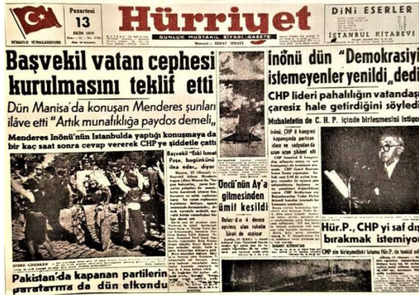
Resim 22. Hürriyet Gazetesi, 13 Ekim 1958.