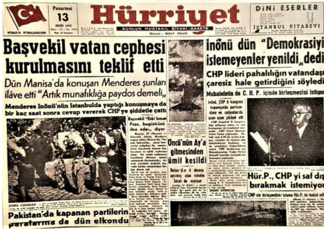
Resim 11. 13 Ekim 1958, Hürriyet Gazetesi