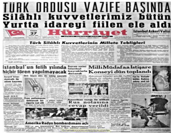
Resim 14. 27 Mayıs 1960, Hürriyet Gazetesi

14 Ekim 1960 tarihinde Yassıada Mahkemelerinde başlayan 27 Mayıs yargılamaları yaklaşık bir yıl sürdü. 592 kişinin sanık sıfatıyla yargılandığı duruşmalarda başta Cumhurbaşkanı Bayar ile Başbakan Menderes olmak üzere, bakanlar Fatin Rüştü Zorlu ve Hasan Polatkan ile Genelkurmay Başkanı Rüştü Erdelhun ve diğer on sanık 44 hakkında idam kararı verildi. Yargılamalarda 123 kişi kişi beraat ederken 418 kişi de 6 ay ila 20 arasında değişen süreyle hapis cezasına çarptırıldılar. Verilen idam kararlarından 12'si uygulanmazken 3'ü uygulandı ve Başbakan Menderes ile bakanlar Fatin Rüştü Zorlu ve Hasan Polatkan hakkında verilen idam kararları infaz edildi (Tutan, 2018: 191; Tetik, 2015: 129; Aslan, 2014: 120-121).