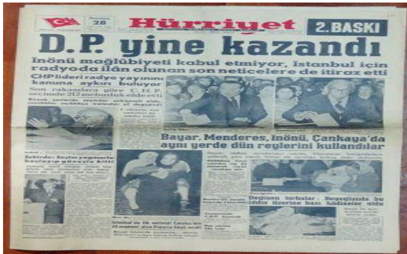
Resim 9. 28 Ekim 1957, Hürriyet Gazetesi

Seçimler sonrasında TBMM, 1 Kasım 1957'de toplandı. İlk olarak Cumhurbaşkanı ve Meclis Başkanı seçimleri yapıldı. Refik Koraltan oylamaya katılan 413 milletvekilinden 404'ünün oyunu alarak Meclis Başkanlığına