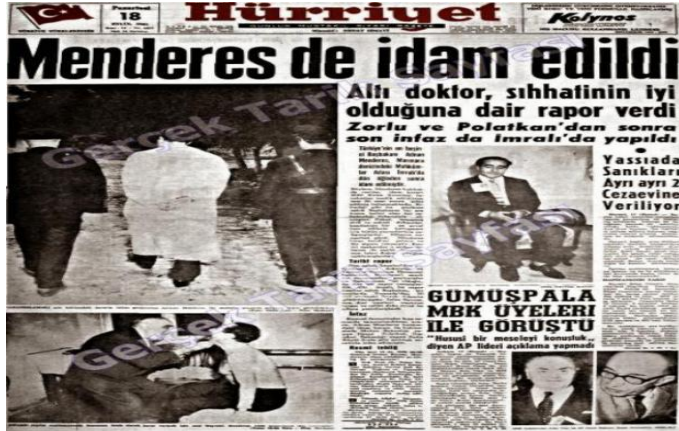
Resim 15. 18 Eylül 1961, Hürriyet Gazetesi

Âdemoğullarından Kabil'in Habil'i öldürmesi nasıl ki insanlık tarihinin ilk büyük günahı ise 27 Mayıs Darbesi de, çok partili siyasi hayattaki ilk büyük günah olarak tarihteki yerini almıştır. Böylece 1950 yılında, öncelikle kıyasla daha adil bir seçimle iktidara gelen ve 27 yıllık kudretli Tek Parti dönemini sona erdiren DP iktidarı, geride bıraktığı 10 yılda demokratikleşmeye ve iktisadi kalkınmaya önemli katkılarda bulunmuştur. İktidarın son yıllarına gelindiğinde ise muhalefet ile yaşanan anlaşmazlıklar neticesinde DP iktidarı antidemokratik uygulamalara ve sert tedbirlere başvururken; alınan her sert tedbir, yeni ve daha sert tepkileri de beraberinde getirmiştir. Menderes, bu kutuplaşma ve kamplaşmada halkı yanında tutmayı başarmış; ancak subayları ve akademi camiasını karşısına almıştır. Nitekim 27 Mayıs'ın fitilini üniversitelerde yaşanan öğrenci olayları ateşlerken, darbeyi de genç subaylar gerçekleştirmiştir. Darbenin emareleri siyasetin çeşitli vechelerinde kendini göstermeye başlamış; hatta Menderes, İnönü'nün ihtilal çağrışımından rahatsız olmuştu. Ancak Menderes, on sene evvel Başbakanlık koltuğuna yeni oturduğunda yapmış olduğu "darbe tehdidini karşı ordudaki tasfiye" hamlesini yeniden yapmayı düşünmemiş, belki de muvaffak olamamıştı.