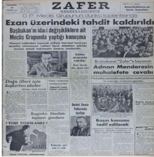
Resim 6. 14 Haziran 1950, Zafer Gazetesi