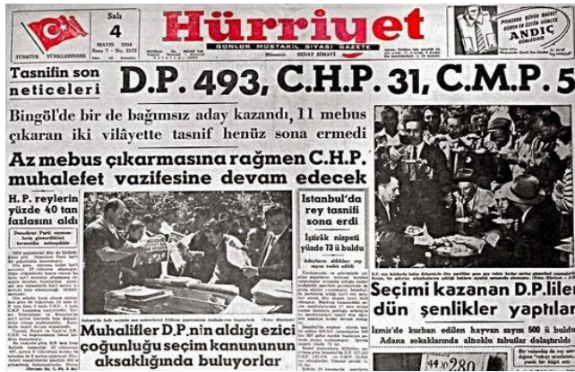
Resim 7. 4 Mayıs 1954, Hürriyet Gazetesi

DP'nin seçimlerden zaferle çıkmasının ardından sıradaki seçimler, Cumhurbaşkanı ve TBMM başkanının seçimine dair meclisteki oylamalar idi. 12 Haziran tarihinde mecliste yapılan oylamalarda Cumhurbaşkanı Celal Bayar ve Meclis Başkanı Refik Koraltan mevcuttaki görevlerine yeniden seçildiler. 23 Bayar, hükümeti kurma görevini yeniden Menderes'e verdi ve Menderes de 17 Mayıs'ta yeni kabineyi açıkladı. 24 24 Mayıs'ta