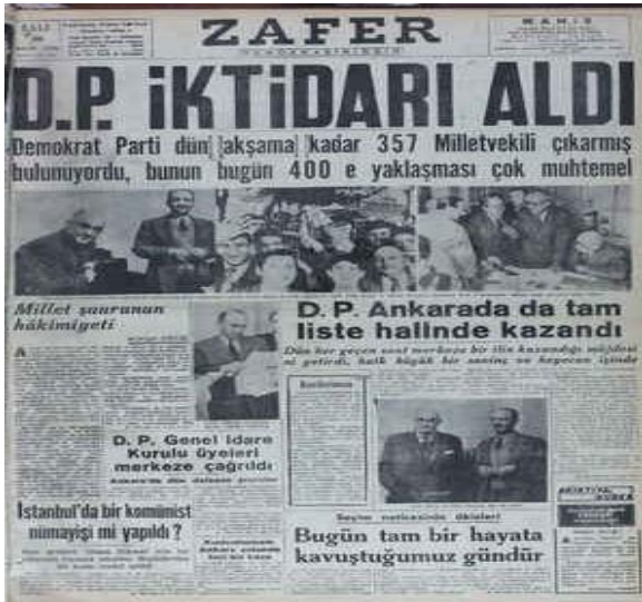
Resim 3. Zafer Gazetesi, 17 Mayıs 1950

Fransız Anayasa hukukçusu ve siyaset bilimci Maurice Duverger, Demokrat Parti'nin seçimlerden büyük bir başarıyla çıkmasını şu sebeplere bağlamıştır (Küçük, 2013: 72):