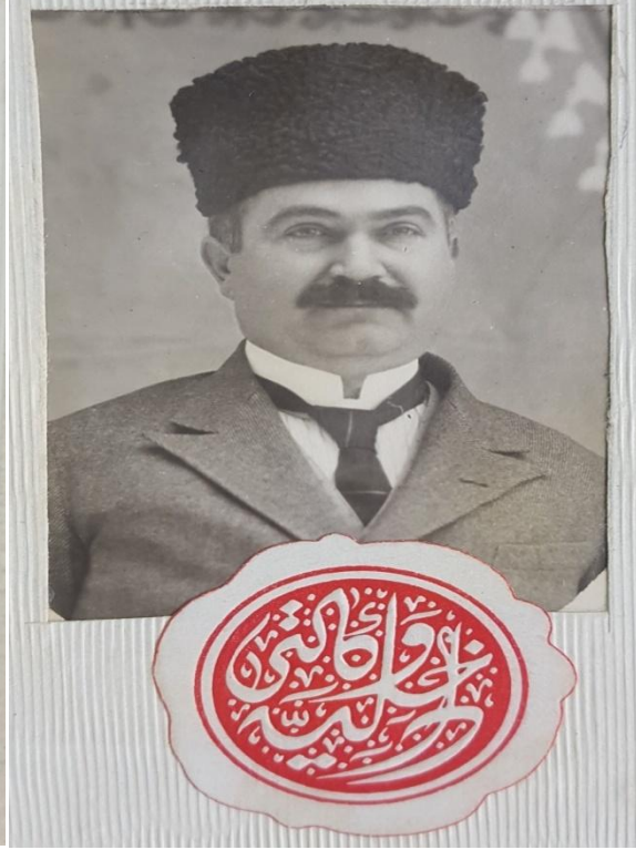
Ek 2: Ahmet Cevdet Ertuğrul