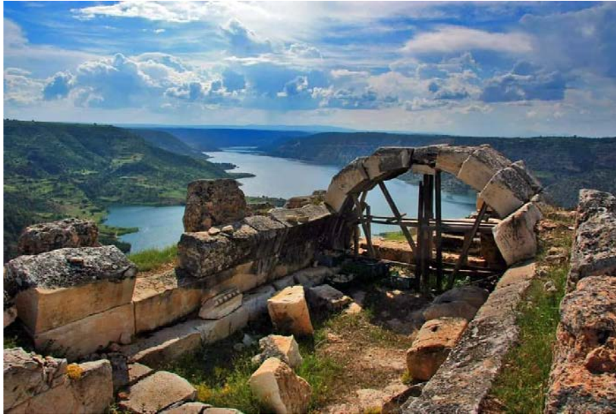
Resim 4: Apollon Lairbenos Tapınağı