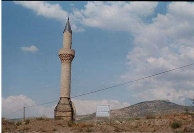
Resim 2: Kayı Pazarındaki Minarenin Restore Edildikten Sonraki Görüntüsü