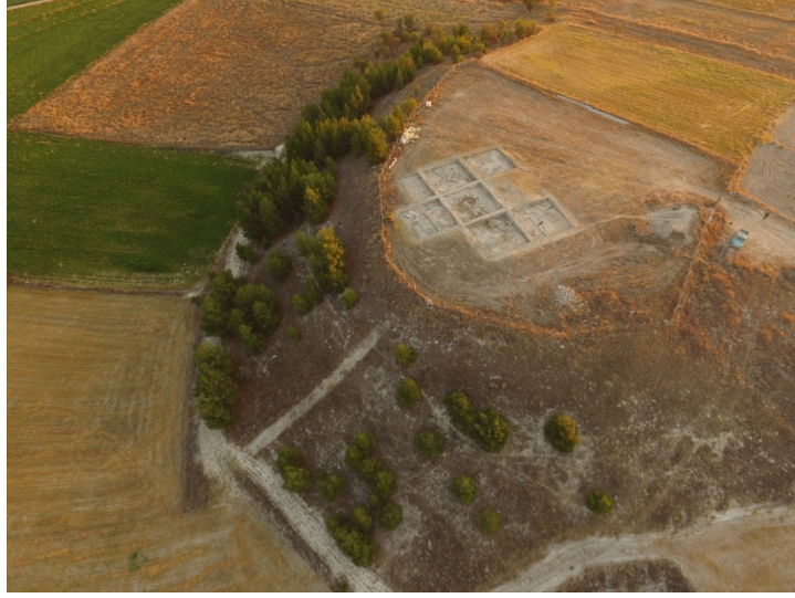
Resim 3: Bölgenin ve Anadolu'nun Tarihine Işık Tutacak Önemli Bulguların Tespit Edildiği Ekşi Höyük