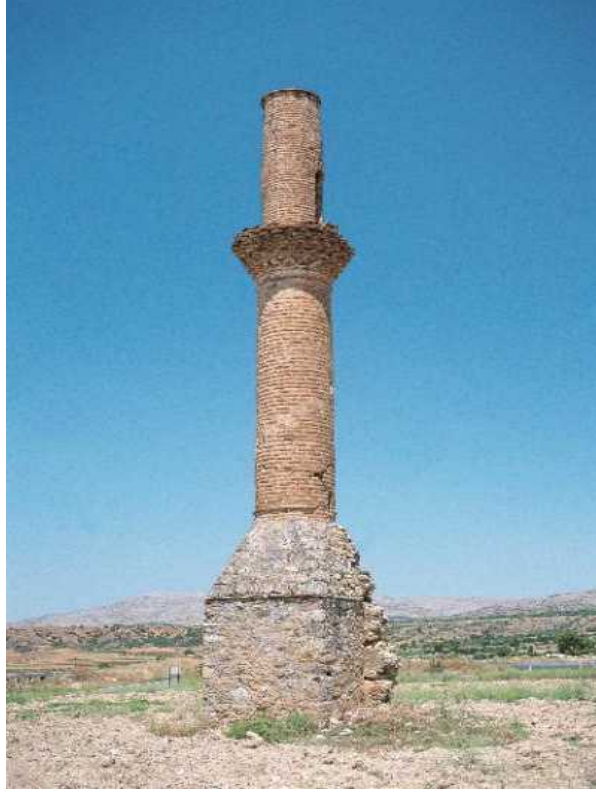
Resim 1: Kayı Pazarından Kalan Tek Hatıra Kırık Minare (Restore edilmeden önceki hali)