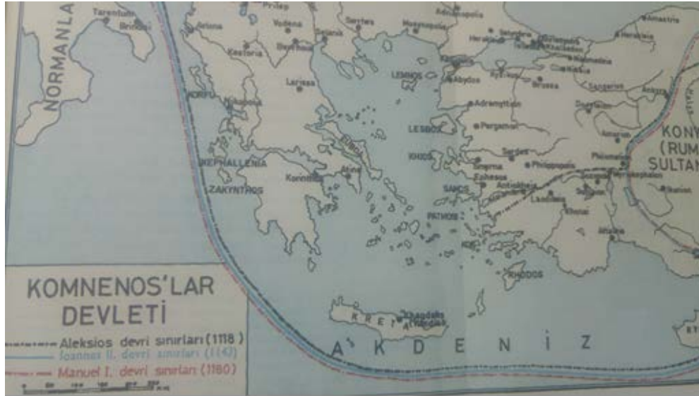
Harita 1: Alexios Komnenos döneminde Selçuklu – Bizans sınırı 11

Türkmenler, kısa sürede bu gayretlerinin semerelerini almaya başladılar. Daha Alexios Komnenos döneminde eski Phrygia bölgesinin verimli ovalarına sızmaya başladılar. Bu dönemde Bizans Antalya ile kara bağlantısını kaybetti. Çivril, Çal, Güney, Buldan üzerinden denize doğru çekilecek bir hattın gerisindeki bölgeler tekrar Türk hâkimiyetine girdi. Bundan sonraki dönemde bu bölge “darü’s- sugur” olarak anılmaya başlamıştır 10 .