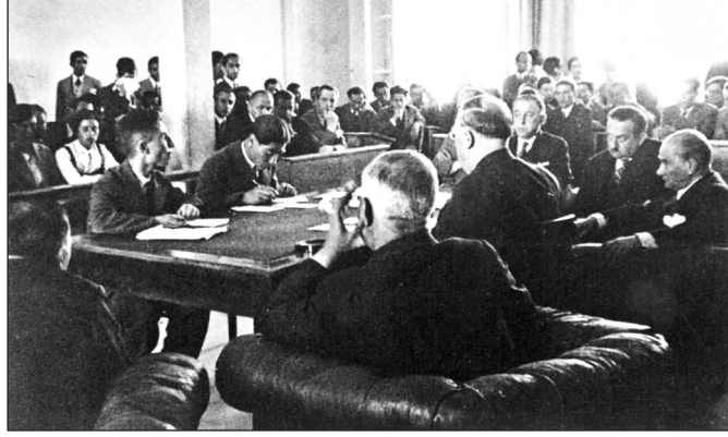
Sadri Maksudi Arsal'ın yaptığı sınavın Gazi Mustafa Kemal tarafından izlenişi (29 Haziran 1933).