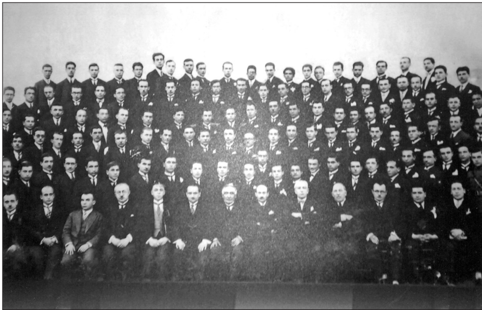
Ankara Hukuk Fakültesi profesörlerinin toplu fotoğrafları.