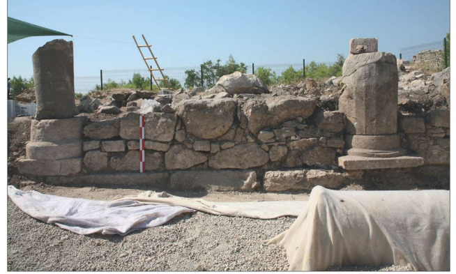
Fotoğraf 2 -Kuzey nef stylobatı üzerindeki duvarlar / Aerial Photograph of the Episcopal Church in Rhodiapolis.

Naosu üçe ayıran güney ve kuzey stylobatlar üzerinde, sütun kaideleri arasında moloz duvarlar ortaya çıkarılmıştır (Foto.2 ve 3). Yaklaşık 0.60 m. kalınlığında olan bu duvarların yükseklikleri 0.50 m. ile 0.75 m. arasın-