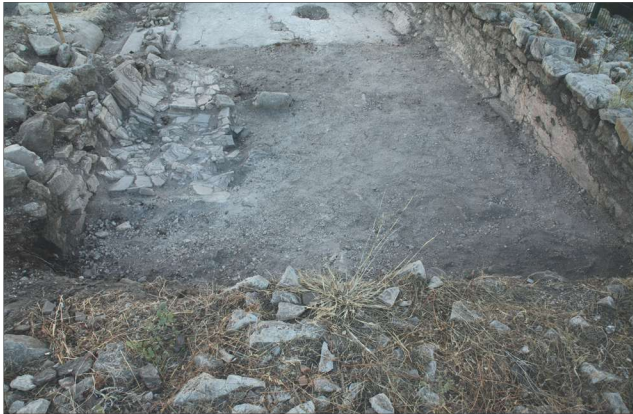
Fotoğraf 5 - Güney nefin batısında devrilmiş iki levha, batıdan görünüm / Two fallen slabs at the south nave, view from the west.

sahip bu mimari plastik eserlerin, orta nefin kuzey ve güneyindeki bu moloz duvarların üzerinde kullanılmış oldukları tespit edilmiştir (Foto.5-6). Yine güney