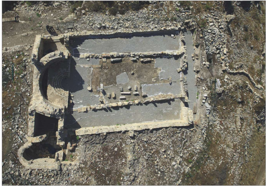
Fotoğraf 1 - Rhodiapolis Piskoposluk Kilisesi, hava fotoğrafı 2012 / Aerial Photograph of the Episcopal Church in Rhodiapolis in 2012.

Dıştan 28 m. uzunluğunda olan kilisede, doğuda 15 m. olan genişlik, batıya doğru genişleyerek yaklaşık 18.30 m.'ye ulaşır (Foto.1). Altışar sütunla üç nef ayrılan ki-