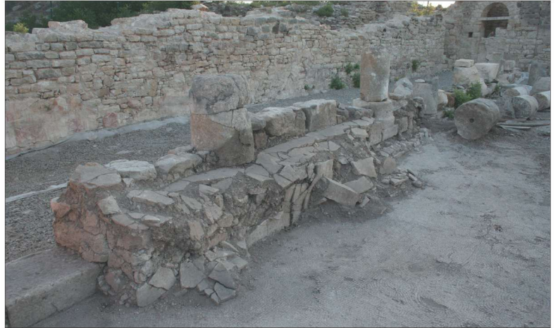
Fotoğraf 8 - Orta nefin kuzeybatısında oturma sırası / The sitting bench at the northwest of the middle nave.

Rhodiapolis Kilisesi'nde alışılmamış özelliklerden bir diğeri, yapının orta nefinde oturma yerlerinin bulunmuş olmasıdır. Kuzey stylobatın batı kısmında duvara bitişik olarak inşa edilmiş 4.20 m. uzunluğunda bir