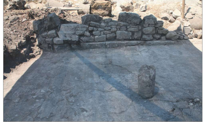
Fotoğraf 3 - Güney nef stylobatı üzerindeki duvarlar / The walls over the south barrier stylobate.

da değişmektedir, bazı yerlerde ise duvarlar tamamen yıkılmıştır. Yapının doğu ve batı duvarına bitişik duvar payelerinin önünde, yan neflerden orta nefte geçişi sağlayan açıklıklar bırakılmıştır. Üzerindeki izlerden sıvayla kaplı oldukları anlaşılan bu duvarların hemen önünde, yan nefler boyunca kaliteli işçilikle yapılmış iki yüzü bezekli çok sayıda levha parçaları, iki kenarı levha oluklu payeler ve levha üstü 3 parçaları bulunmuştur (Foto.4). Özellikle güney nefin batısında ortaya çıkarılan iki levhanın 4 bulunuş şekli ve nef zeminine düşme pozisyonundan, her biri farklı süslemelere