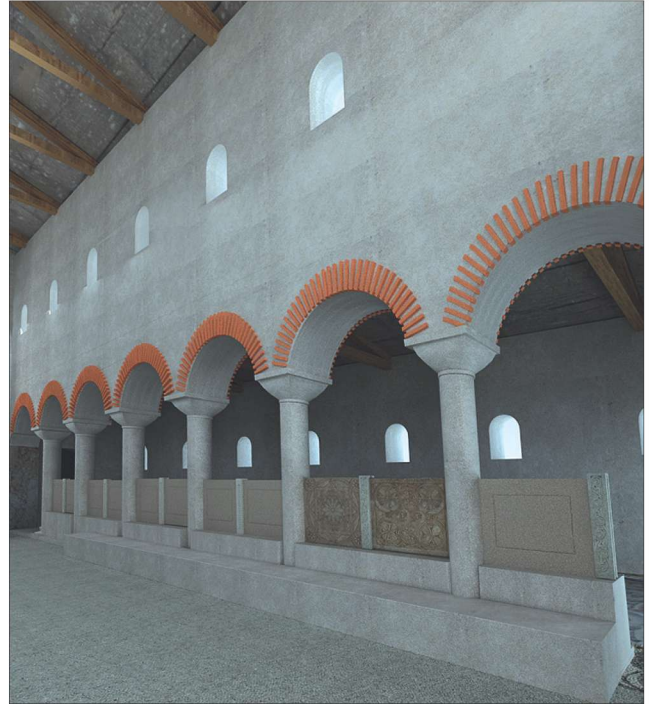
Fotoğraf 7 - Güney nef arkadı, restitüsyon (Serap Kuşu) / The arcade of the south nave, restitution.

mimari düzenleme, yan neflerden orta nefeye geçişi engellediği gibi orta nefin görülmesini de engellemektedir. Ayinin yapıldığı orta nefin yan neflerden görülmemesi