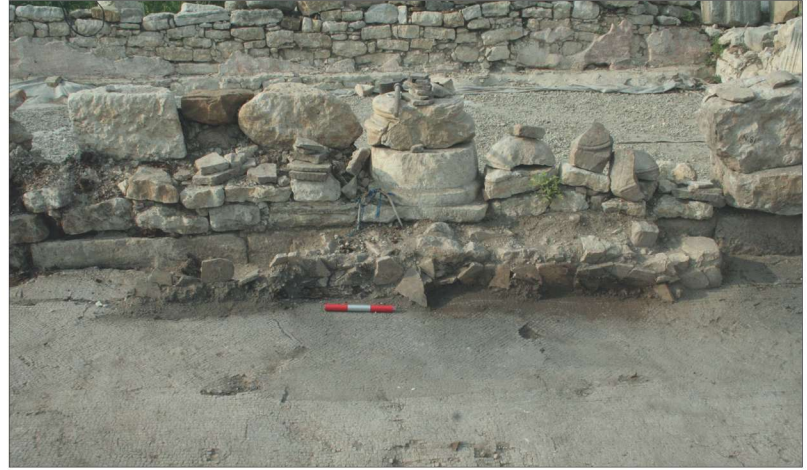
Fotoğraf 10 - Güney stylobata bitişik oturma sekisine ait kalıntılar / The remains of the sitting bench adjacent to the southern stylobate

ayrı bir yerde otursunlar ve eğer çocukları varsa, onları da yanlarında ayakta tutsunlar. Genç kızlar yer varsa otursunlar, eğer yoksa diğer kadınların arkasında ayakta dursunlar. Evli ve çocuğu olan kadınlar ayrı olarak ayakta dursunlar. Ama yaşlı kadınlar ve dullar ayrı bir yerde otursunlar" şeklinde ifadeler yer almaktadır (Gibson 1903: 65; Vööbus 1979: 131; Horner 1904: 195). Ayrıca kilisede oturma düzeninden sorumlu bir diyakozun da kiliseye girenleri gözlemek ve yönlendirmekle yükümlü olduğu yazmaktadır (Gibson 1903: 66; Vööbus 1979: 131). Didascalia'ya göre kilise içersinde kişiler statü ve yaşlarına göre ayrı yerlerde, ya oturuyorlar ya da ayakta duruyorlardı. Yaşlılar ve dullar mutlaka oturtulur, cemaatin geri kalanı ise eğer yer varsa otururlardı. Daha geç döneme ait bir kaynakta, yedinci yüzyıl yazarı, John Moschos, kilise içinde oturmaktan bahsetmektedir. Abba Theodoros'un İskenderiye'de ne zaman bir kiliseye girse, bir oturma sekisinde uyuyakaldığı yazılıdır (Wortley 1992: 140). Aynı kaynağın başka bir bölümünde ise genç bir adamın kilisede otururken başka bir adamla ruhun kurtuluşu üzerine konuşmaya başladıklarından bahseder (Wortley 1992: 179). Bir diğer eski kaynakta da Abba Silvanus, keşiş kardeşine "Dua etmek için ayağa kalktığımda, ilahi