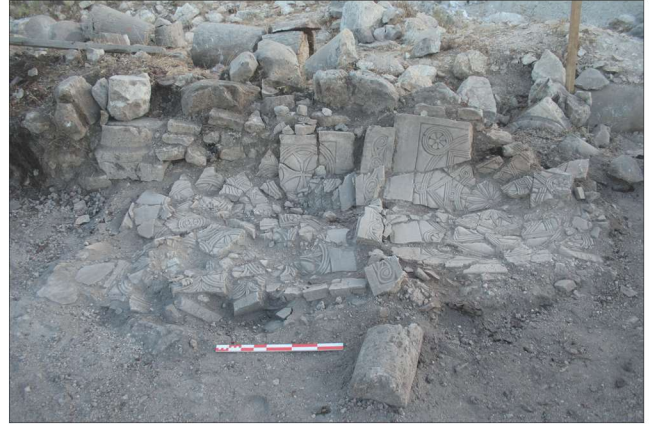
Fotoğraf 6 - Güney nefin batısında devrilmiş iki levha, önden görünüm / Two fallen slabs at the south nave, front view.

Erken Bizans kiliselerinde pek görülmeyen bu tipte bir