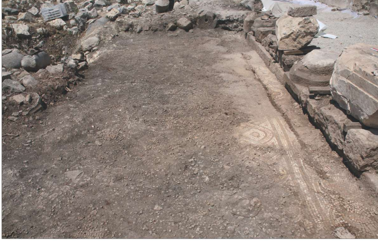
Fotoğraf 9 - Oturma sekisinin kuzey stylobata paralel mozaik üzerindeki izleri / The traces of the sitting bench over the mosaics parallel to the northern stylobate

Duvardan 0.50 m. dışarı çıkıntı yapan sekinin zeminden yüksekliği ise 0.50 m'dir. Ayrıca orta nefin mozaik zemininde, stylobata 0.30 m. mesafede, oturma sekisinin izlerini doğuya doğru takip etmek mümkündür (Foto.9). Aynı şekilde güney stylobatın batısında, sty-