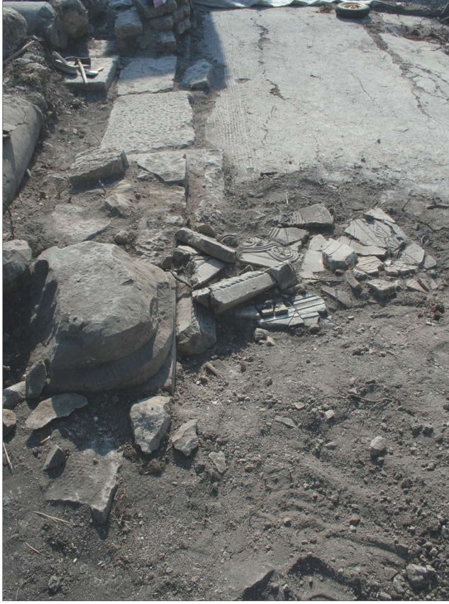
Fotoğraf 4 - Güney nefte bulunan bazı levha ve levha üstü parçaları / Some pieces of slabs and upper elements of the slabs found at the south nave.

sahip bu mimari plastik eserlerin, orta nefin kuzey ve güneyindeki bu moloz duvarların üzerinde kullanılmış oldukları tespit edilmiştir (Foto.5-6). Yine güney