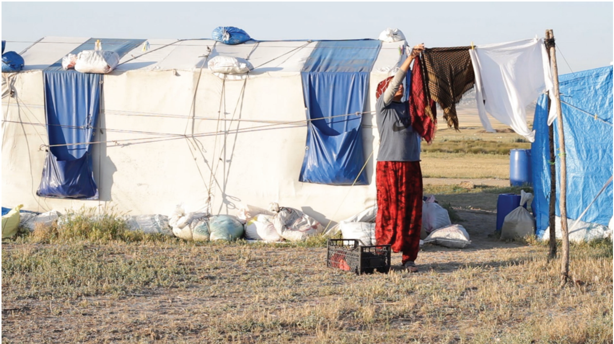
Fotoğraf 4. Beylikova'da bulunan çadırlardaki bir mevsimlik gezici kadın tarım işçisi elle yıkadıkları çamaşırları asıyor Photo 4. A seasonal agricultural women worker who hanging clothes that her wash by hand in Beylikova Kaynak: Bilal Çiftçi, Temmuz, 2020.

Görüldüğü gibi, Muharrem yoksulluk başta olmak üzere içinde bulunduğu şartlardan dolayı ağır biçimde sosyal dışlanmaya maruz kalmıştır. Muharrem tarlada çapa yaparken veya tarlayı yabancı otlardan temizlerken, işverenin tarlaya gelip kendilerini "aşağıladığını" söylemiştir. Muharrem tarlada çalışırken yanlışlıkla da olsa bir defa bir tarlada biraz ot bırakılması durumunda bunun işveren tarafından asla kabul edilemez olduğunu belirtmiştir: