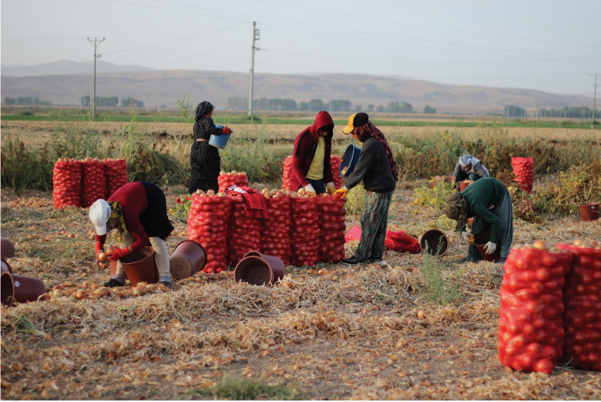
Fotoğraf 1. Covid-19 Pandemi sürecinde eğitim çağındaki çocuklar aileleriyle birlikte Beylikova'da mevsimlik gezici tarım işlerinde çalışıyor Photo 1. Children of school age working with their families in seasonal agricultural works in Beylikova, during the Covid-19 Pandemic

Bütün bunlara ek olarak, ilki Çin'in Vuhan Eyaleti'nde 17 Kasım 2019 tarihinde Covid-19 olarak tanımlanan yeni bir salgın virüsü ortaya çıkmış ve bu salgın daha sonra neredeyse tüm dünyaya yayılmıştır. "Yarattığı büyük bir ekonomik altüst oluş ve çalışma süreleri üzerindeki etkileri ile, COVID-19 krizi, dünyada 3,3 milyarlık işgücünü etkilemektedir" (ILO, 2020a: 4). ILO'nun 18 Mart 2020'de yayımladığı Covid-19 ve Çalışma Yaşamı: Etkiler ve Yanıtlar adlı raporda, göçmen işçilerin Covid-19 salgının etkilerine karşı çok daha savunmasız kaldıklarının ve bu durumun da işçilerin hem çalışma yerlerine erişme hem de ailelerine geri dönme imkânlarını kısıtlayacağını altı çizilmiştir (ILO, 2020b: 6). Ayrıca, ILO tarafından 7 Nisan 2020'de yayımlanan bir diğer raporda ise, tarım sektöründe çalışanlar, Covid-19 sürecinde "en büyük risk altındaki sektörler" grubu içinde oldukları değerlendirilmiştir (ILO, 2020a: 4).