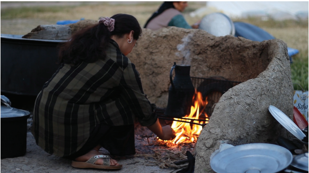
Fotoğraf 6. Beylikova'da bulunan çadırlardaki bir mevsimlik gezici kadın tarım işçisi ateşin başında Photo 6. A seasonal agricultural women worker who in tents in Beylikova standing by the fire

Öteden beri, görünmeyen veya çalışma koşulları ve genel durumları çok da tartışma konusu yapılmayan mevsimlik gezici tarım işçileri ile çocuk işçilerin, Covid-19 Pandemisi ile birlikte yaşam ve çalışma koşulları gittikçe daha da kötü hale gelmeye başlamıştır. Genelde mevsimlik tarım işçiliği özelde de çocuk işçiliği bu toplumun "kanayan yarası" ve "adeta kangreni" haline gelmiş bulunmaktadır. Pandemi sürecinde eve kapanma ve sokağa çıkma yasakları devam ederken bu kısıtlamalar "tarımsal üretimi gerçekleştirdikleri" gerekçesiyle (İçişleri Bakanlığı, sayı: 89780865-153.E.6202) mevsimlik tarım işçilerini, ne yazık ki kapsayamamaktadır. Benek'in (2020a; 2020b) de dikkat çektiği gibi, mevsimlik tarım işçi aileleri ve bu sektörde çalışan çocuk işçiler, adeta virüs ile baş başa bırakılarak/kalarak kaderlerine terkedilmektedir. Bu yüzden onları zorlayan şey aslında virüs değil, içinde buldukları koşullardır. Nitekim Kalkınma Atölyesi'nin de dikkat çektiği gibi, pandemi sürecinde yoksulluk ile virüs arasında (Development Workshop, 2020) kalan bir gruptan