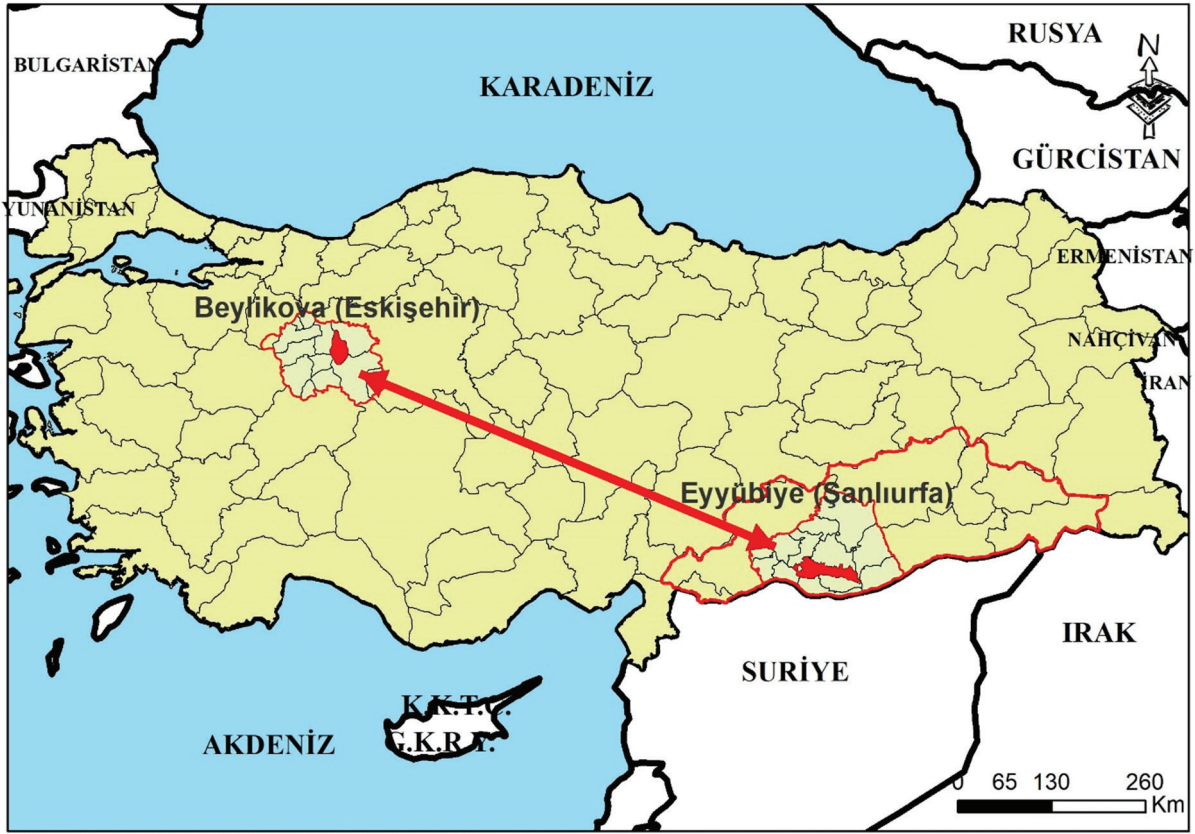
Şekil 1. Çalışma alanının lokasyonu Figure 1. The location of study area

Başta Şanlıurfa olmak üzere, Güneydoğu ve Doğu Anadolu bölgelerindeki illerden her yıl yüzlerce insan aileleriyle birlikte, mevsimlik gezici tarım işlerinde (ekim, çapa, sulama ve toplayıcılık gibi) çalışmak için Beylikova (Eskişehir) ilçesine gelmektedir. Genelde 15 Nisan'da buraya gelen işçiler, 15 Kasım tarihine kadar burada kalırlar. Bu tarihten sonra ise, kazandığı bir miktar para ile geldiği yere geri dönerler. Bu araştırma kapsamında görüşülenlerin en az 15 yıldır buraya her yıl düzenli