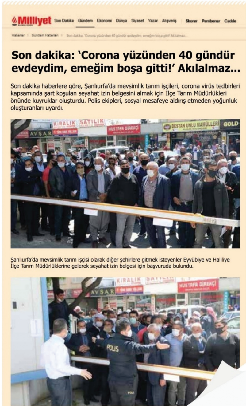
Şanlıurfa'da mevsimlik tarım işçisi olarak diğer şehirlere gitmek isteyenler Eyyübiye ve Haliliye İlçe Tarım Müdürlüklerine gelerek seyahat izin belgesi için başvuruda bulundu.