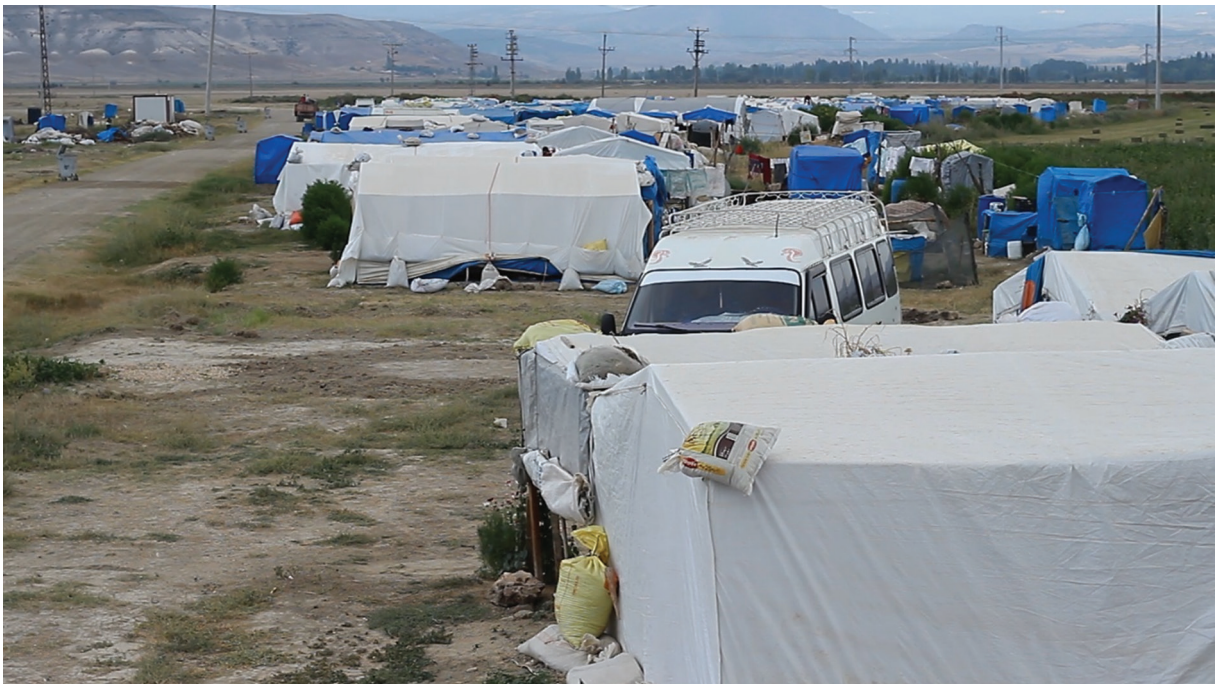
Fotoğraf 2. Beylikova'da mevsimlik gezici tarım işçi ailelerine ait yol kenarında kurulmuş çadırlar Photo 2. Tents that roadside established belonging to seasonal agricultural worker families in Beylikova Kaynak: Bilal Çiftçi, Temmuz, 2020.

olarak gelip, 6-7 ay çalışıp sonra memleketine geri döndüğü saptanmıştır. Dolayısıyla aslında Beylikova ilçesi, mevsimlik gezici tarım işçiliği üzerine yapılacak bir çalışma için uygun bir çalışma alanı niteliği taşımaktadır. Her yıl mevsimlik gezici tarım işçilerine ait yüzlerce çadırın kurulduğu (Fotoğraf 2) Beylikova ilçesi pandemi sürecinde mevsimlik geçici tarım işçilerinin yaşam koşullarının iyi okunabildiği Türkiye'deki başat yerler arasındadır.