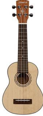
Şekil 2. Soprano Ukulele (pmtonline, 2020)

Soprano Ukulele: Geleneksel Hawaii Ukulele'si olmakla beraber en fazla kullanılan formudur. Dört çeşit arasında en küçük boyutlara sahip olan (53 cm) soprano Ukulele, parlak ama yumuşak bir tona sahip olup, yeni başlayanlar için en ideal olanıdır. Telleri yukarıdan aşağıya doğru G, C, E, A (sol, do, mi, la) olarak sıralanır (Andreas, 2015).