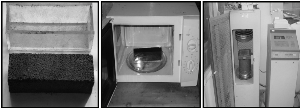
Şekil 1. Cam kalıp, mikrodalga fırın (1200 W, 2450 MHz) ve basınç presi (200 ton)