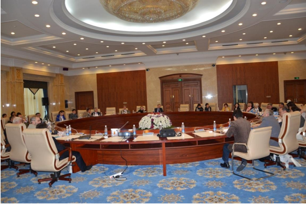
Foto 13: Başkanlığını Prof. Dr. V. Ya. BUTANAYEV'in (ASTAIBEG) yaptığı oturumdan bir görüntü

Kırgızların dünü, bugünü ve geleceği (tarihi, dili, etnolojisi, antropolojisi, yaşayışı inancı ve geleceğe yönelik düşünceleri), Kırgızların Türk boy ve toplulukları ile ilişkisi, Kırgızların Türk Birliği içindeki yeri... ile ilgili bildirilerin büyük bölümünün alan ve arşiv araştırmalarından elde edilen özgün bilgi, bulgu ve belgelere dayanması önemlidir.