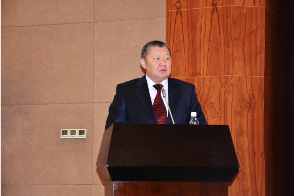
Foto 8: Kırgızistan Cumhuriyeti Başbakan Yardımcısı Tokon MAMIDOV