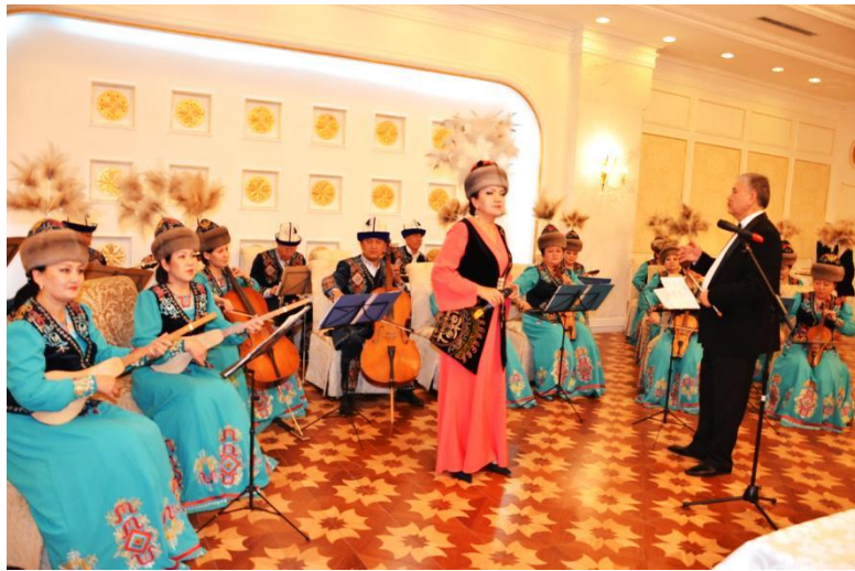
Foto 15: Kırgız bir sanatçı eserini icra ederken

Sempozyum aralarında yapılan ikramlar, hazırlanan yemekler, yemeklerden sonra Cumhurbaşkanlığı orkestrasının Kırgızistan’dan ve Türk dünyasının farklı bölgelerinden çalıp söyledikleri eserler konuk bilim adamlarını âdeta büyüledi.