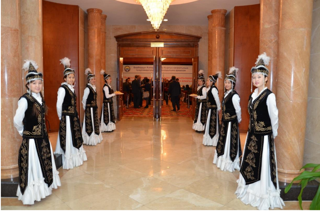
Foto 2: Otantik kıyafetleriyle bilim adamlarını ve katılımcıları karşılayan Kırgız kızları

Açılış töreninin yapılacağı ve açılış bildirimlerinin sunulacağı salona gelen konukları otantik kıyafetlerini giymiş Kırgız kızları karşıladılar. Karşılamanın eski Türk / Kırgız geleneğine uygun şekilde yapılması hem geleneğin devam ettirildiğini göstermesi hem de Kırgızların konukseverliğini yansıtmaya bakımdan önemlidir.