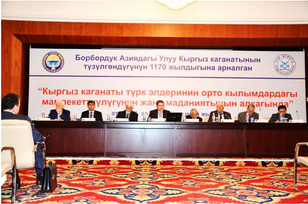
Foto 10: Açılış oturumunda bildiri sunan bilim adamlarının genel görüntüsü