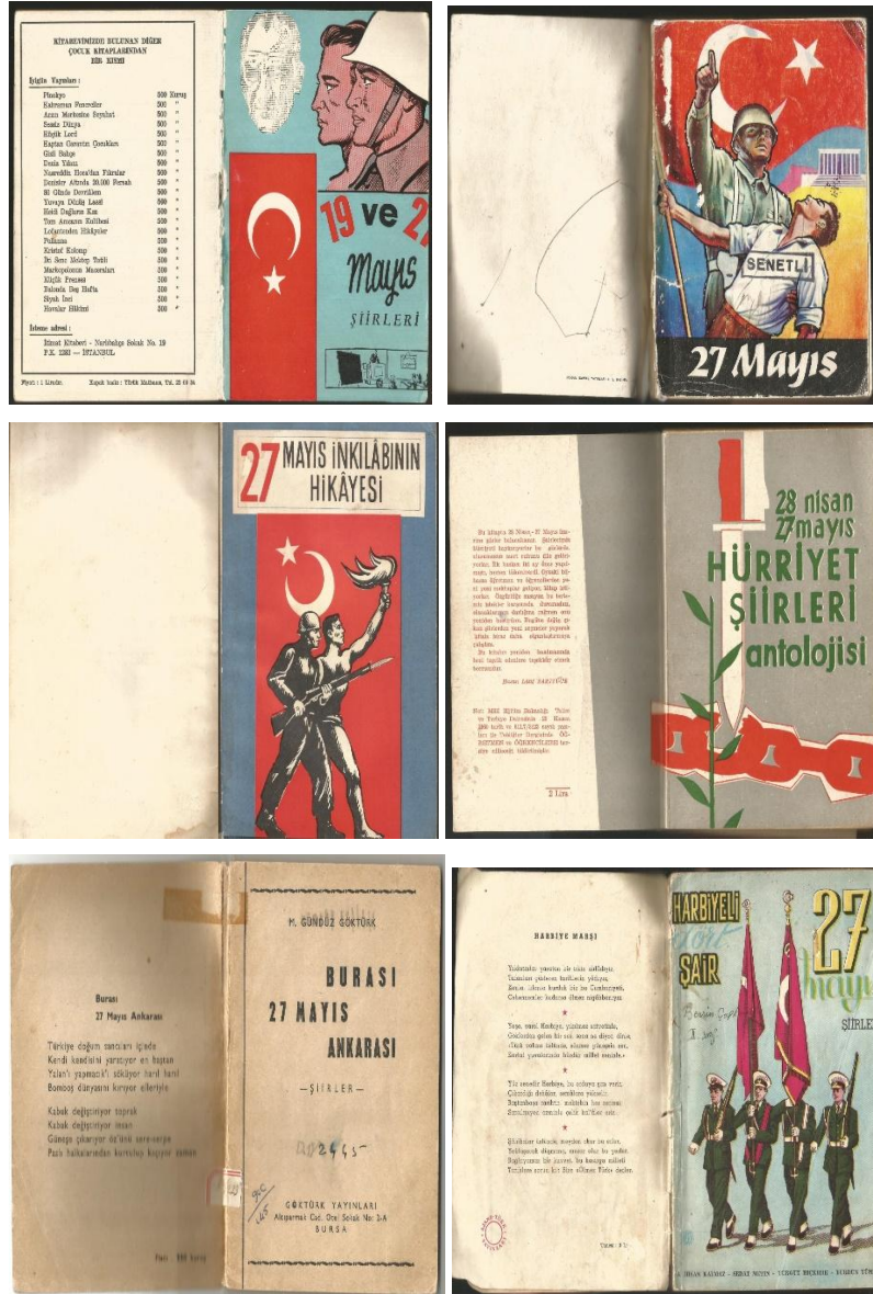
Ek-1 İncelenen Şiir Antolojileri ile Broşürlerin Ön ve Kapakları