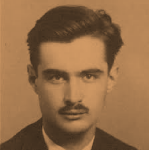
Ziya Osman Saba

Özellikle 1944 yılı öncesinde yakın arkadaşı Cahit Sıtkı Tarancı'nın Ziya Osman Saba'ya yazdığı mektuplarda, karşılaşılan sorunların yarattığı bunalımın izleri görülmektedir. Cahit Sıtkı Tarancı'nın kaleme aldığı Ziya'ya Mektuplar adlı kitapta -özellikle 1941-1943 yılları arasında- saadet, mesut olmak ve can sıkıntısıyla ilgili satırlar dikkat çeker. Tarancı, dostu Saba'yı sürekli umut ve mutluluk konusunda yüreklendirmekte, onun içinde bulunduğu buhranlı günleri aşması için yardım etmeye çalışmaktadır. Ziya Osman Saba'nın babasını kaybetmesi karşısında duyduğu hisler, Tarancı'nın 1 Mayıs 1941 tarihli mektubuyla anlaşılır: