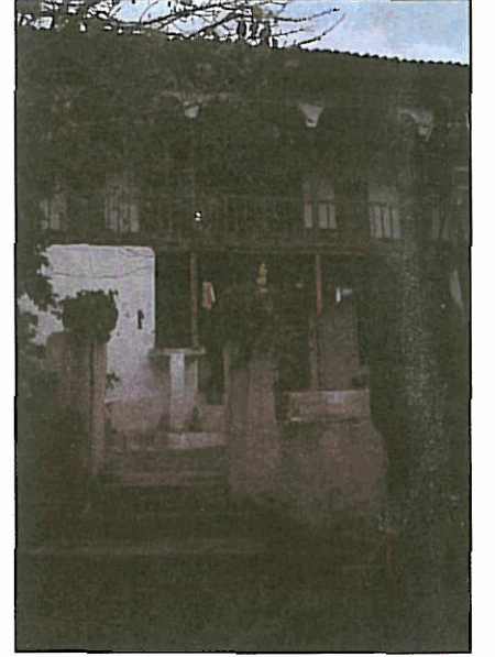
Resim 5. Yeşilyurt'ta yöre mimarisini yansıtan bir örnek. Evin içi burada dokunan geleneksel dokumalarla döşenmiş ve halka açılmıştır. Küçük bir etnografya müzesi görünümündedir.