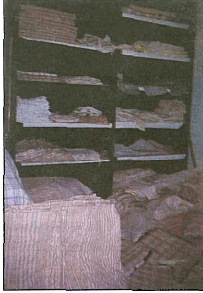
Resim 4. Yeşilyurt'ta dokunan ve pazarlanan dokumalardan örnekler