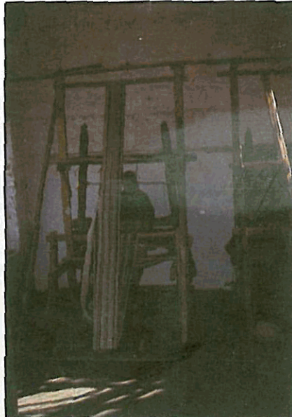
Resim 1. Yeşilyurt'ta kullanılan ahşap dokuma tezgahı

Yeşilyurt'ta el dokumacılığını canlandırma çalışmalarının başında yörenin önemli hammadde-lerinden biri olan ipek ipliği temini için, ipek böcekçiliği yeniden ele alınmış ve belediyeye ait 5 hek-