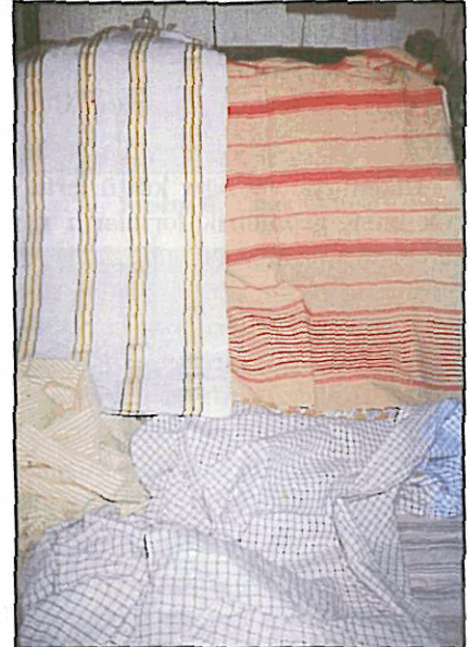
Resim 2. Yeşilyurt geleneksel dokumalarından örnekler