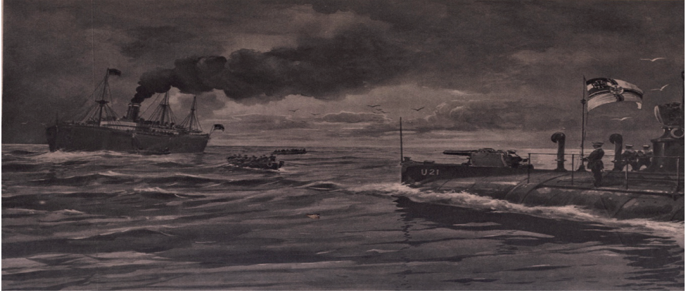
Çizim 1: U-21 Denizaltısının İrlanda Denizi'nde İngiliz Ticaret Gemisini Batırması ( Das Interessante Blatt , "Die Blockade Englands", s. 3, 11 Şubat 1915)