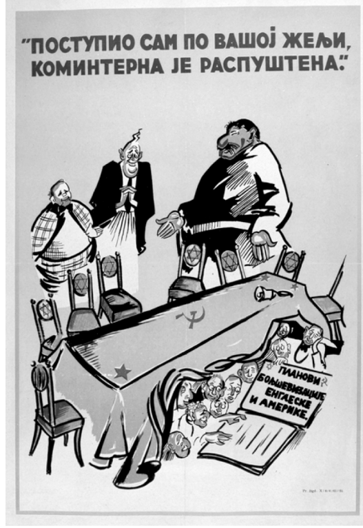
Resim 3. “Komintern” Propaganda Poster 32

Anlambilimsel açıdan incelendiğinde, posterde ayakta bulunan üç kişinin, görsel kodlar üzerinden sırasıyla Churchill, Roosevelt ve Stalin olarak resmedildiği görülmektedir. Stalin’in yanında bulunan masanın üzerindeki yıldız ve orak-çekiç görselleri Komünizm ideolojisini, masanın çevresinde yer alan sandalyedeki altıgen yıldızlar ise Yahudileri simgelemektedir. Masanın altında yer alan 10 kişinin ise Yahudi oldukları gerek görsel gerekse yazılı kodlar üzerinden ortaya konulmaktadır. Posterde bulunan Komintern görevden alındı sözünün Stalin tarafından Roosevelt ve Churchill’e söylenmesi, Stalin’in ABD ve İngiltere’nin müttefikliğini güçlendirmek amacıyla aldığı bir karar olarak aktarılmaktadır. Buna karşılık masanın altında Yahudilerin bulunması ve Planlar Bolşevikleştirme İngiltere ve Amerika sözlerine yer verilmesi ile Stalin’in Yahudilerin denetiminde Komintern’i görevden aldığı algısı oluşturulmaktadır. Bu yolla Sovyetler Birliği’nin,