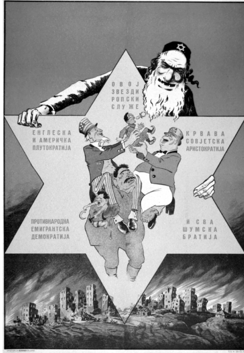
Resim 5. “Yıldız” Propaganda Poster 36

Anlambilimsel açıdan incelendiğinde, posterde uzun, beyaz sakal, bukleli saç, siyah takke ve takkenin üzerinde altıgen yıldız bulunan ve büyük altıgen yıldızın arkasında yer alan kişinin Yahudi olduğu mesajı verilmektedir. Posterde bulunan yıkılmış ve yanmakta olan ev görselleri, savaş sırasında yıkıma uğrayan yerleşim yerlerinin metonimi olarak ön plana çıkarılmaktadır. Altıgen yıldızın içerisinde bulunan üç büyük erkek görselinden görsel kodlar üzerinden Stalin’e benzetilen kişi Sovyetler Birliği’ni, ABD bayrağı taşıyan kişi ABD’yi ve İngiltere bayrağı taşıyan kişi de İngiltere’yi temsil etmektedir. Posterde yer alan iki küçük erkek görselinin de Müttefik Devletleri tarafından desteklenen işbirlikçiler olduğuna yönelik algı oluşturulmaktadır. Altıgen yıldızın içerisinde resmedilmelerinden dolayı Müttefik Devletleri’nin Yahudilerin denetiminde olduğuna yönelik mesaj verilmektedir. Posterde yer alan yazı kodlar üzerinden de Müttefik Devletleri’nin Yahudilerin çıkarlarını gerçekleştirmek için bir aracı haline geldiği iddia edilmektedir. Posterde yer alan yıkılmış ve yanmakta olan yerleşim yerlerinin de sorumlusu