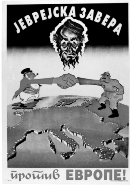
Resim 6. “Avrupa” Propaganda Posteri 38

Anlambilimsel boyutta analiz edildiğinde, posterde üzerinde İngiliz bayrağı bulunan ve haritada İngiltere'nin bulunduğu yerde yer alan erkek görseli İngiltere'yi, görsel kodlar üzerinden Stalin'e benzetilen ve haritada Sovyetler Birliği'nin toprakları üzerinde yer alan erkek görseli de Sovyetler Birliği'ni temsil etmektedir. Posterin üstünde yer alan bukleli saçlı ve sakallı, başında siyah bir takke bulunan erkek kafası ise Yahudileri simgelemektedir. Posterde, İkinci Dünya Savaşı sırasında Mihver Devletleri'nin denetiminde bulunan toprakların gri ile gösterilmesiyle bu toprakların dost ve güvenilir yerler olduğuna yönelik Sırlar nezdinde algı oluşturulmaya çalışılmaktadır. Buna karşılık İngiltere ve Sovyetler Birliği'nin topraklarının turuncu olarak sunulması ve Yahudi görselinin altında Sovyetler Birliği ve İngiltere'yi simgeleyen kişilerin el sıkışması ile Sovyetler Birliği ve İngiltere Sırlara düşman olarak sunulmaktadır. Posterde Sovyetler Birliği ve İngiltere arasında oluşan ittifakın Yahudiler tarafından gerçekleştiği ve yazılı kodlardan bu ittifakın temelini Avrupa'ya karşı komplo üzerine oluşturulduğu iddia edilmektedir. Diğer bir deyişle Sovyetler Birliği ve İngiltere'nin