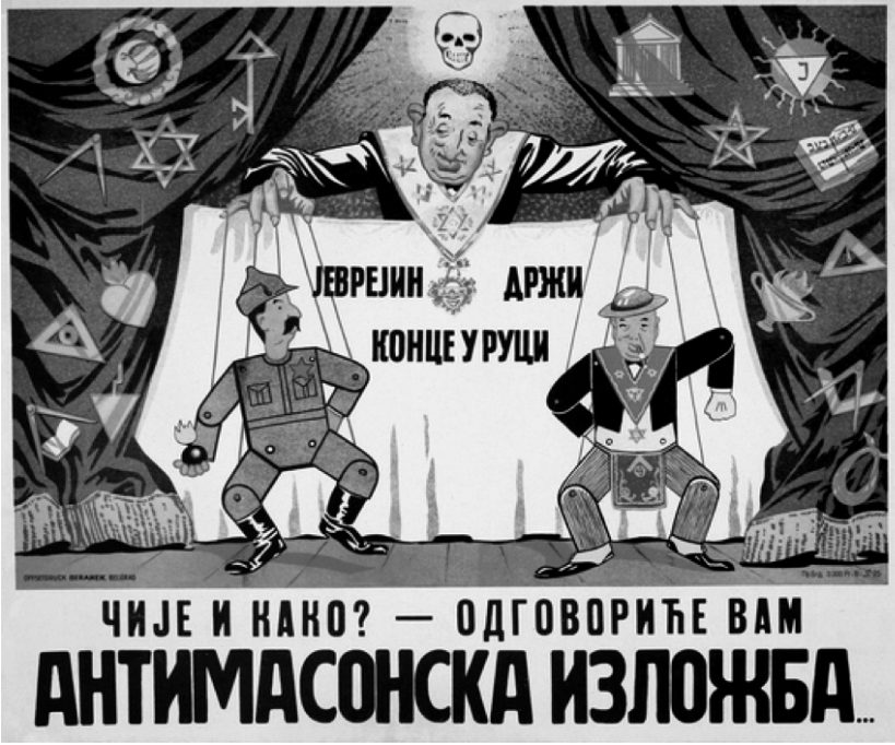
Resim 4. “Kukla” Propaganda Poster 34

Anlambilimsel boyutta analiz edildiğinde, posterde kuklaları kullanan kişinin, üzerinde bulunan altıgen yıldızdan ve posterde bulunan yazılı koddan Yahudi olduğu mesajı verilmektedir. Posterdeki Yahudi tüm Yahudilerin metonimi olarak ön plana çıkarılmaktadır. Yahudi'nin arkasında bulunan kurukafa ölümü simgelemekte, bu yolla Yahudi de korku metaforu olarak kitlelere sunulmaktadır. Posterde bulunan perdelerde Yahudileri simgeleyen işaretlerin bulunması, sahnenin Yahudilerin kontrolünde olduğu mesajını vermektedir. Sahnede bulunan iki kukla, görsel kodlar üzerinden Stalin ve Churchill'e benzetilmekte ve iplerinin doğrudan Yahudi'nin ellerinde olduğu yansıtılmaktadır. Posterdeki Stalin görseli Sovyetler Birliği'ni, Churchill görseli de İngiltere'yi temsil etmektedir. Böylece Sovyetler Birliği ve İngiltere'nin denetiminin Yahudilerin elinde olduğuna yönelik algı oluşturulmakta, bu algı üzerinden her iki devletin Mihver Devletleri ile savaşmasının temelinde Yahudilerin olduğu iddia edilmektedir.