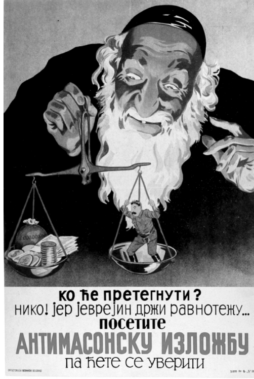
Resim 1. “Terazi” Propaganda Posteri 28

Anlambilimsel açıdan incelendiğinde, posterde teraziyi tutan kişinin Yahudi olduğunun kitlelere aktarıldığı görülmektedir. Bu aşamada posterdeki kişinin Yahudi olduğunu belirtmek için uzun, beyaz sakal, siyah elbise ve siyah takke metonimlerinden yararlanılmaktadır. Diğer yandan posterde yer alan yazılı kodlar da kişinin Yahudi olduğunu açıklamaktadır. Terazinin bir köşesinde bulunan ABD doları ABD’yi, İngiliz sterlini ise İngiltere’yi simgelemekte, diğer köşesinde bulunan insan görseli ise Stalin’i temsil etmektedir. Posterde terazinin içerisinde yer alan kişinin sol göğsünde kırmızı bir yıldızın olması, diğer yandan kıyafet, bıyık ve saç metonimleri, kişinin Stalin olduğuna vurgu yapmaktadır. Stalin de posterde Sovyetler Birliği’ni simgelemektedir. Yahudi’nin ABD doları, İngiliz sterlini ve Stalin’den büyük gösterilmesi ve onları teraziye koyması ile Yahudilerin Müttefik Devletleri üzerinde kontrol kurduğu mesajı verilmektedir. Hem ABD ve İngiltere’nin hem de Sovyetler Birliği’nin kontrolünün Yahudilerin elinde olduğu