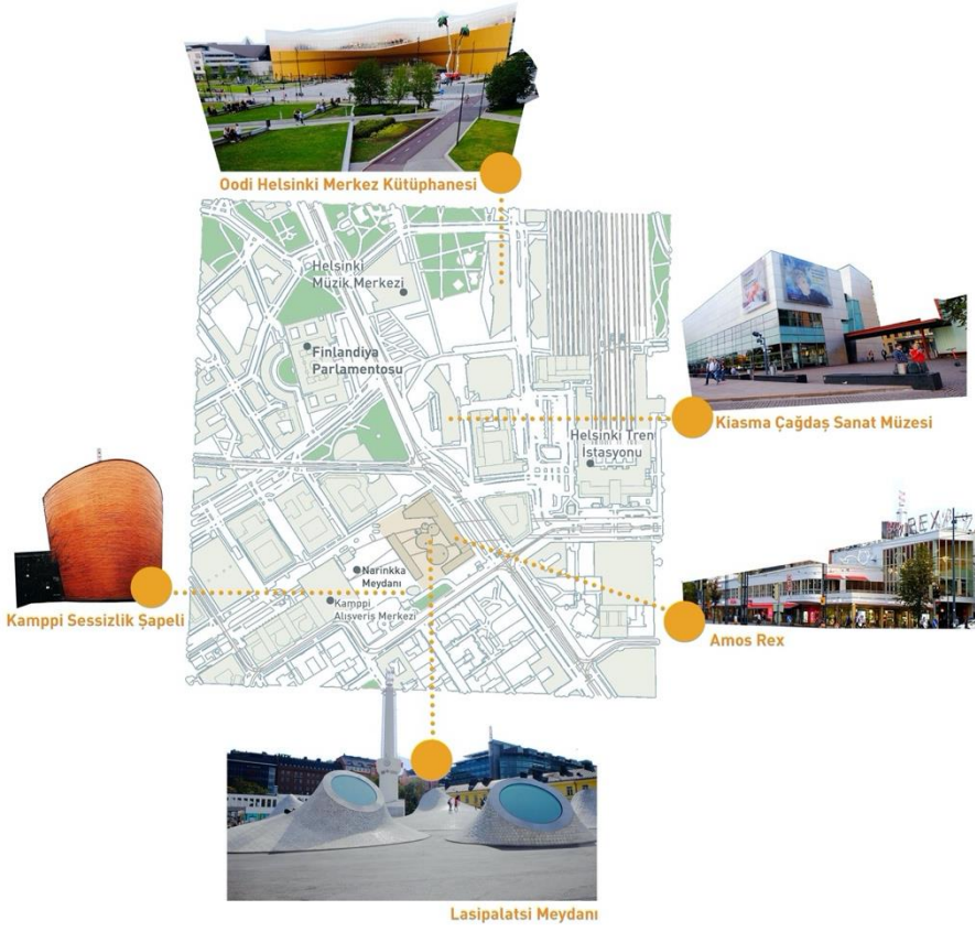
Şekil 2. Helsinki kent merkezi, Lasipalatsi Meydanı ve çevresi. (Karayılanođlu, 2019)

Lasipalatsi Fince’de “cam saray” anlamına gelmektedir. Meydana ismini veren Lasipalatsi binası 1936’da üç mimarlık öğrencisi Viljo Revell, Heimo Riihimäki ve Niilo Kokko tarafından, olimpiyatlarda kullanılmak üzere geçici bir yapı olarak tasarlanmıştır. İşlevine uygun şekilde, fonksiyonist mimari üsluptadır. İçerisinde sinema, restoran, kafe, kış bahçesi ve dükkanlar olan yapı, inşa edildiđi dönemde ilgi odađı haline gelmiş ve böylece kalıcı olarak kullanımı devam etmiştir. Helsinki’nin sembollerinden biri haline gelen yapı, 1965 yılından itibaren kapsamlı bir özel müze olan Amos Anderson Müzesi olarak kullanılmıştır (Amos Rex, 2020).