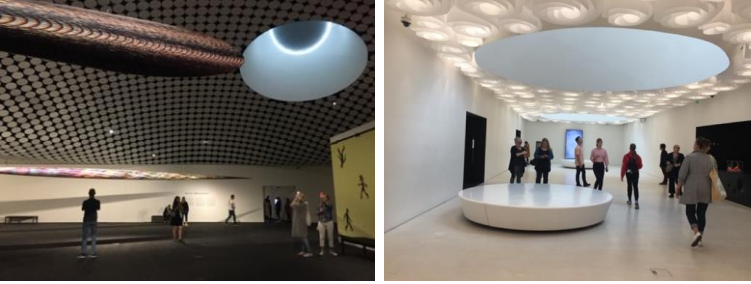
Şekil 6. Amos Rex Yeraltı Müzesi galerilerinde genel atmosfer. (Karayılanoğlu, 2019).

Cadde kotunun altında kalan galerilerde kubbeli çatı pencereleri ile gün ışığı iç mekâna alınmaktadır. Bu pencereler serginin içeriğine göre gerektiğinde ışığı geçirmeyecek şekilde kapatılabilmektedir. Meydandaki sarmal saat kulesi ve cephedeki merdiven gibi bölgeye ve yapıya ait sembolik öğelere yöneltilen bu açıklıklar hem dışarıyı içeriye taşımakta hem de bu öğeleri iç mekânda odak noktası haline getirmektedir. Açık planlı, geniş galeri mekânları etkileyici bir mekân deneyimi sunmaktadır (Şekil 6).