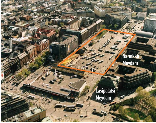
Şekil 3. Otobüs durakları olarak kullanıldığı dönemde Narinkka ve Lasipalatsi Meydanları (Public Space, 2006).

Lasipalatsi Meydanı, Narinkka Meydanı ve Mannerheimintie Caddesi arasında yer almaktadır. Önceleri otobüs durakları olarak kullanılan Narinkka ve Lasipalatsi Meydanları, yayalaştırma politikası ile yapılandırılmış ve otobüs durakları bölgeden kaldırılmıştır (Şekil 3).