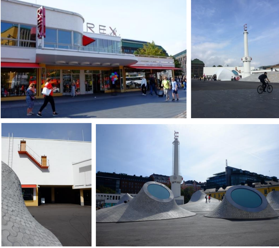
Şekil 4. Amos Rex ve Lasipalatsi Meydanı'nın farklı açılardan görünümü. (Karaylıanoğlu, 2019)

Müzeye yaya girişi, Lasipalatsi binası ile meydan ve caddede iki ayrı yönden sağlanmaktadır. Bu bağlamda yapıya hem cadde hem de meydan yönünden yaklaşılabilmekte ve yapı meydanla cadde arasında bir arayüz halini almaktadır. Girişte bilet satış ve resepsiyon ile birlikte bir kafe alanı yer almaktadır. Galeri alanları alt katta kurgulanırken, yapının üst katında bir restoran bulunmaktadır. İç mekânda, girişten itibaren hem cadde hem de meydan yönündeki geniş açıklıklar sayesinde kentle görsel temas sürmektedir. Belirli yönlerde kasıtlı olarak açılan çatı pencerelerinin, meydanın ortasındaki saat kulesi ya da cephedeki merdiven gibi çevrenin tanınabilir ayrıntılarına yönlendirildiği görülmektedir. Bu sayede yeraltı müzesi ve çevresindeki şehir arasında görsel bir temas kurulmaktadır (Şekil 5).