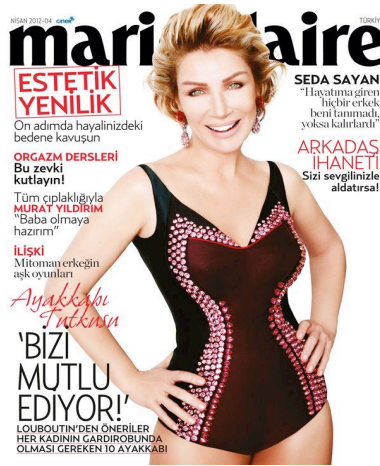
Resim 12. Marie Claire Dergisi'nin Nisan 2012 Sayısının Kapak Resmi

Marie Claire Dergisi'nin 2012 yılının Nisan Ayı'ndaki kapağında ses ve sinema sanatçısı Seda Sayan'a yer verilmiştir. Halktan biri olma imajına karşılık Seda Sayan'ın sıra dışı bir görünümle dergi kapağında yer aldığı görülmektedir. Dolayısıyla dergi ile seçilen kapak arasında bir tutarsızlık olduğu gözlemlenmektedir. Seda Sayan'ın kapak fotoğrafında yer almasıyla orta yaşlı bir kadının ince güzel ve çekici olabileceğē vurgulanmak istenmiştir. Kadının günümüzde her yaşta güzel olabileceğē mesajı da verilmek istenmiştir. Derginin Nisan Ayındaki kapağı için seçilen Seda Sayan'ın dekoltesiz ancak mayo benzeri giysisi ile yine cinsellik ve kadınsılık içeriğēine gönderme yapılmaktadır. Ayrıca sanatçının ellerinin belinde oluşu da Seda Sayan'ın yansıttığı çizgiye imgesine uygun bir biçimde "dominant" kişiliğinin bir göstergesi olarak kabul edilebilir. Ayrıca samimi gülüşü ve bakışları sanatçının estetik yönüne vurgu yapmaktadır.