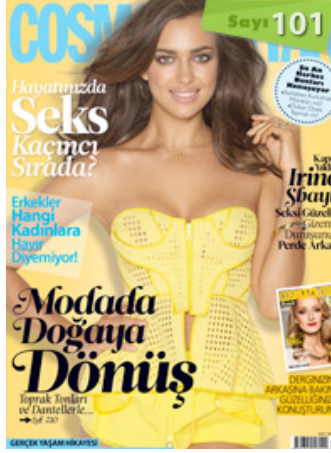
Resim 8. Cosmopolitan Dergisi'nin Mayıs 2012 Sayısının Kapak Resmi

olarak görülmektedir. Scarlett Johansson'dan farklı olarak oyunculuğundan çok, çekici görünümü ile medyada yer almaktadır. Kapakta beyaz elbise ile yer alışı adeta kafalara kazınmış sıra dışı imajını yıkmak ister niteliktedir. Derin göğüs dekoltesi başta masum olan imajının yanında cinsel çekiciliğini de ön plana çıkarmaktadır. Bir elinin kalçasına yakın belinde durması dominant kadın imajını gösterirken, dudaklarının dolgun ve açık oluşu ise cinsel bir nesne olma rolünü destekler niteliktedir. Saçların dolgun ve omuza düşer şekilde gösterilmesi ise; yaratılmış Venüs mitinin devamı niteliğinde olduğu söylenebilir.