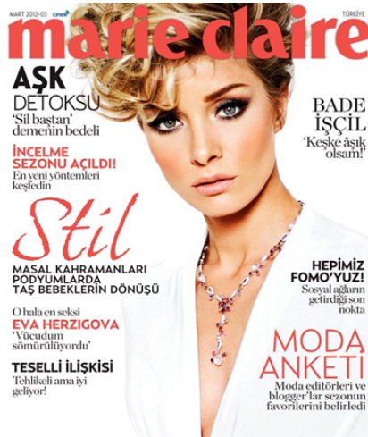
Resim 11. Marie Claire Dergisi'nin Mart 2012 Sayısının Kapak Resmi

Marie Claire Dergisi'nin 2012 yılının Şubat Ayı'ndaki kapağında sinema sanatçısı Angelina Jolie yer almaktadır. Dergi kapağındaki Angelina Jolie'nin ilk bakışta dudak ve gözleri dikkati çekmektedir. Derginin içeriğinin moda sektöründen çok, kişisel bakım ve kadın erkek ilişkileri üzerine kurulu olması nedeniyle dergi kapağında sanatçının bu şekilde bir konumlandırılmasının gerçekleştiği söylenebilir. Görselde Jolie'nin tek omzunun açık olmasıyla; cinselliğe vurgu yapılmaktadır. Görselde sanatçının elleri saçlarında olması ve elindeki yüzük, okuyucunun dikkatinin tamamen yüze ve saçlara odaklanılmasını sağlamaktadır. Böylece bu görselde de, geçmişte yaratılmış olan Venüs imgesinin devam ettirildiği de söylenebilir. Ayrıca sanatçının üstündeki mavi bluz ile göz rengine ilgiyi çelmeye çalışıldığı ve hafif açık dudaklarla da cinselliğin çağrıştırıldığı ifade edilebilir. Tüm bunların yanında birden fazla çocuğu olan ve çalışan bir anne figürü olarak da kadının her koşulda güzel ve bakımlı olabileceği ideal kadın mitine göndermede bulunmaktadır.