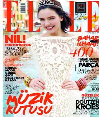
Resim 18. Elle Dergisi'nin Şubat 2012 Sayısının Kapak Resmi