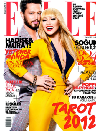
Resim 14. Elle Dergisi'nin Ocak 2012 Sayısının Kapak Resmi

Elle dergisi içerik ve konu başlıkları açısından ele alındığında birçok moda dergisi adı altında pazarda yer alan dergilere oranla daha çok "Moda" kavramına odaklı anıldığı gözlemlenmektedir. Ayrıca dergi daha az yerel göstergeler içermekte ve daha Avrupai bir yaklaşımı yansıtan bir moda dergisi olma özelliğini de taşımaktadır.