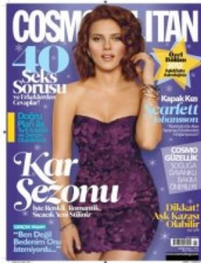
Resim 4. Cosmopolitan Dergisinin Ocak 2012 Sayısının Kapak Resmi

Cosmopolitan Dergisi; bir moda dergisi olmasının ötesinde kadın dergisidir. Dergi kapaklarının bütününe bakıldığında, öncelikli olarak, kadının elde etme gücünü destekleyen modern Afrodit yaratma konusunda tüketicilere kimi taktikler sunan bir kadın figürü kullanıldığı görülmektedir. Bu kadın görsellerinde okuyucunun dikkatini, taşıdığı elbiselerden çok, kendi kimlikleri ve sergiledikleri seksi görüntüler çekmektedir.