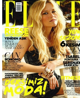
Resim 16. Elle Dergisi'nin Mart 2012 Sayısının Kapak Resmi

Elle Dergisi'nin 2012 yılının Şubat Ayı'ndaki kapağında tanınmış sinema oyuncusu Jennifer Aniston yer almıştır. Sanatçı görselde doğal bir görüntü çizmektedir. Makyajsız ya da doğal makyajıyla yüzüyle, güzel, çağdaş, bakımlı ve güçlü bir kadın imgesi çizmektedir. Dağınık saçları ve giydiği sıradan tişörtü ile metal ağırlıklı takıları ile cinsellikten çok daha doğal bir kadın imgesini güçlendirir niteliktedir. Bu görselde daha önceki dergilerde yer alan açık erotizm mesajına burada rastlanılmamaktadır. Bu görselde, kariyerli ve mutlu, güçlü, yapmacık tavırlardan uzak, samimi bir kadın imgesi çizilmektedir.