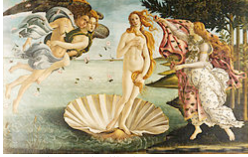
Resim 1. Sandro Botticelli'nin “Venüs’ün Doğuşu” Tablosu

olan dergilerin kapaklarındaki kadın imgesinin ve toplumsal yaşamdaki rolü sürekli değişime uğrayan kadının, özellikle de ekonomik sistemin, üretim ve tüketim biçimlerinin farklılaşmasıyla, yenilenen toplumsal rolleri kimi mitolojik kadın imgelerinin de ışığında ele alınarak, kadınların tüketim süreci içindeki konumları göstergebilimsel yöntemlerin de yol göstericiliğinde incelenmeye çalışılacaktır. Bu bağlamda çalışma kapsamında; Cosmopolitan, Marie Claire ve Elle dergilerinin kapaklarında yer alan yerli ve yabancı popüler ses sanatçıların ve sinema sanatçıların; duruşları, yüz mimikleri gibi kimi özellikleri ile mitolojik unsurlar barındıran Botticelli'nin “Venüsün Doğuşu” 2 tablosundaki gibi ‘idealize’ edilmiş, mitleşmiş kadın güzelliği arasındaki ilişki irdelenemeye çalışılacaktır.