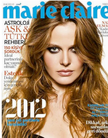
Resim 9. Marie Claire Dergisi'nin Ocak 2012 Sayısının Kapak Resmi

Marie Claire dergisi genel olarak ele alındığında içeriği ve hedef kitlesine gönderdiği iletileriyle Türk toplumun kültürel yapısına yakın bir dergi profili çizmektedir. Ancak dergi, çalışmaya konu olan diğer moda dergileriyle karşılaştırıldığında, derginin güncel moda kavramına yakın olmayan bir yayın politikasına sahip olduğu söylenebilir.