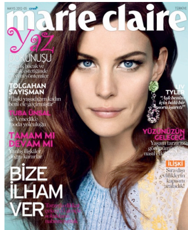
Resim 13. Marie Claire Dergisi'nin Mayıs 2012 Sayısının Kapak Resmi