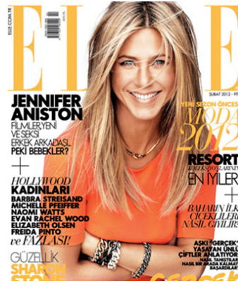
Resim 15. Elle Dergisi'nin Şubat 2012 Sayısının Kapak Resmi

Elle Dergisi'nin 2012 yılının Şubat Ayı'ndaki kapağında tanınmış sinema oyuncusu Jennifer Aniston yer almıştır. Sanatçı görselde doğal bir görüntü çizmektedir. Makyajsız ya da doğal makyajıyla yüzüyle, güzel, çağdaş, bakımlı ve güçlü bir kadın imgesi çizmektedir. Dağınık saçları ve giydiği sıradan tişörtü ile metal ağırlıklı takıları ile cinsellikten çok daha doğal bir kadın imgesini güçlendirir niteliktedir. Bu görselde daha önceki dergilerde yer alan açık erotizm mesajına burada rastlanılmamaktadır. Bu görselde, kariyerli ve mutlu, güçlü, yapmacık tavırlardan uzak, samimi bir kadın imgesi çizilmektedir.