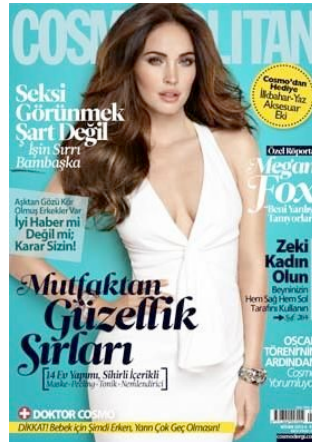
Resim 7. Cosmopolitan Dergisi'nin Nisan 2012 Sayısının Kapak Resmi

Cosmopolitan Dergisi'nin 2012 yılının Mart Ayı'ndaki kapağında Miranda Kerr görülmektedir. Victoria Secret modeli olarak ünlenen Miranda Kerr, özellikle doğum yapmasının hemen ardından verdiği çekici pozlarla pek çok kadının doğum sonrası "ideal kadın" olma umudunu simgeler niteliktedir. Modelin, üzerindeki dırapeli göğüs dekoltesi elbisesi erotik destekler niteliktedir. Boynundaki parlak takılar zenginliği çağrıştırırken, dikkati de dekoltesine çekmektedir. Duruşu ise; tıpkı bir Venüs duruşudur. Kadınsılığı ve ideal güzelliği anımsatan bu duruş, olunması gereken ideal kadın bedenini hedef kitlesi olan kadınlara göstermektedir. Bir eliyle saçlarını kulağının arkasına atıyor olması cinselliği vurgularken; saçın bir erotik gösterge olma durumu bu görselde de devam ettirilmektedir. Ayrıca modelin, diğer elinin belinin üzerinde durması dominant kadın figürünü akla getirmektedir. Kerr'in makyajsız yüzü; masumiyeti ve kırsal bir yerden gelen kız imajını da desteklenmektedir. Bunun yanında görselde Tanrıçalığı çağrıştıran "saf güzellik" de vurgulanmıştır. Kerr'in arka planında yer alan feminen pembe renk ise kadınsılığa ve gençliğe gönderme yapmaktadır.