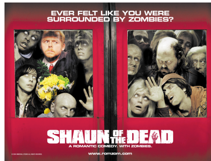
Resim 3: “Shaun Of The Dead” (2004, Yön: Edgar Wright) filminin afişi

Resim 2’de görülen ilk afişte Vapur ve çay tepsisi zombi beraber kullanılmıştır. Vapur İstanbul’un göstergesi konumunda iken çay tepsisi ve ince belli çay bardağı Türk kültürünün göstergeleri olarak göze çarpmaktadır. Zombi ise bunlardan bağımsız olarak Amerikan kültürünün göstergesi iken çay tepkisini elinde taşıması ise küreselleşme ekseninde bir uyarılmanın göstergesi konumunu almıştır. Bu zıtlıkların birlikte kullanımı bir komedi unsuruna dönüşmüş böylelikle korku unsuru ve komedi unsurunun zıtlığından korku / komedi türünde bir yapım olduğu iletisi ortaya çıkmıştır.