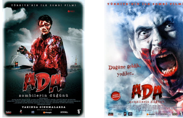
Resim 2: “Ada: Zombilerin Düğünü” filminin afişi

http://www.34beden.com/wp-content/uploads/2012/12/ada-zombilerin-dugunu1.jpg