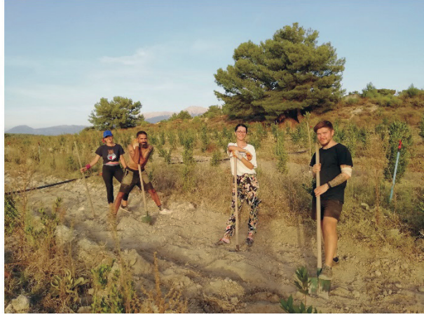
Fotoğraf 1: Ali Kışlak Ormanı Çiftliği ve Yerli-Yabancı Gönüllü Katılımcılar. Photo 1: Ali Kışlak Ormanı Farm and Local and Foreign Volunteer Participants.

bitkiler ile sebzeler yetiştirilmektedir. Çiftlik bahçesinde elde edilen ürünlerle salça, turşu, reçel ve pekmez yapılmaktadır. Ayrıca HerbaFarm Akademi’de permakültür prensipleri doğrultusunda ekolojik tarım, ağaç budama ve aşılama, tıbbi ve aromatik bitkiler konusunda uygulamalı eğitim seminerleri ve atölyeler düzenlenmektedir ( http://www.herbafarm.com.tr/herbafarm-hakkında ).