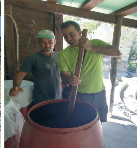
Fotoğraf 2: Knidia Çiftliği ve Restore Edilen Değirmende Şarap Fermantasyon İşlemi. Photo 2: Wine Fermentation Process at Knidia Farm and Restored Mill.