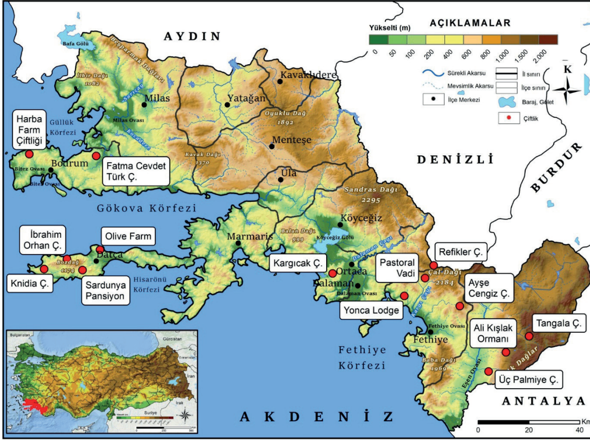
Şekil 1: Araştırmaya Konu Olan Çiftliklerin Muğla İli Genelinde Dağılışı. Figure 1: Distribution of the Farms Subject to the Study in Muğla Province.

Ayşe-Cengiz Genç Çiftliği (Fethiye): Çiftlik, Fethiye'nin 15 km kuzeyinde Yeşil Üzümlü mahallesine 5 km mesafede kızılçam ormanları arasında yer almaktadır. Yılın 12 ayı en az 3 hafta kalmak kaydıyla misafir kabul edilen çiftlikte, yabani ot ve sebze toplama, fide dikimi, mutfağa yardım, bahçe ve çevre işleri, odun toplama gibi faaliyetler yapılmaktadır. Doğal çevreyi ve kültürel kaynakları anlamaya çalışıp korumayı destekleyen çiftlikte turizm faaliyetleri ön planda olup, doğal alanlarını bozmadan ziyaretçilerine sunma amacı güdülmektedir. Konaklama kırsal konut ekolojisine uygun olarak inşa edilmiş ahşap ve taş evlerde yapılmaktadır.