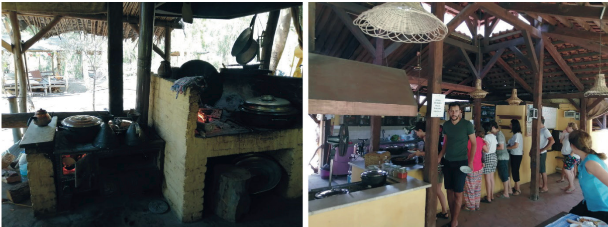
Fotoğraf 3: Pastoral Vadi Çiftliği Yemek Pişirme Alanı ve Gönüllü Katılımcıları. Photo 3: Pastoral Valley Farm Cooking Area and Volunteer Participants.

Tangala Çiftliği (Seydikemer): Yerel ağızda sincap anlamına gelen 'Tangala' çiftliği, Fethiye ile Kaş arasında yer