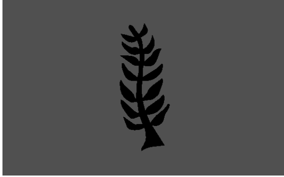
Resim 9: Nyam Nti