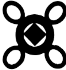
Resim 8: Sunsum

İnsan ruhunun ölümsüz oluşunun sembolüdür. "Nyam olmadığına yaşıyorum." olarak ifade edilir.