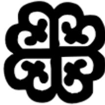
Resim 6: Nyam Dua

Nyam ağacını ifade eder. Nyam'ın varlığının ve onun koruyuculuğunun sembolüdür.