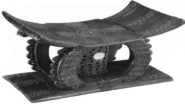
Resim 10: Golden Stool (Altın Tabure)