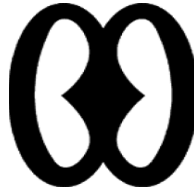
Resim 5: Nyam Biribi Wo Soro

Umut ve ilhamın sembolüdür. “Tanrım göklerde bir şey var. Duamı kabul et ki bana ulaşsın.” biçiminde bir anlama sahiptir.