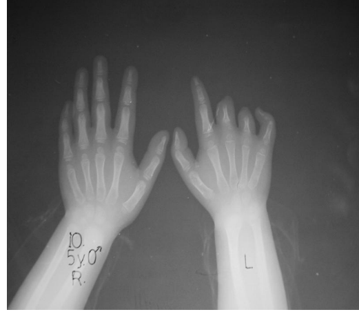
Resim 5. Ameliyattan 20 ay sonrası clin görüntüsü