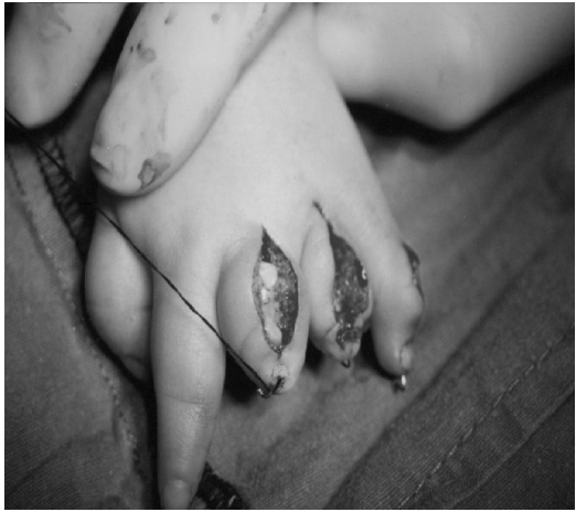
Resim 3. Ameliyat esnasında