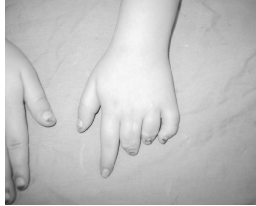
Resim 6. Ameliyattan 20Ay sonrası fonksiyonel görüntüsü