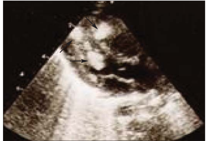
Resim 2. Ekokardiyografide her iki ventrikül içinde rbdomyomlar

Monitorize edilerek, aritmi açısından izlenen hastada, ventriküler erken vurular zamanla azaldı. Oniki günlükken çekilen 24 saatlik Holter EKG monitorizasyonunda 192 966 atımda 8104 atım tek şekilli ventriküler erken vuru saptandı. Kalpteki RM'ler hemodinamik bozukluğa yol açmadığı için cerrahi girişim düşünülmeyen hasta, 14 günlükken taburcu edildi. İzleminde iki hafta aralar ile yapılan ekokardiyografik incelemelerde RM'lerin küçüldüğü ve üçüncü ayda yapılan ekokardiyografide en büyük kitlenin çapının 5x4 mm'ye gerilediği gözlemlendi. Üçüncü ayda yapılan göz muayenesi ve tekrarlanan karın ultrasonografisi normal sınırlardaydı.