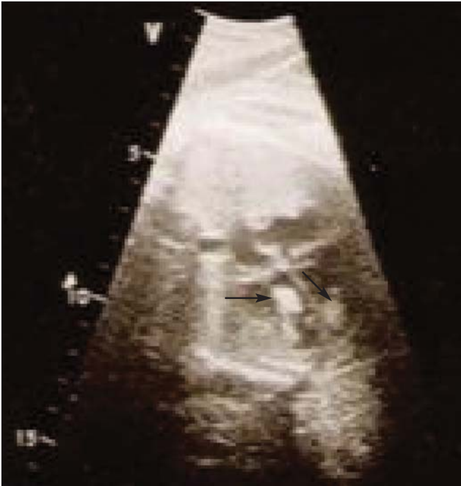
Resim 1. Fetal ekokardiyografide her iki ventrikül içinde rbdomyomlar

Elektrokardiyografisinde (EKG); ritm sinüstri ve 10-12 atımda bir ventriküler erken vurular izlendi. Sağ eksen