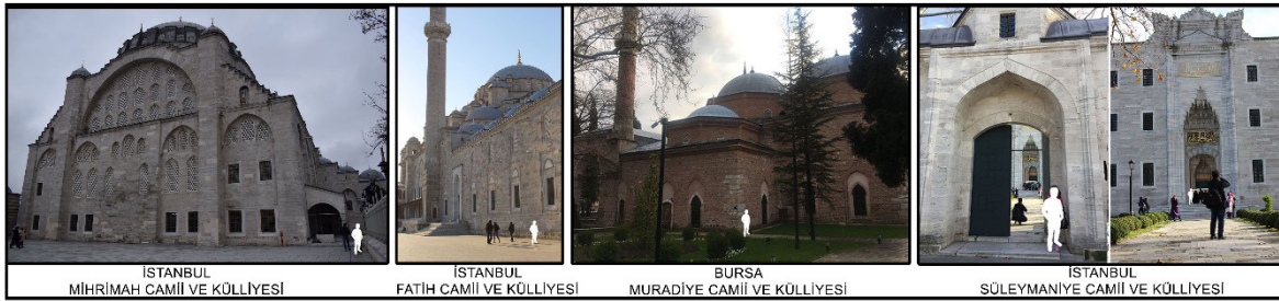
Görsel 5: Osmanlı Dönemi Mimari Üsluba Sahip Külliyeler

İkinci olarak, bu çalışmada Türkiye’de İstanbul ve Bursa şehirlerindeki Osmanlı Dönemi Külliyesi incelenmiştir. Osmanlı Mimarisi tek bir biçim ile sınırlı olmayıp farklı geometrik oluşumları bünyesinde barındırmaktadır. Prizmalar; küre parçaları, piramit ve konilerle birleşerek ritm oluşturmaktadır (Aksoy, 1975, s.117). İslam Mimarisi’nin etkisi altında olan Osmanlı Külliyesi’nde dış mekânda sadelik, iç mekânda estetik mevcuttur. İslam hayatında fani hayatın geçici olduğuna inanıldığı için gösterişten uzak durulur. Bu sebeple doğayla uyumlu bir mimari anlayış geliştirilmiştir (Aydeniz, 2015, s.200). İslam sanatı; kutbi, kübistik ve statiktir (Cansever, 2006, s.39). Örtüde kubbe veya parçalarının kullanımı bu durumu somutlar niteliktedir. Ana mekân da kubbeye bağlıdır. Bunun yanı sıra iç mekândaki ışık, yön gibi değerler de kubbeye bağımlı kalmıştır (Kuban, 2010, s.96-98). Çalışma kapsamında incelenen kilise yapılarının bir kısmı Görsel 5’te ifade edilmiştir.