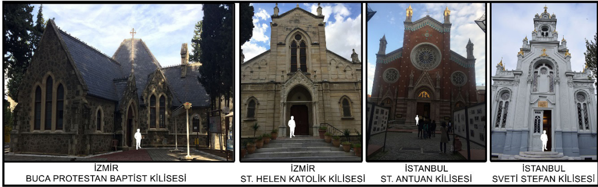
Görsel 4: Gotik Mimari Üsluba Sahip Kiliseler

Bu çalışmada Türkiye’de İstanbul ve İzmir şehirlerindeki Gotik Mimari üsluba sahip kiliseler incelenmiştir. Gotik Mimari’de kullanılan sivri kemerler, renkli camlar ve bezemelerin bulunduğu pencereler birlikte uyum içerisindedir. Farklı renkler ve küçük camlarla oluşturulan vitraylar, bu üslubun önemli bir özelliğidir (Cragoe, 2011, s.182-183). Yapının çatısına kadar uzanan yivli oklar, vitraylar ve yapının büyük ölçüde aydınlanmasını sağlayan gül pencereler bu mimarinin karakteristik bir özelliğidir. Bu üsluba sahip yapılarda dikey bir büyüme görülmektedir. Bu büyüme doğal ve karmaşık zengin süslemeyle iç içedir. Çalışma kapsamında incelenen kilise yapılarının bir kısmı Görsel 4’te ifade edilmiştir.