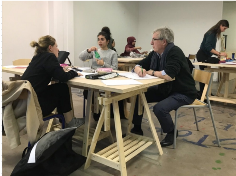
Fotoğraf 6: Öğrencilerle teke tek ilgilenilen uygulama derslerinin birinden görüntü

İzlediğim derslerde ilgimi çeken önemli noktalardan biri de profesörlerin dersleri aktif olarak yönetmesiydi. Öğretim elemanları uygulama derslerinde de öğrencilere teorik bilgiler vererek güncel sergileri tartışarak her daim aktif bir ders işliyordu (Fotoğraf 6). Bir başka husus derslerde soruya önem verilmesidir. Öğrencilerin kendi sanatsal çalışmalarını teorik olarak savunabilmesi, sorulara cevap vermesi, yeni sorular üretmesi ve bu yolla derse katılımı çok önemlidir. Benzer durum konferans şeklindeki derslerde ve konferanslarda da geçerlidir. Konuşmaların ardından mutlaka azımsanmayacak bir zaman dilimi tartışma bölümüne ayrılır. Olumsuz eleştiriler getirmekten ziyade katkıda bulunmak, daha iyi kavramak, geliştirmek, yeni sorular ortaya çıkarmak üzerine olan bu kısım hayli önemsenir. Tez savunmaları da öğrencilere açık olarak gerçekleşmektedir.