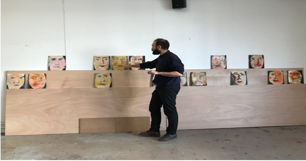
Fotoğraf 7: Öğrenci ders notunu almak üzere çalışmalarını sergileyip açıklarken

Bazı uygulama derslerinde öğrencilerin gruplar halinde çalışmalar üreterek kolektif çalışma becerilerini geliştirdikleri gözlemlenmiştir. Performans ve video (Görsel 8) derslerinde izlenen bu tip çalışmalar teknik zorlukların aşılmasına ya da düşüncelerin çeşitlendirilip zenginleştirilebilmesine fırsat ve kolaylık sunduğu için ayrıca önemlidir.