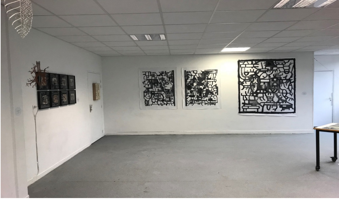
Fotoğraf 5: “Semaine des Arts” (Sanatlar Haftası) kapsamındaki sergilerden bir görüntü

Okulda dönem derslerinden farklı olarak ‘intensif’ dersleri bulunmaktadır. “İntensif” bir haftada yoğunlaştırılmış eğitim olarak tanımlanabilir. Eylül, ocak ve mayıs aylarında gerçekleştirilir. Zorunlu intensif dersi yalnızca birinci sınıftadır. Diğer sınıflarda ise isteğe bağlıdır. Bu dersler hem teorik hem de uygulamaya dayalı dersler için açılabilir. İsteyen öğretim üyeleri tarafından açılır. Dönem boyunca alınan ders saati bir haftada telafi edilerek kalınan dersten geçilmesi ya da sonraki dönem için önceden dersin başarılması olarak açıklanabilir. Beş gün boyunca sabahdan akşama dek süren, özellikle teorik dersler için çok yoğun geçen bu hafta yorucu olsa da uygulamalı dersler için verimli sonuçlar elde edilen bir süreçtir.