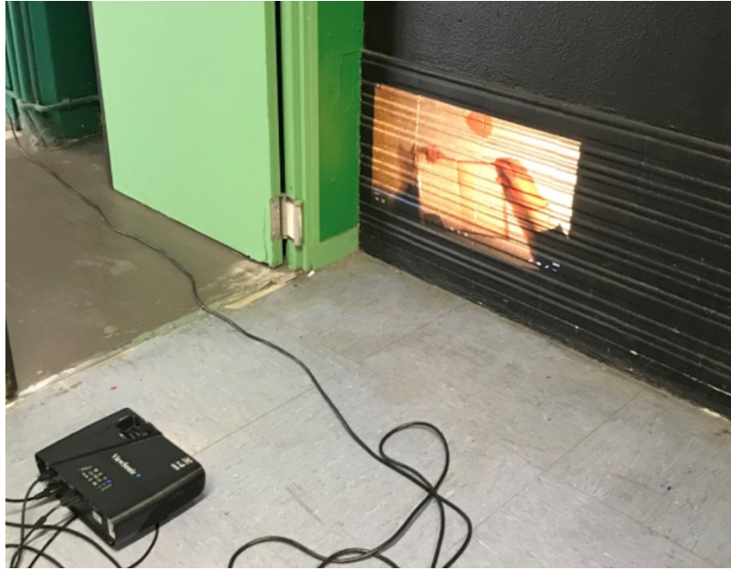
Fotoğraf 8: “Filmer, Observer, Projeter” dersinde bir grubun çalışmasının sunumu

Bazı uygulama derslerinde öğrencilerin gruplar halinde çalışmalar üreterek kolektif çalışma becerilerini geliştirdikleri gözlemlenmiştir. Performans ve video (Görsel 8) derslerinde izlenen bu tip çalışmalar teknik zorlukların aşılmasına ya da düşüncelerin çeşitlendirilip zenginleştirilebilmesine fırsat ve kolaylık sunduğu için ayrıca önemlidir.