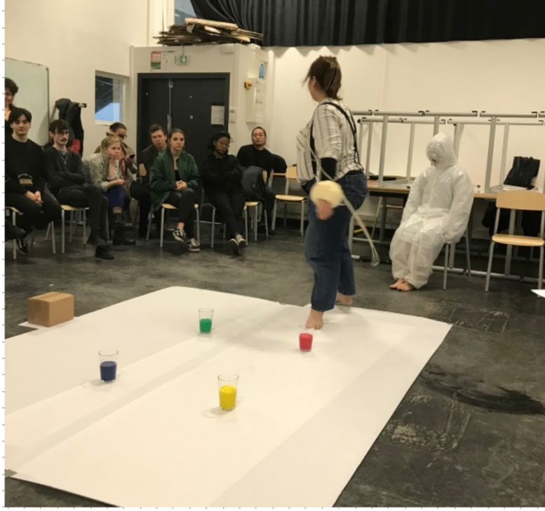
Fotoğraf 2: Performans dersinde bir grup öğrencinin performans çalışması

Bu konuda, bölümün, öğretim elemanına vereceği dersi kendisinin sunması ya da öğretim elemanının önerdiği dersi kabul etmemesi gibi bir durum gözlemlenen kadarıyla bulunmamakta idi.