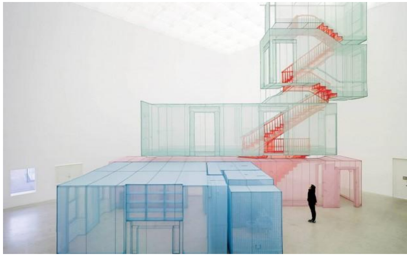
Görsel 5 Do-Ho Suh - İdeal Ev

Do-Ho Suh'un İdeal Ev'nde şeffaf materyaller üzerinden sınırlar üzerinde durulmuştur. Ziyaret edenleri hem mekânın içinde, hem de dışarıdan bir deneyime davet eden İdeal Ev şeffaf tekstil malzemeleriyle birebir boyutlarda tasarlanmıştır.