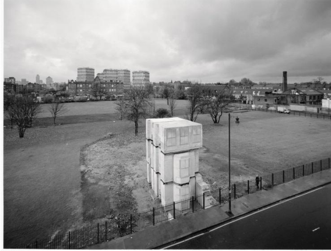
Görsel 4. Rachel Whiteread, House, 1993, Beton Döküm

Do-Ho Suh'un İdeal Ev'nde şeffaf materyaller üzerinden sınırlar üzerinde durulmuştur. Ziyaret edenleri hem mekânın içinde, hem de dışarıdan bir deneyime davet eden İdeal Ev şeffaf tekstil malzemeleriyle birebir boyutlarda tasarlanmıştır.