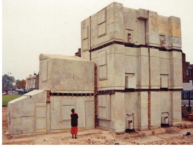
Görsel 3. Rachel Whiteread, House, 1993, Beton Döküm.