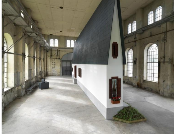
Görsel 1. Erwin Wurm, Narrow House / Dar Ev , 2010, 7x1,3x16m.