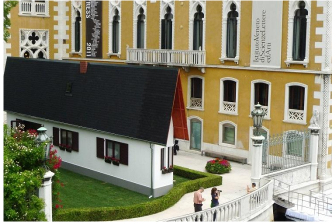
Görsel 2. Erwin Wurm, Narrow House / Dar Ev

Ev tekinsizleşen bir mekân olarak Rachel Whiteread'ın bazı eserlerinde izleyicinin karşısına çıkar. Bu anlamda Whiteread'ın en tanınmış çalışmalarından 'House' adlı eseri, sanatçının mekânı içten döküm ile kapalı kütle bir forma çevirerek yeni bir nesneye dönüştürdüğü, böylelikle heykelsi görünüm kazanan bir eve aittir (Görsel 3). Whiteread'ın 'Ev'i açık alan ve kapalı alan korkusu gibi mekânla ilişkili endişeyi, ya da açık ve kapalı mekanlar arasındaki zıtlığı, pozitif negatif ilişkisi çerçevesinde kinayeli ve ironik bir çarpıcı ürün/heykel olarak inşa eder (Talu, 2009: 130).